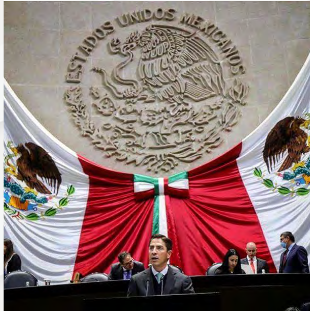
Conmemoración del aniversario del natalicio de Miguel Ramos Arizpe