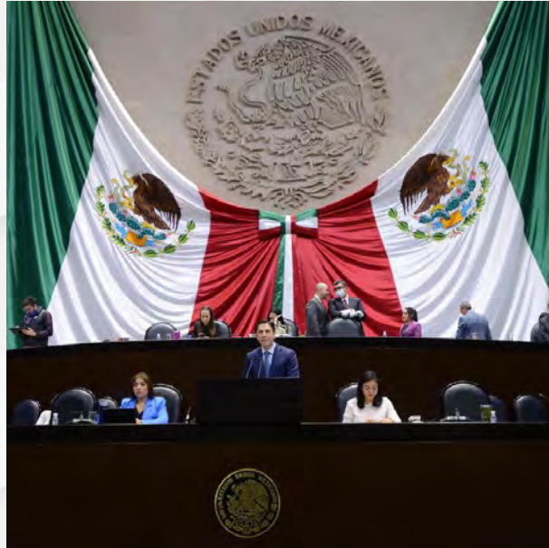
Conmemoración del Día de la Fuerza Aérea Mexicana