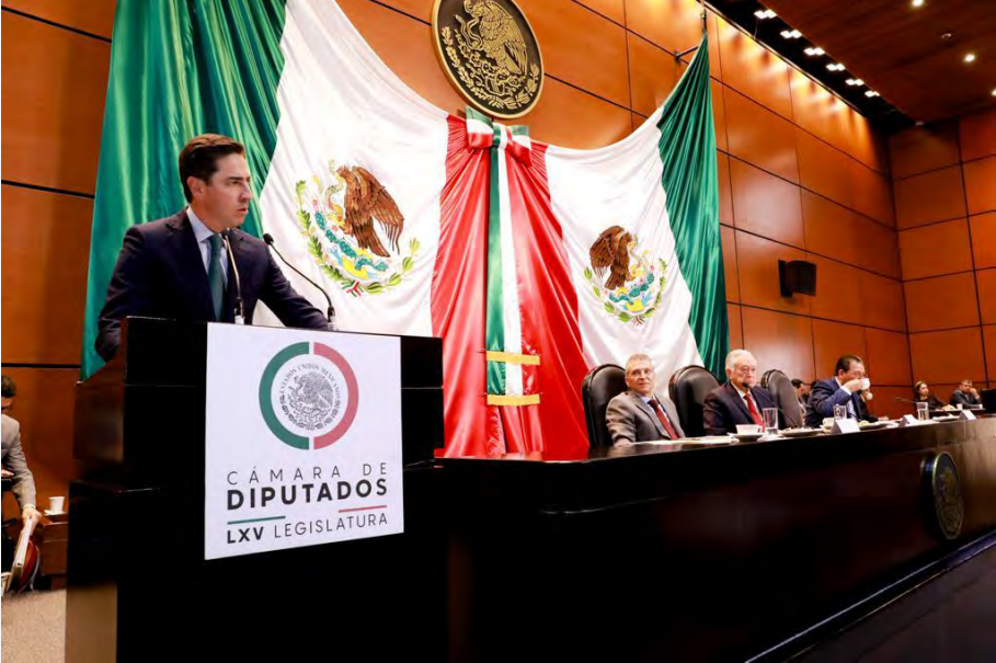
Comparecencia Director General de la CFE