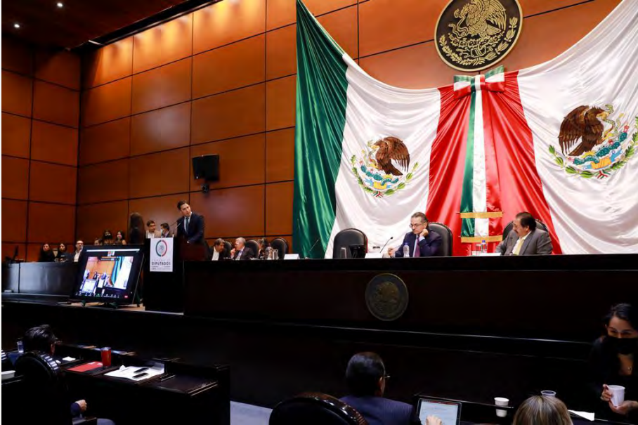
Comparecencia Director General de PEMEX