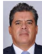
Dip. Cifuentes Negrete Román Entidad: Guanajuato Distrito: 2a. Circunscripción