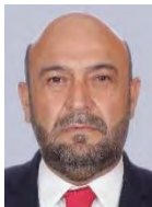
Dip. Fuentes Ávila Rodrigo Entidad: Coahuila Distrito: 2a. Circunscripción