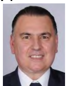
Dip. Peña Flores Gerardo Entidad: Tamaulipas Distrito: 2a. Circunscripción