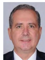
Dip. Godínez del Rio Enrique Entidad: Michoacán Distrito: 5