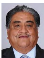
Dip. Borrego Adame Francisco Javier Entidad: Coahuila Distrito: 2