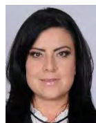
Dip. Zepeda Martínez Leticia Entidad: Estado de México Distrito: 5a. Circunscripción