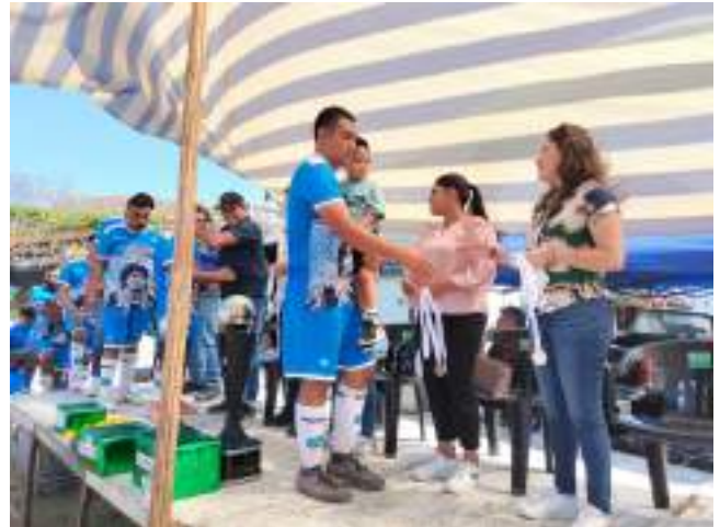
Participación en la premiación la Liga Champions de Cerro Gordo, Amatepec.

Por ello como legisladora federal seguiré impulsando más y mejor infraestructura para nuestros deportistas.