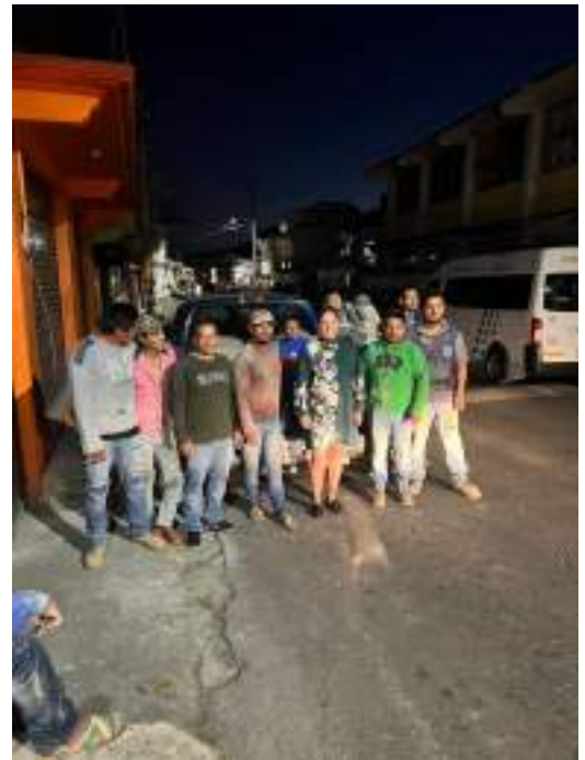
Entrega de apoyo para la obra de la Capilla de Los Ocotes, Tlataya.