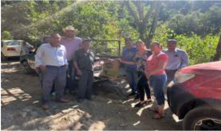
Entrega de apoyo a la comunidad 18 de mayo para la rehabilitación de la carrera