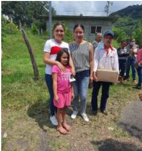
Entrega de apoyo en la comunidad Jalapa, Tejupilco