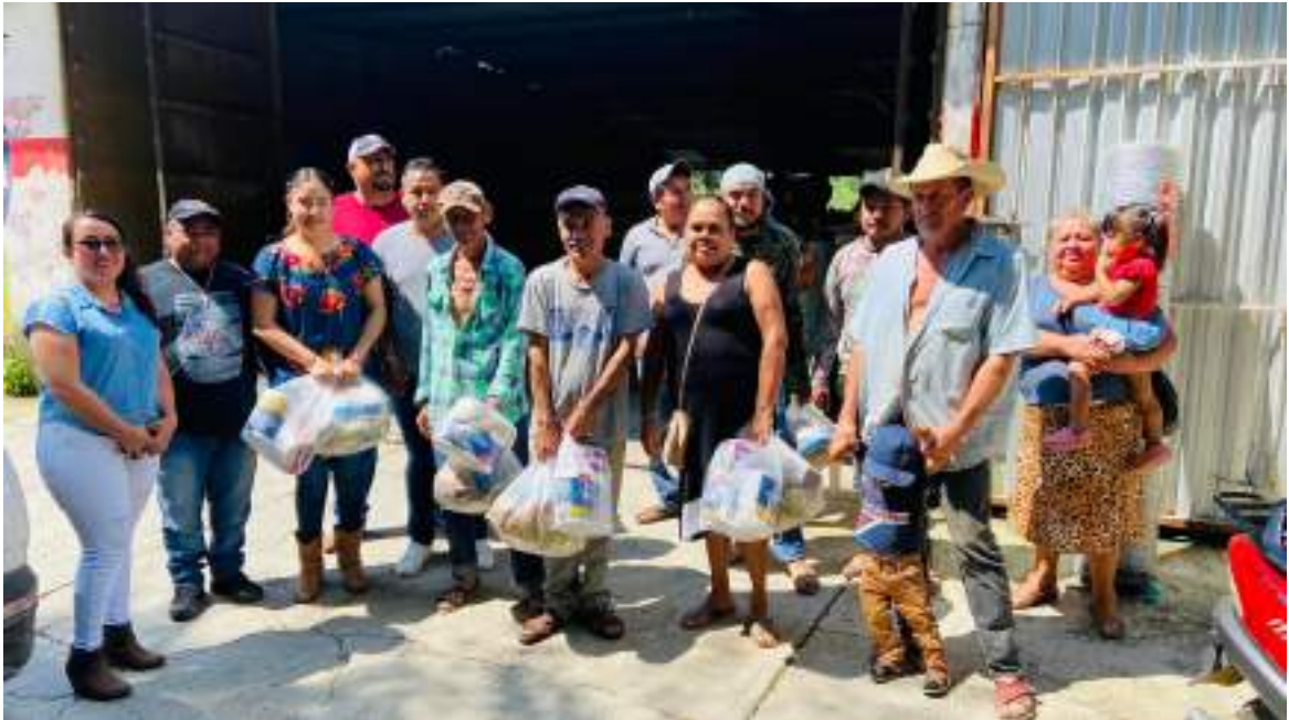
Entrega de apoyos a familias de San Felipe que apoyaron a los vecinos de la comunidad donde se desbordo el Rio San Felipe