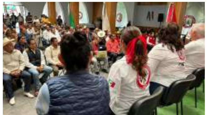
CNC Edo. Mex Congreso Estatal Extraordinario