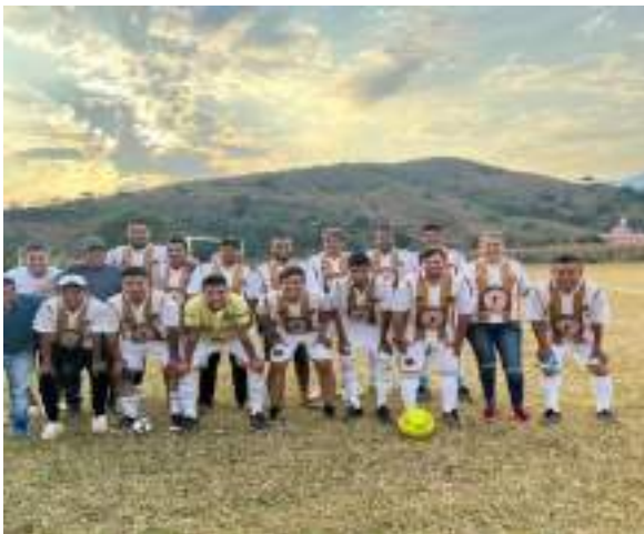
Donación de uniformes al equipo cafetaleros en la Liga Champions de Cerro Gordo, Amatepec.