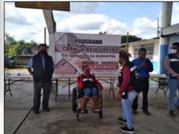
Programa de Carne a Bajo Costo