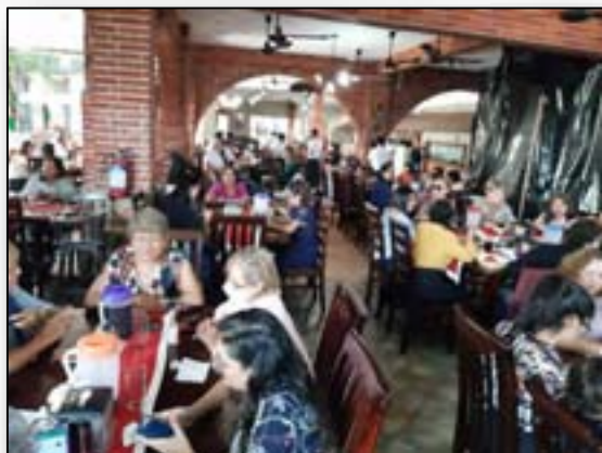
Celebración del Día de la Mujer