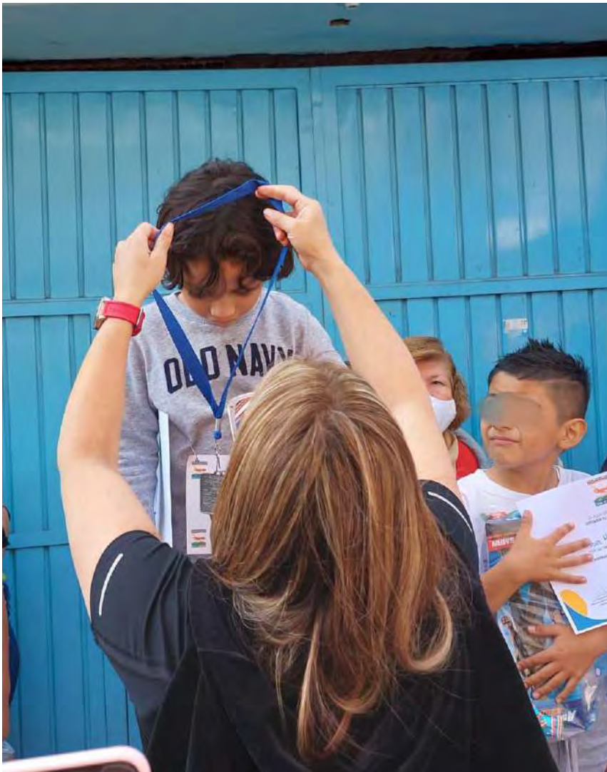
Premiando a los niños participantes de la tradicional carrera de San Sebastián en Azcapotzalco.

Debido a que el atletismo en los niños mejorar la fuerza y resistencia, sin olvidar la velocidad y el dominio del cuerpo, se promovieron justas deportivas entre niños y niñas.