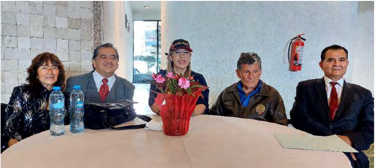
Reunión con activistas en contra de las adicciones.