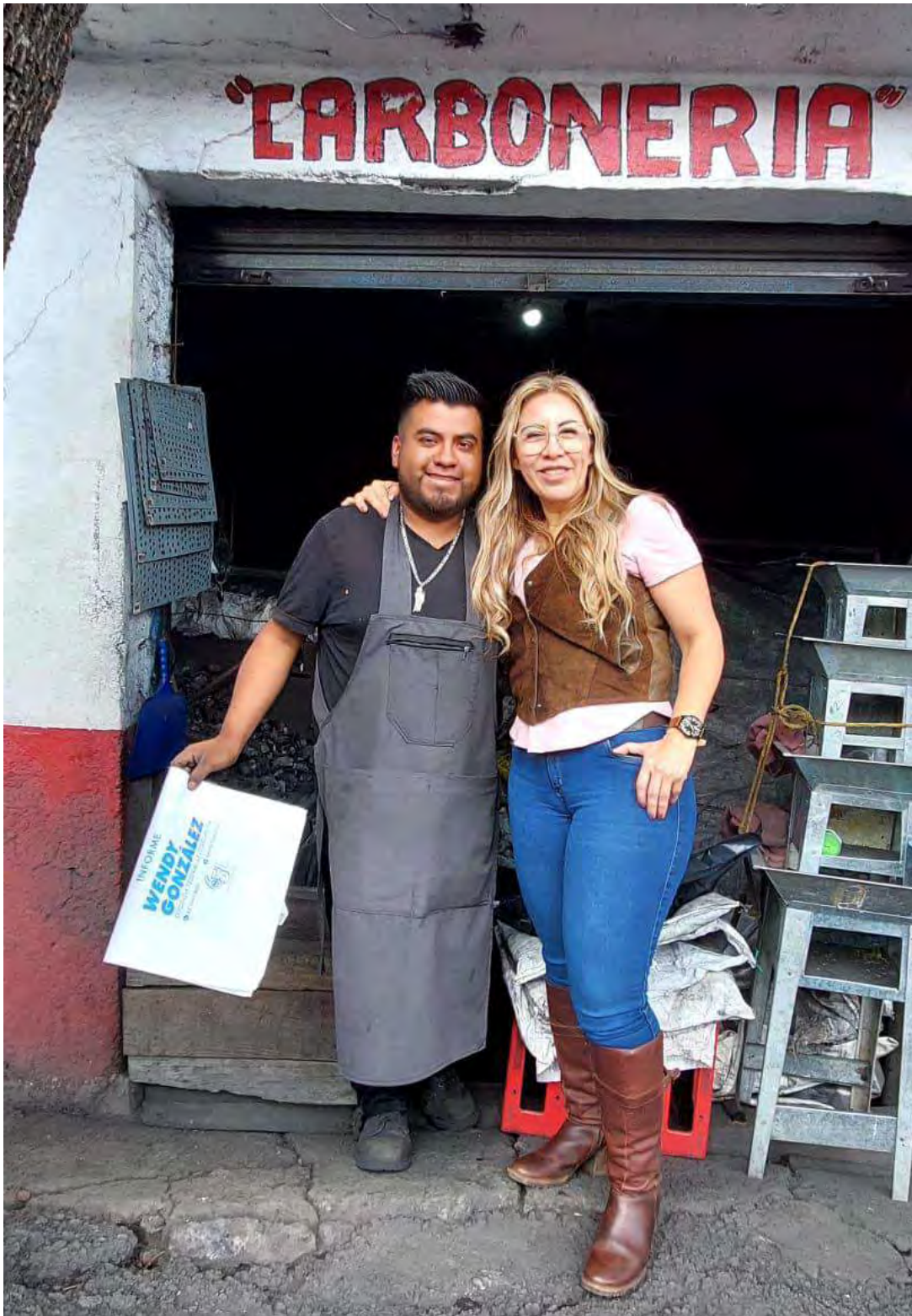
Recorrido para conocer las dificultades de los pequeños negocios.