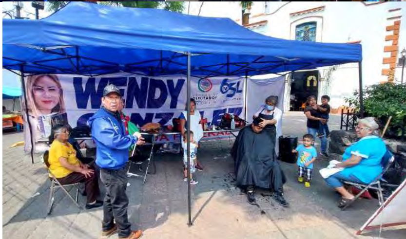
Jornadas sociales consistentes en apoyos a la salud, así como cortes de cabello, fotos infantiles e impresión de CURP.