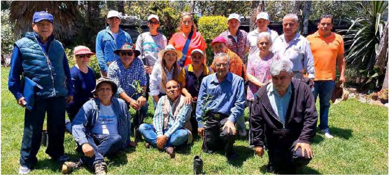
Reunión con ambientalistas al sur de la CDMX