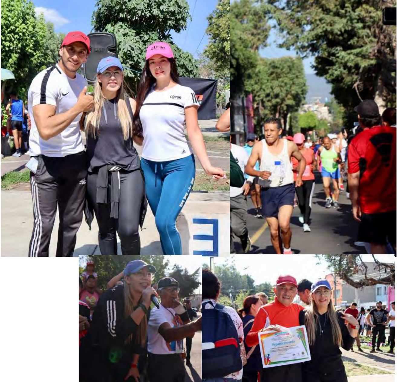
Fomento al atletismo entre la población joven y adulta a través de distintas carreras en pueblos y comunidades

Con la finalidad de impulsar el deporte y reforzar el tejido social de las comunidades, se llevaron a cabo diversas carreras atléticas entre jóvenes y adultos.