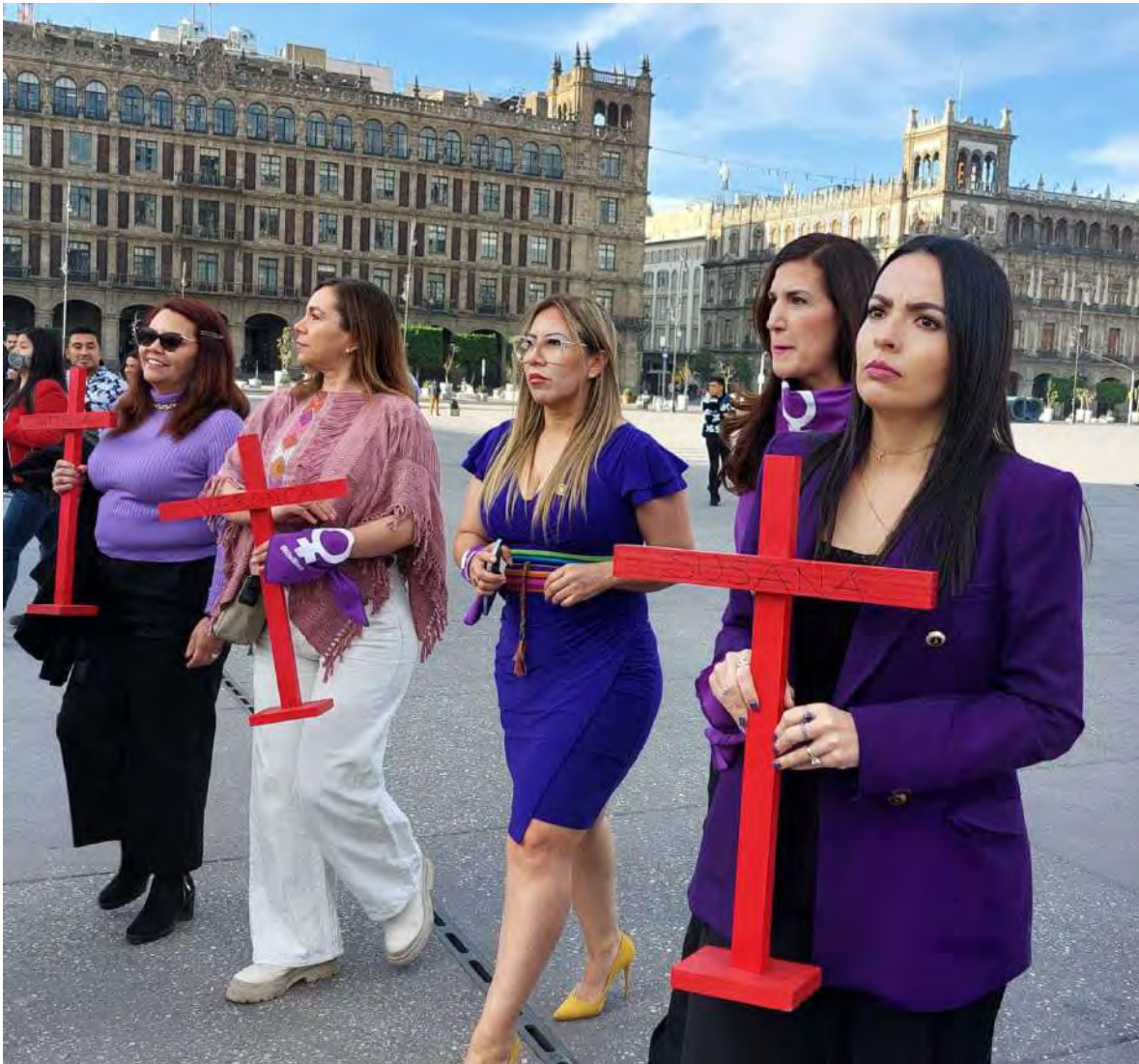
Marcha del 9 de marzo para erradicar la violencia contra la mujer.

En este contexto, se destacó que lamentablemente, cada vez se asesinan a mujeres más jóvenes, en la vía pública y otros lugares distintos a sus viviendas. Aunado a este problema la crisis ocasionada por el virus COVID-19 evidenció el contexto de desigualdad imperante en nuestra sociedad, y la necesidad de actuar colectivamente para transformar esta realidad