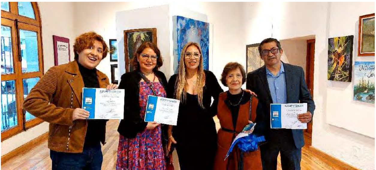
Reunión con artistas defensores de las aves de Xochimilco, en la exposición pictórica de la Casa de la Cultura en Azcapotzalco.