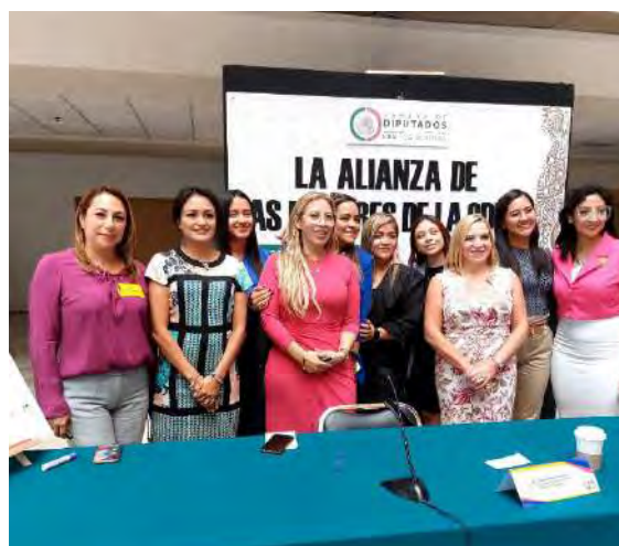
Alianza de mujeres de la CDMX para generar mejores condiciones de igualdad.

Con el fin de generar condiciones de igualdad entre hombres y mujeres, así como crear condiciones de seguridad y erradicación de la violencia, llevamos a cabo el evento social y político denominado, Alianza de Mujeres de la Ciudad de México, con la participación de senadoras, Diputadas Locales y Federales.