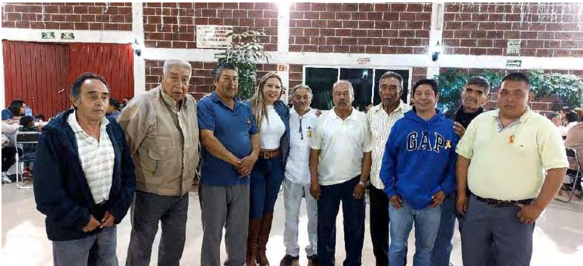
Mayordomía del pueblo originario de San Mateo Xalpa.

En la Ciudad de México se viven diversos problemas en los pueblos y barrios originarios en relación con el uso del suelo, la planeación del territorio, el medio ambiente, así como con las formas tradicionales de organización y gobierno, derivado de estas complejidades, se llevaron a cabo diversas reuniones con este sector de la población.