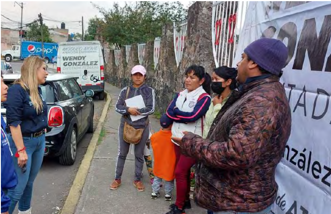
Reunión con vecinos para levantar demanda de buena energía eléctrica

Entre las más significativas tuvimos las siguientes: