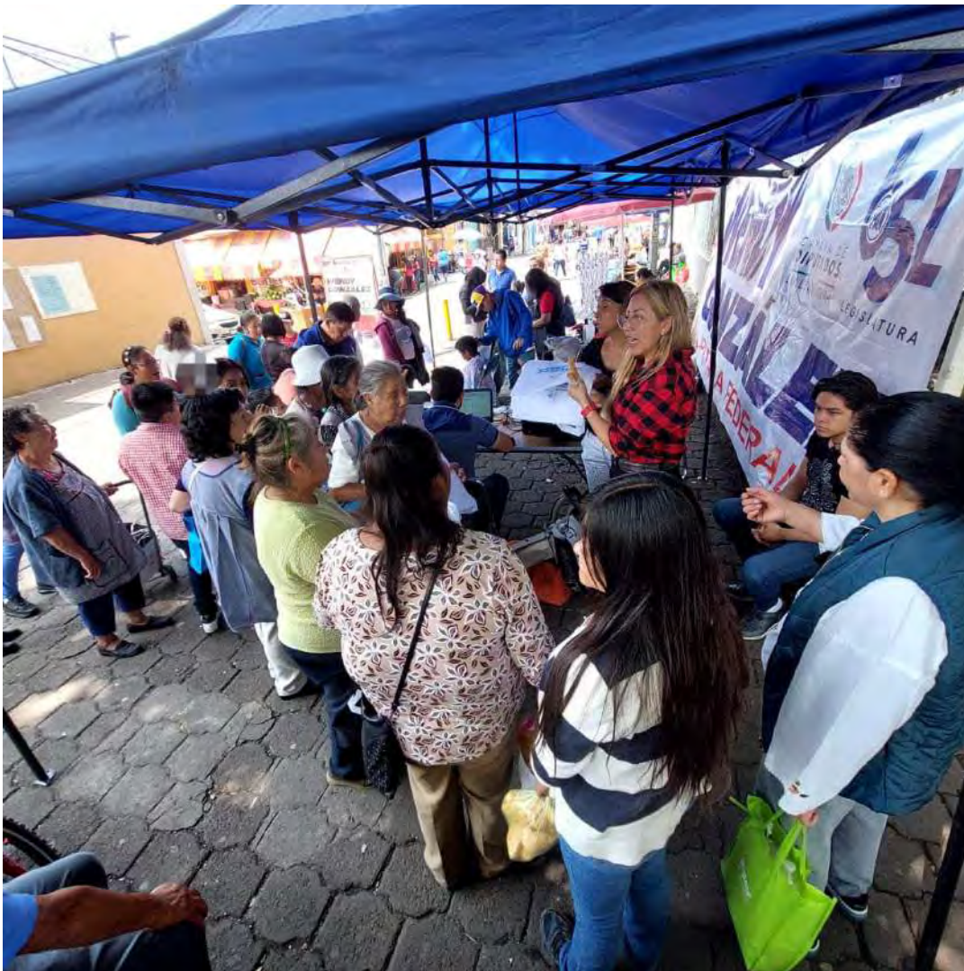
Jornadas de apoyo al regreso a clases, con cortes de pelo gratis, fotos infantiles e impresión de CURP.

Después del confinamiento social, por la pasada pandemia de Covi-19, las secuelas aún se sienten en la comunidad escolar, por ello se continuaron jornadas de apoyo para el regreso a clases, como jornadas de corte de cabello, fotos infantiles para los menores, talleres y dinámicas participativas para favorecer la integración social.