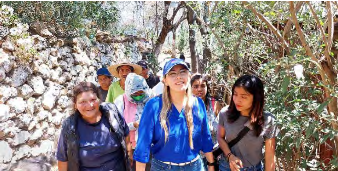
Recorrido por asentamientos que aún requieren de los servicios básicos de agua, drenaje, alcantarillado y alumbrado.