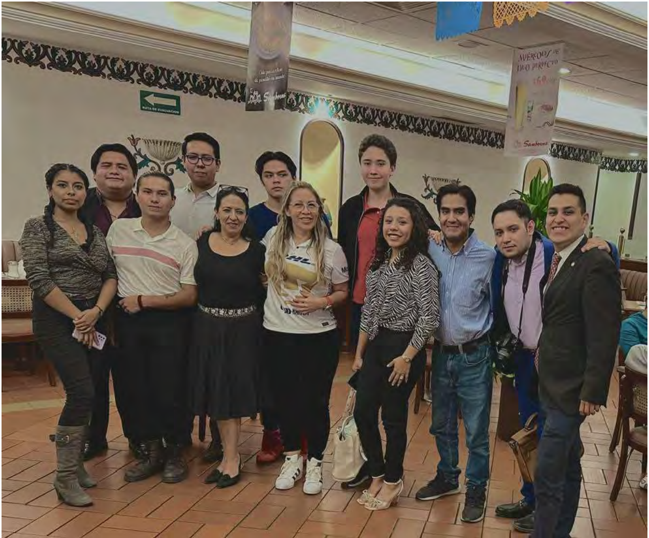
Reunión con jóvenes interesados en la inclusión, la libre expresión, la cultura y el deporte.