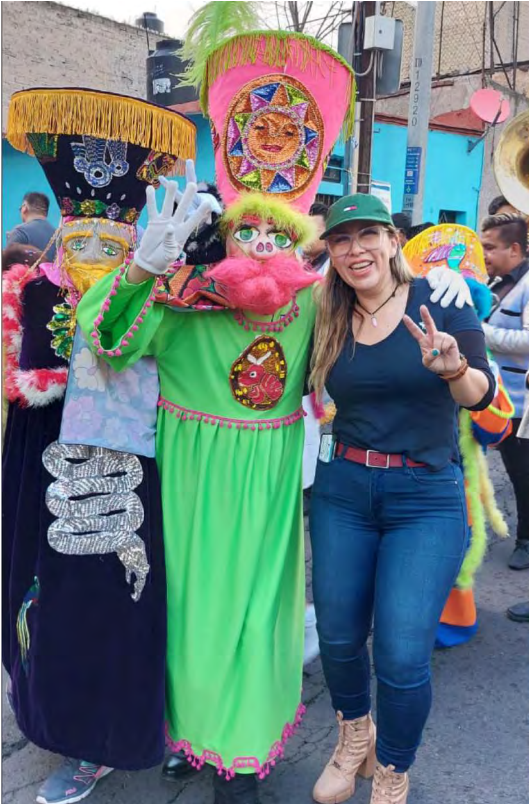
Los chinelos son parte fundamental de las fiestas tradiciones en la CDMX.