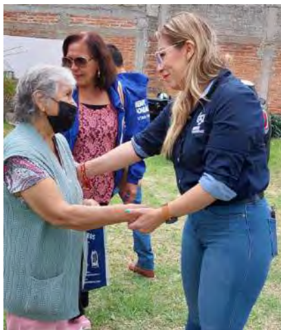
Jornada “sanemos juntos”

Tomando en cuenta esta situación, se dio continuidad a la campaña “Sanemos Juntos”, en la cual un especialista tanto en tanatología y manejo de emociones, brindó terapias grupales durante este segundo año legislativo, llevándose a cabo 10 sesiones.