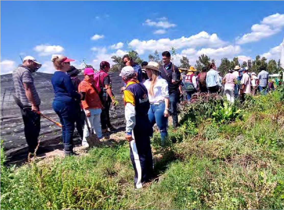
Un gran recorrido por la zona chinampera de Xochimilco para conocer la problemática de los floricultores y horticultores locales.