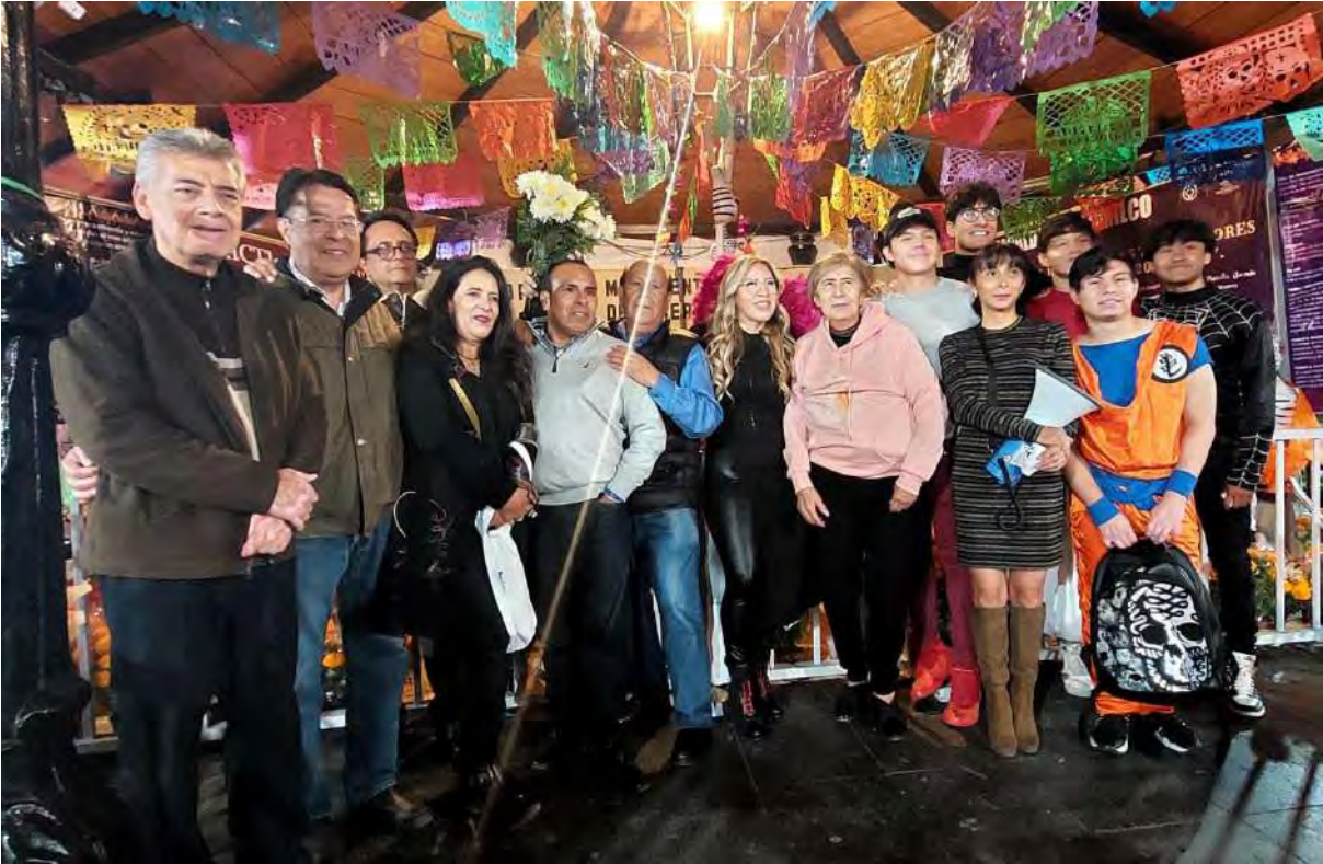
Participando en las fiestas tradicionales de los pueblos originarios.