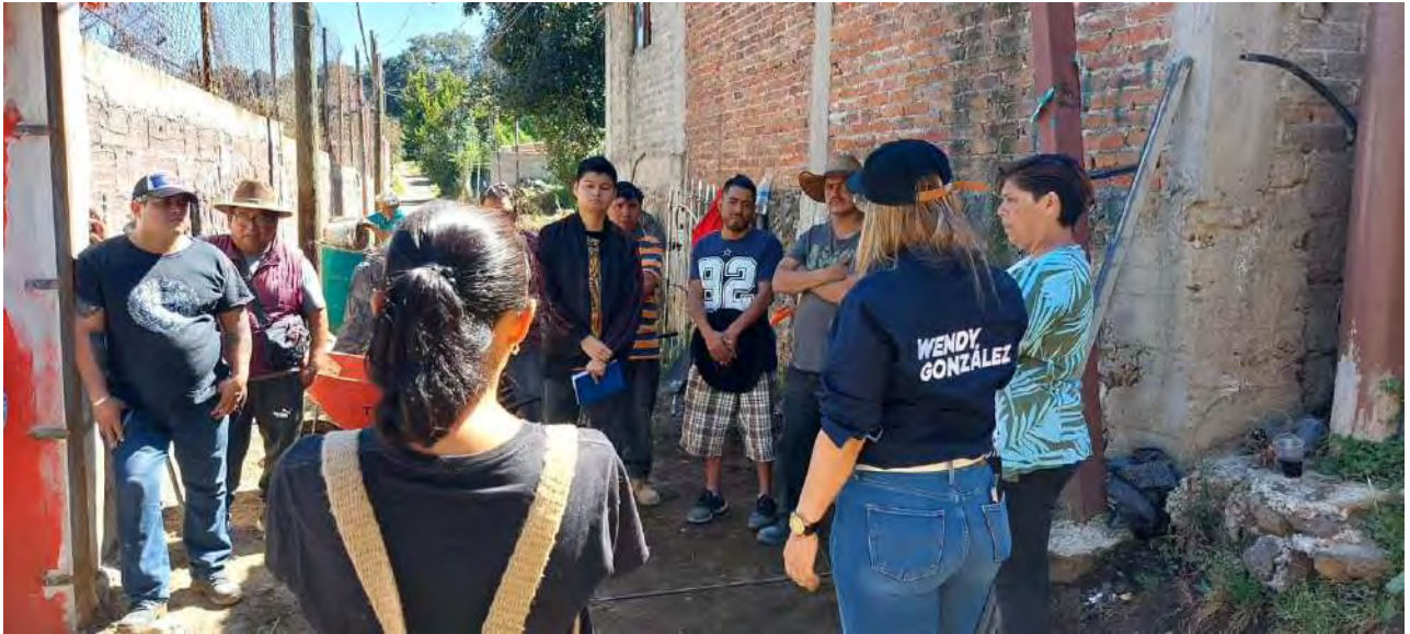
Reunión para levantar las necesidades en materia de alumbrado, infraestructura hídrica y seguridad.