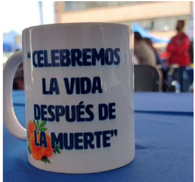
Impulsamos la gastronomía como parte de las fiestas tradicionales.