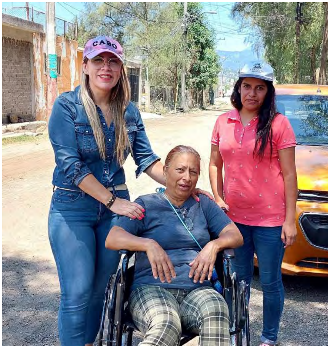
Apoyando la movilidad de personas con discapacidad para impulsar su acceso a la ciudad.

En este segundo periodo legislativo se entregaron 45 apoyos consistentes en sillas de ruedas o bastones, para mejorar la movilidad de personas con discapacidad, ya sea al interior de sus hogares o para favorecer el derecho humano a la ciudad.