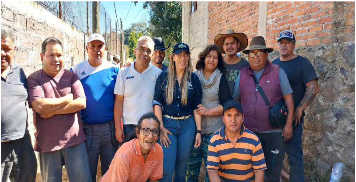
Recorrido para detectar la falta de luminarias públicas.

En este rubro se realizaron 51 recorridos vecinales entre los cuales podemos resaltar los siguientes: