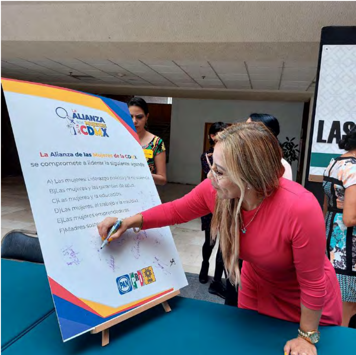
Firmando el acuerdo de la Alianza de las Mujeres de la CDMX para un mayor desarrollo y equidad entre las mujeres.