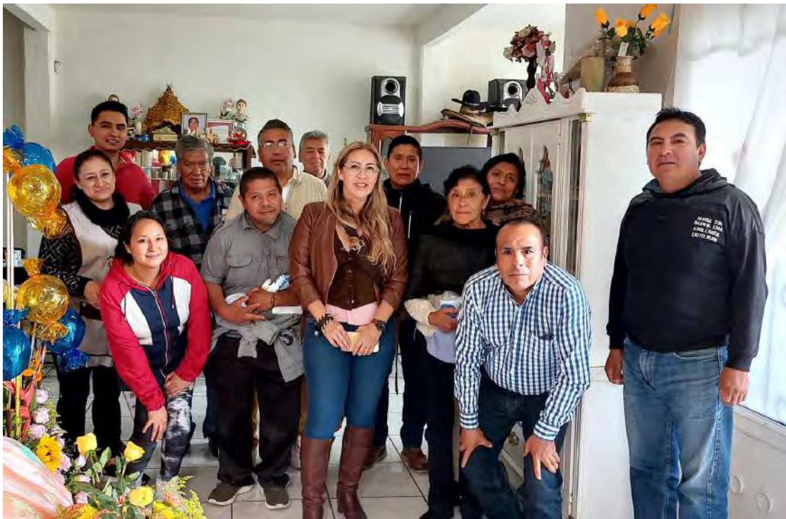
Reunión con vecinos y activistas sociales.