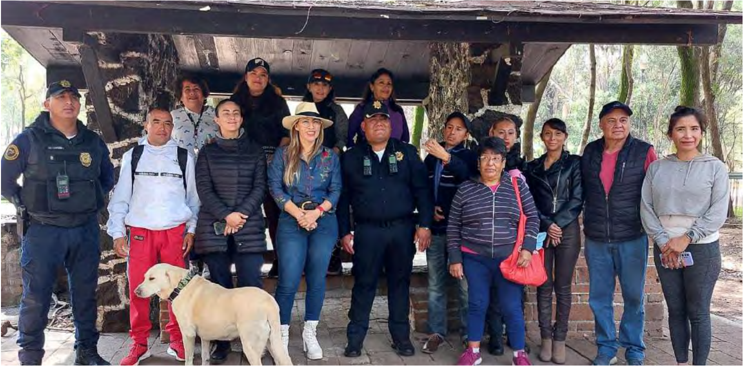
Reunión con activistas defensores de los animales y autoridades para poner un alto al maltrato animal.