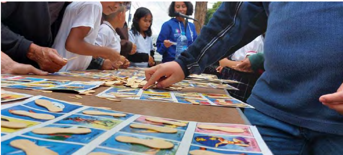
Jornada "Juégatela conmigo"

Continuando con la preocupación de disminuir los problemas mentales y emocionales se llevaron a cabo 45 sesiones de ludo terapia consistente en juegos de mesa, como un método de utilización del juego para combatir problemas de tipo emocional, que si bien está indicado sobre todo para niños y jóvenes, ya en la instrumentación, se integraron chicos y grandes, pues el juego es una actividad que trasciende las edades.