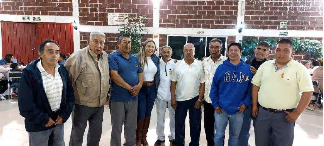
Reunión con mayordomos del pueblo originario de San Mateo Xalpa.