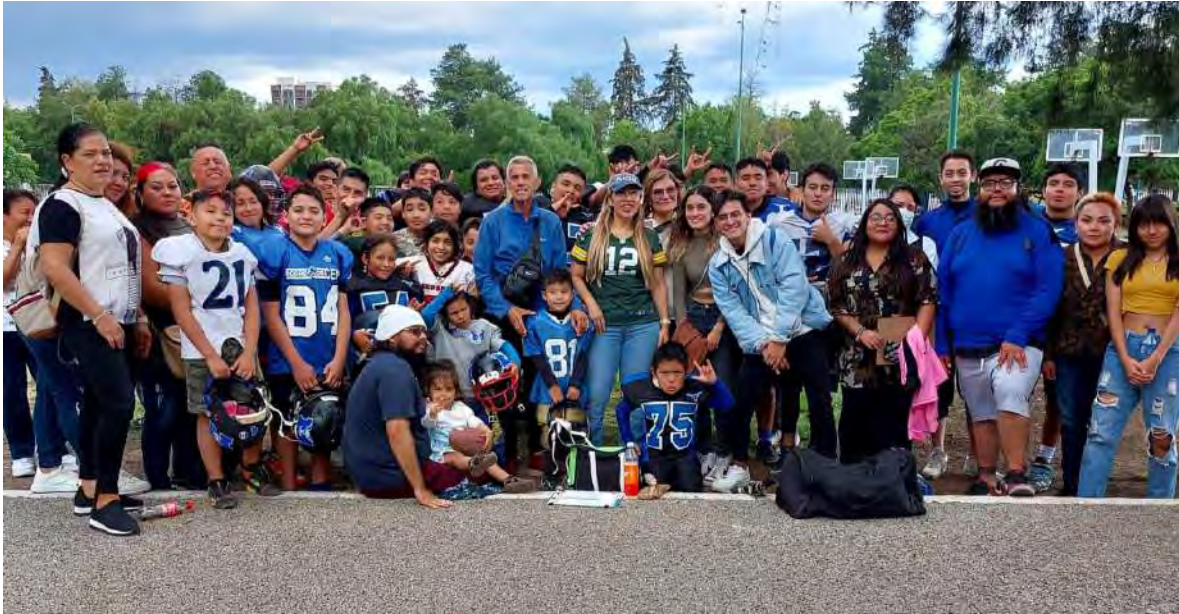
Fomento del futbol americano como deporte que forja el orden la disciplina y el trabajo en equipo.

En este periodo legislativo se ha impulsado el futbol americano, ya que constituye una disciplina que fortalece el cuerpo, fomenta el trabajo en equipo y el pensamiento estratégico, además de alejar a los jóvenes de los vicios.