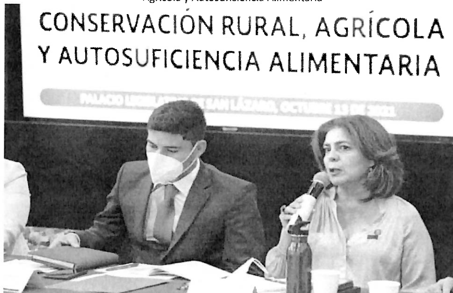
Fuente: Equipo de comunicación social del Dip. Otoniel García, 13 de octubre de 2021.