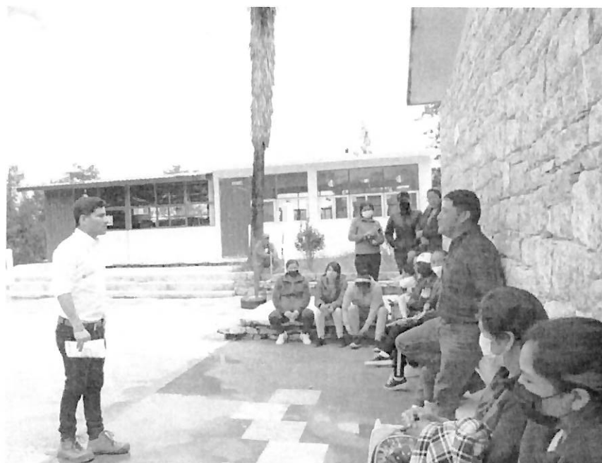
Fotografía 7. Reunión con padres de familia de la escuela comunitaria de Trancas, Zimapán

Fuente: Equipo de Comunicación social del Dip. Otoniel García, agosto de 2022