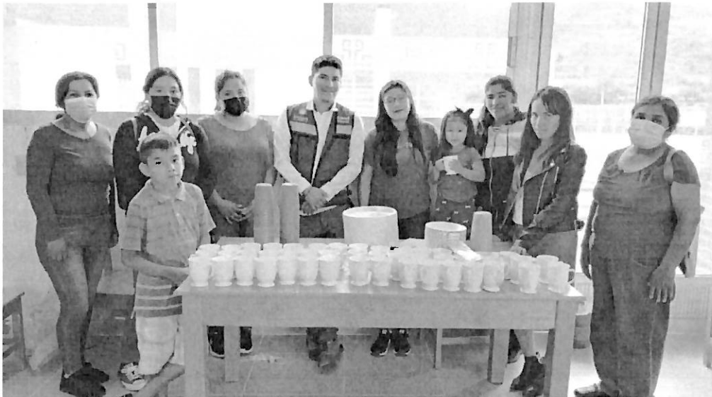
Fotografía 9. Donativo de utensilios al comedor comunitario en Aguas Blancas, Zimapán.