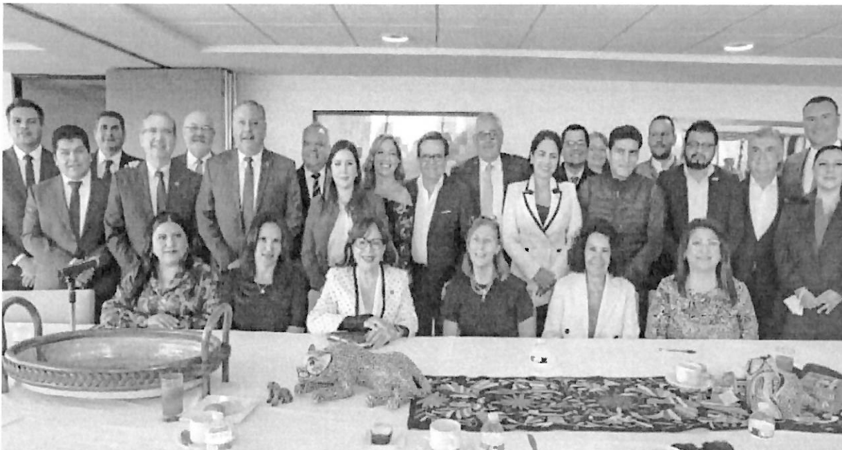
Fotografía 3: Reunión con la secretaria de Economía