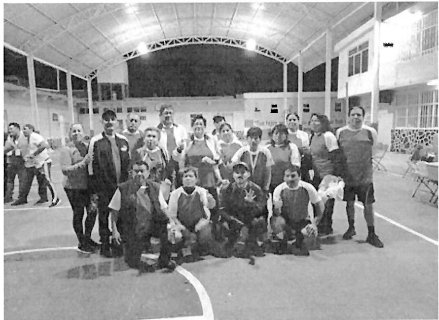
Fotografía 13: Entrega de uniformes al equipo de Cachibol de maestros Jubilados, Zimapán, Hidalgo

México hay alrededor de 5.2 millones de personas