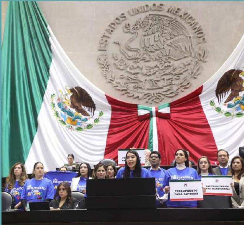
PRESENTACIÓN DE RESERVAS DURANTE LA DISCUSIÓN DEL PRESUPUESTO DE EGRESOS DE LA FEDERACIÓN 2023