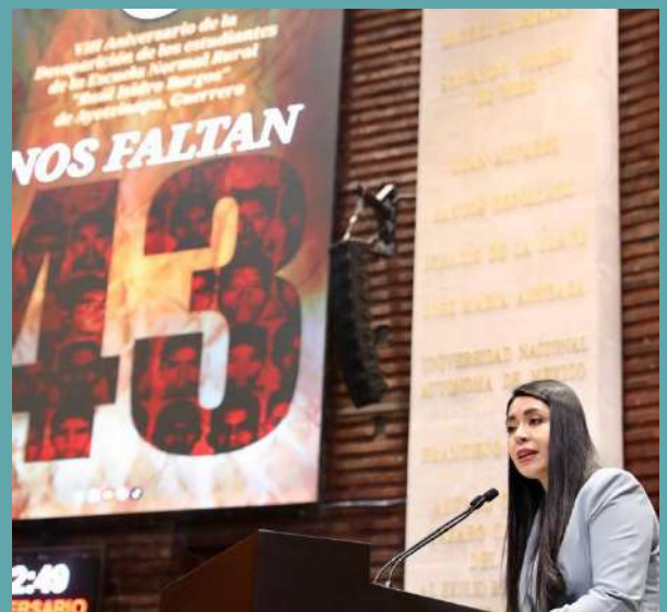
VIII ANIVERSARIO DE LA DESAPARICIÓN DE LOS ESTUDIANTES DE LA ESCUELA NORMAL RURAL "RAÚL ISIDRO BURGOS" DE AYOTZINAPA, GUERRERO

"La seguridad de nuestro país no puede ser una utopía"