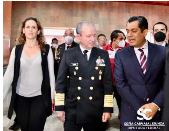
Firma de un convenio entre la Secretaría de Marina y la Cámara de Diputados.