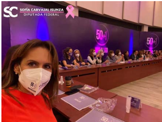
Instalación del colectivo 50+1 Hidalgo, segura que sumando hacemos más contra la violencia de género y la igualdad entre mujeres y hombres.