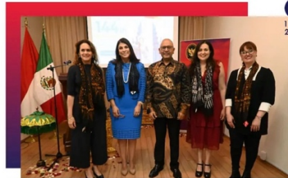
Banquete para la Delegación Parlamentaria Mexicana rumbo a la 144ª Asamblea de la UIP