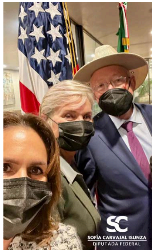
Con el Embajador Ken Salazar y la Secretaria de Energía, Jennifer Granholm, de Estados Unidos.