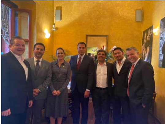
Toma de Protesta de Mauricio Trejo Pureco como alcalde de San Miguel de Allende, Guanajuato.

Con el Gobernador Diego Sinhue, platicamos sobre los retos y logros de su administración.