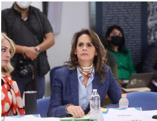
Inauguración de los Foros de la Coalición VaPorMéxico sobre Reforma Electoral