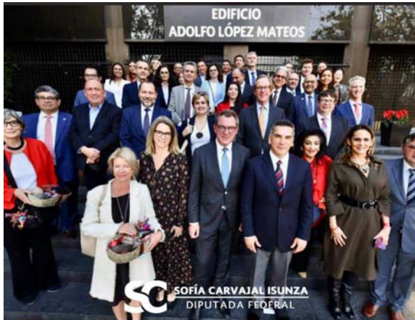
Encuentro con el Cuerpo Diplomático acreditado en México.