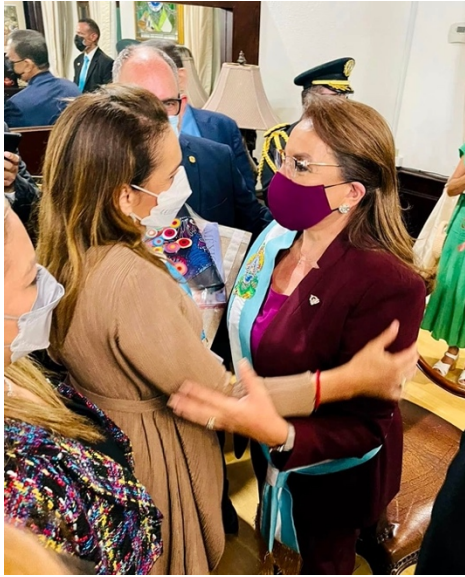
Juramentación de mi amiga y compañera Xiomara Castro, como la primera mujer presidenta de Honduras.