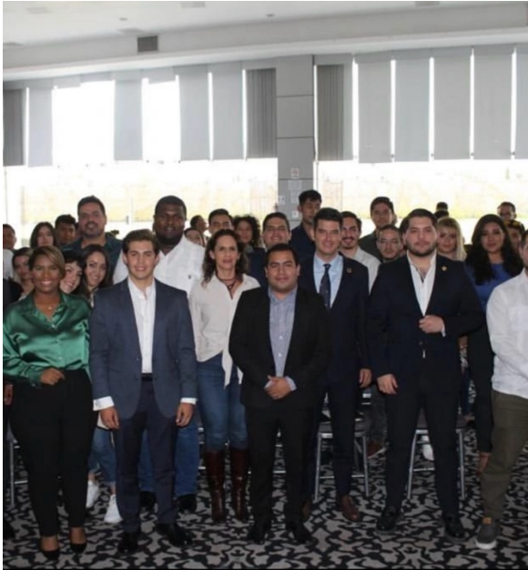
Foro "La construcción de la agenda ambiental sustentable", propuestas para energías limpias y el bienestar animal.