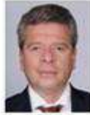
Ismael Brito Mazariegos Presidente