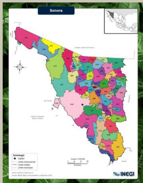
Imagen 1. Mapa de Sonora

Se realizó la construcción de una planta de energía solar en Puerto Peñasco, suceso histórico en la transición energética del país con el que 2 mil hectáreas de paneles solares abastecerán de energía limpia a miles de familias. Este proyecto es llevado a cabo con el apoyo del Presidente de la República y el Gobernador de Sonora.