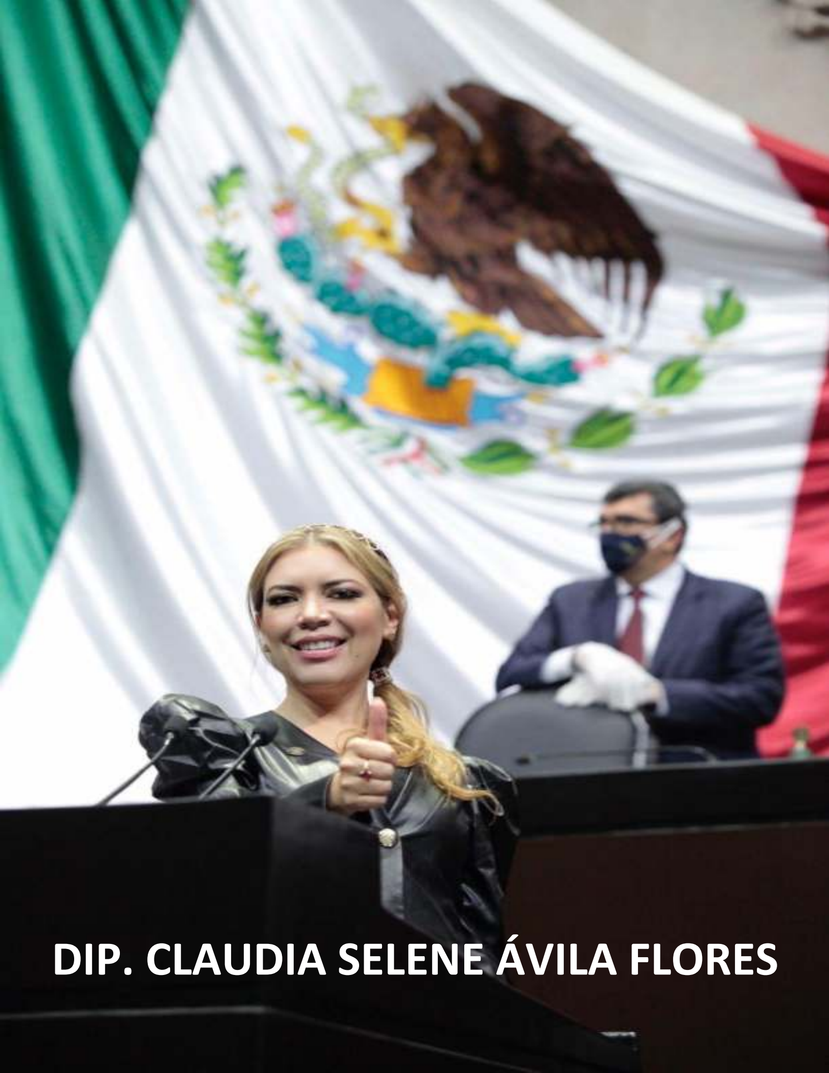
DIP. CLAUDIA SELENE ÁVILA FLORES