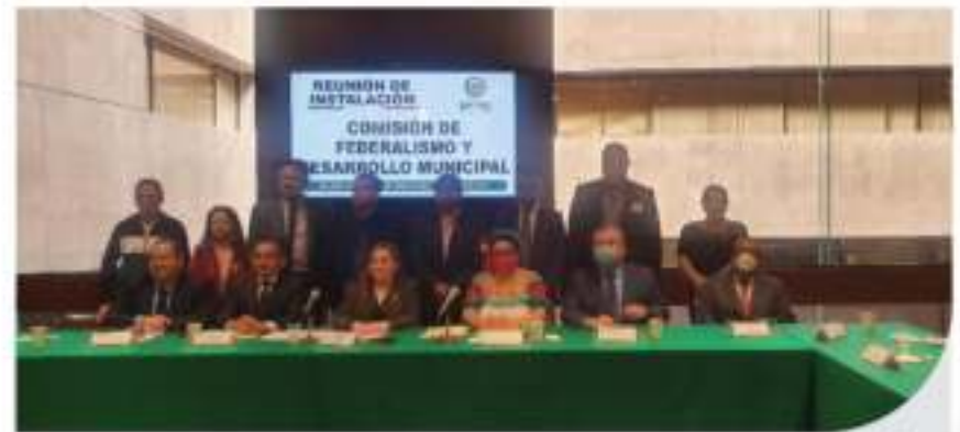
Instalación de la Comisión de Federalismo y Desarrollo Municipal 20 de octubre de 2021

La misión de esta instancia legislativa es consolidar el federalismo como la forma de organización del estado mexicano, con respeto a características, capacidades y culturas que hay entre las regiones, estados y municipios del país.