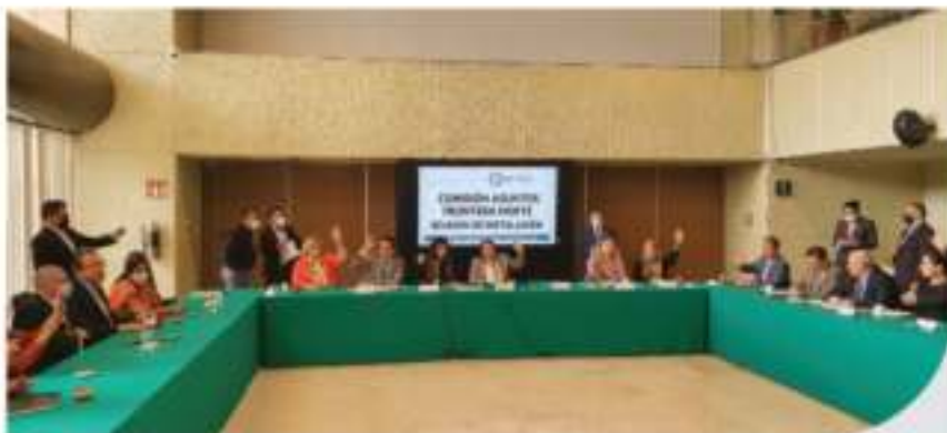
Instalación de la Reunión de la Comisión Asuntos Frontera Norte 20 de octubre de 2021

El principal propósito de la Comisión de Asuntos de la Frontera Norte, es crear o modificar los ordenamientos jurídicos y de gestión fortaleciéndolos a favor de la población, mejorando el desarrollo económico, comercial, social, cultural, laboral, y mejorar las relaciones políticas bilaterales, a fin de garantizar condiciones de igualdad en estos sectores tanto a nivel nacional como internacional.