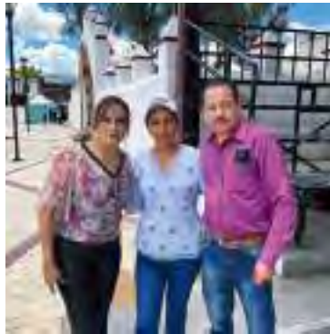
San Agustín Tlaxiaca