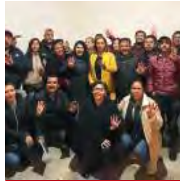
Mineral del Chico