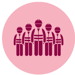
Trabajo y Previsión Social