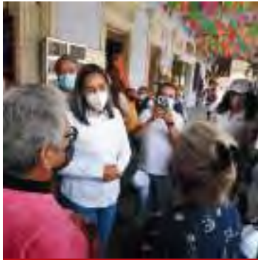
Mineral del Monte