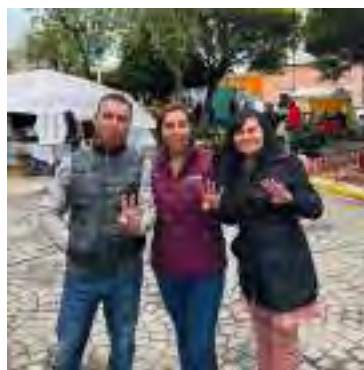
Atotonilco el Grande