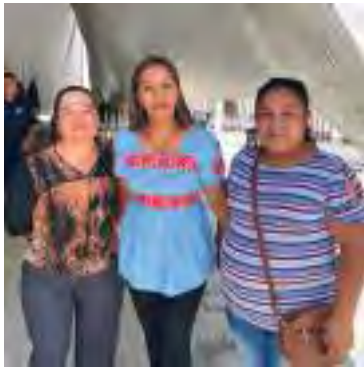
San Agustín Metzquitlán