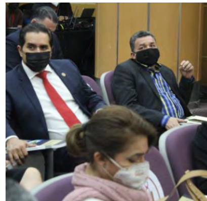
6 de noviembre de 2022. Reunión con el director de CONAGUA, Organismos operadores de agua y diputados integrantes de la Comisión.

Es importante destacar, que la Suprema Corte de Justicia de la Nación ha mandado al Poder Legislativo la creación de una nueva Ley General de Aguas. El origen de este mandato, está en el art. tercero transitorio del Decreto por el que se adicionó un párrafo sexto al Art. 4to Constitucional, reforma que reconoce el Derecho Humano al Agua, publicada en el Diario Oficial de la Federación el 8 de febrero del 2012, en dicho transitorio, se establecían 360 días para emitir una nueva Ley General de Aguas.