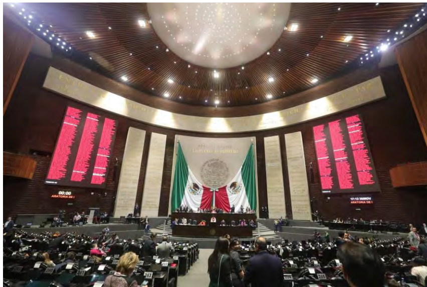
Fotografía.- Sesión de H. Congreso de la Unión. Diciembre 2022.

Por lo que un servidor comenzó así su participación el segundo año de Ejercicio Legislativo formando parte de las Comisiones de Hacienda y Crédito Público, Trabajo y Previsión Social, así como de Presupuesto y Cuenta Pública.