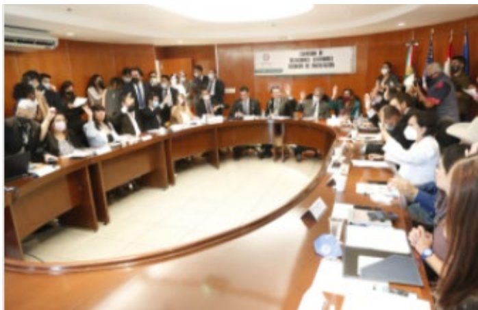
Oct 14, 2021, Boletín No.0228

Adicionalmente es fundamental la relación de México con otros países, pues ello contribuye a la reactivación económica a través del libre tránsito de las personas y el turismo.