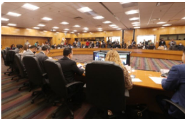
Boletín No. 327

Por otro lado, se calendarizaron las reuniones que son de gran importancia por el tema presupuestal.