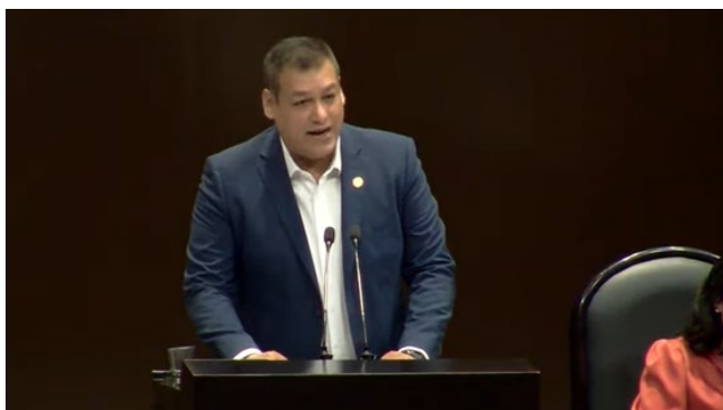
Boletín No.1737, Cámara de Diputados

Dentro de la intervención al pleno, puntualice que es necesario garantizar los derechos de niñas, niños y adolescentes. Además, el matrimonio infantil es parte de un ciclo repetitivo de carencias, pobreza y desigualdad.