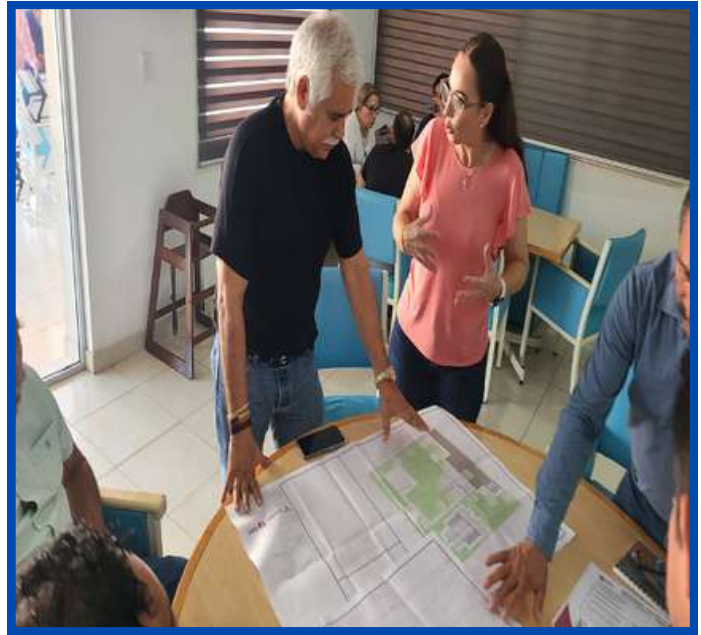
Proyecto de agua en el Municipio de Xicotencatl