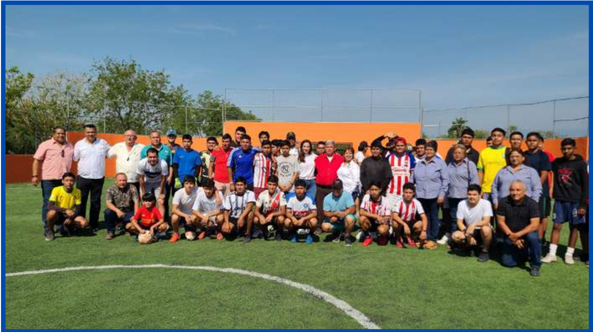
Donación de balones a distintos equipos de fútbol.