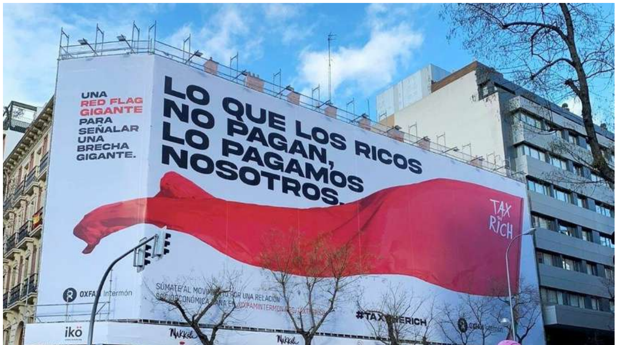
INTERMÓN OXFAM, 2023.