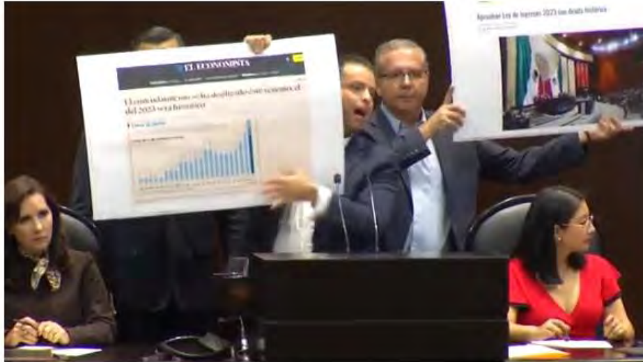
Dip Miguel Ángel Varela Pinedo intervención en tribuna