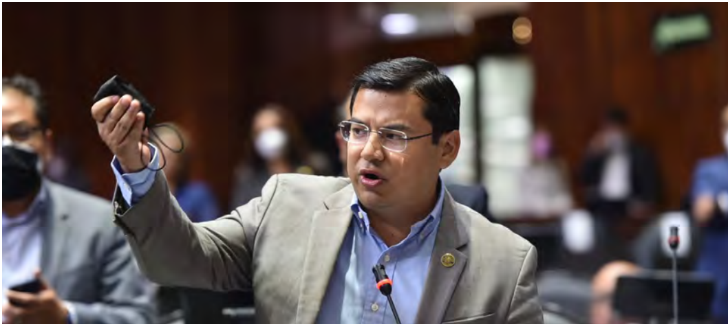
DISCUSIÓN DEL PRESUPUESTO DE EGRESOS 2022