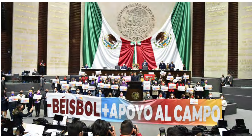
APOYO DESDE TRIBUNA PARA RECURSOS AL CAMPO

En la discusión del Presupuesto de Egresos presentamos reservas para apoyar al campo, las familias, la salud y la reactivación económica.