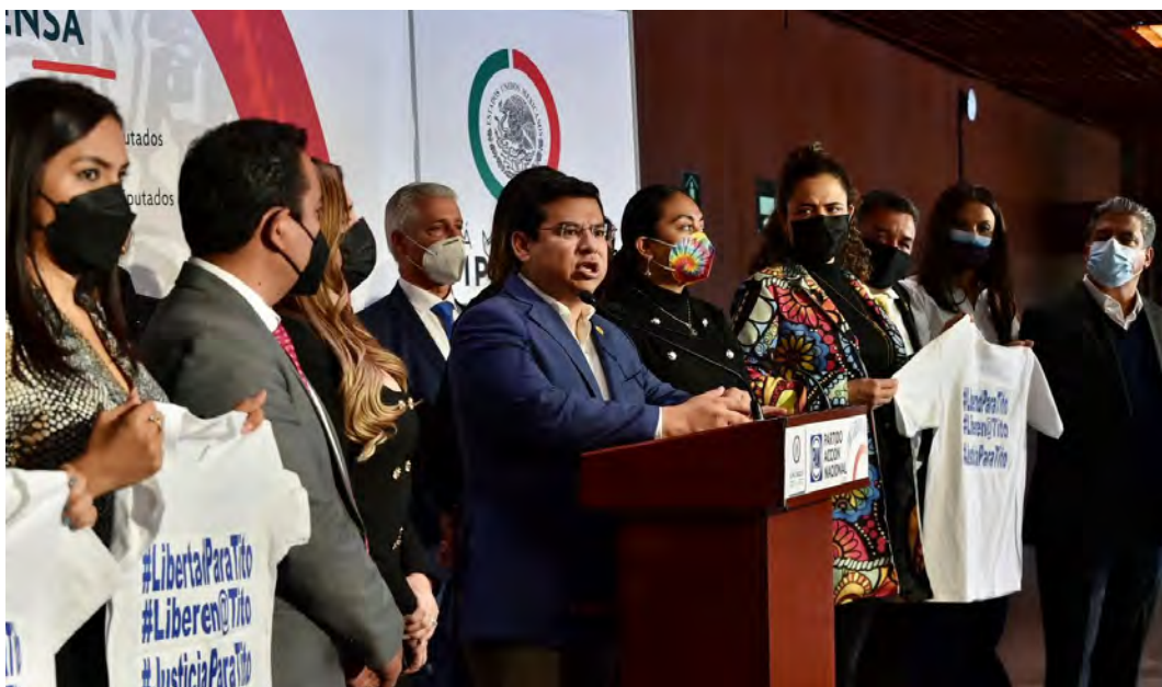
CONFERENCIA DE PRENSA POR LA LIBERTAD DE PRESOS POLÍTICOS EN VERACRUZ

Hablamos en favor de los pueblos originarios del sur del país frente a las atrocidades del gobierno en contra del medio ambiente y las comunidades por las que se construye el Tren Maya así como en apoyo a los periodistas y libertad a presos políticos; que no vamos a permitir que un gobierno intolerante y autoritario pase por encima de la sociedad.