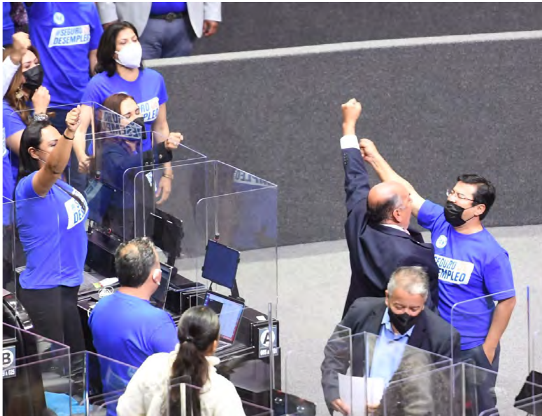
DEFENSA DE LA ECONOMÍA FAMILIAR MEDIANTE EL IMPULSO DEL SEGURO DE DESEMPLEO

Así también, se impulsan acciones legislativas para incentivar medidas que le permitan a las familias mexicanas superar los embates de la crisis provocada por la pandemia de COVID-19 y de las afectaciones económicas provocadas por la mala conducción económica y despilfarro del erario público; causantes de una alta inflación y pérdida de valor adquisitivo en las familias mexicanas.