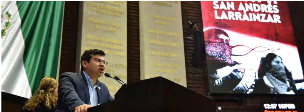
POSICIONAMIENTO SOBRE LOS ACUERDOS DE SAN ANDRÉS LARRÁINZAR