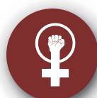
Derechos de las mujeres