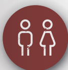
Paridad de Género