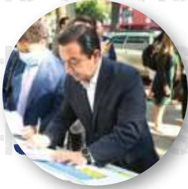
REVOCACION DE MANDATO.

En albazo, Morena aprobó la promoción de revocación de mandato pese a ser contrario a la ley. En el PAN votamos en contra el albazo legislativo de Morena y sus aliados, por considerar que esta Ley solo tenía efectos propagandísticos del gobierno y del presidente.