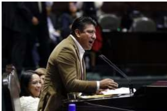
Mtro. Azael Santiago Chepi DIPUTADO FEDERAL

Por ello, a través de este primer informe de actividades rindo cuentas de los logros alcanzados junto con mis compañeros legisladores de MORENA.