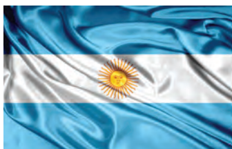
Grupo de Amistad con Argentina