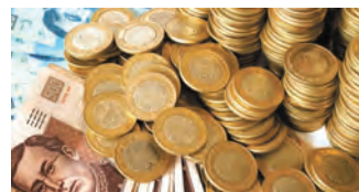
Comisión de Presupuesto y Cuenta Pública (Integrante)