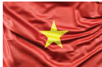
Grupo de Amistad con Vietnam