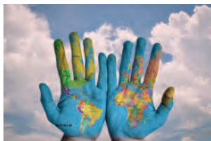
Comisión Asuntos Frontera Sur (Secretario)