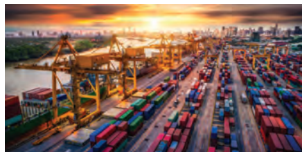
Comisión de Economía, Comercio y Competitividad (Integrante)