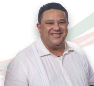
Dip. Eulalio Ríos Fararoni

Desde el primer día de su gestión legislativa en la Cámara de Diputados, el veracruzano, ha trabajado arduamente con su Grupo Parlamentario de Morena para combatir la injusticia, la violencia, la desigualdad social y económica. Pero sobre todo, ha orientado su máximo esfuerzo en la lucha contra la corrupción y la impunidad que durante muchos años ha venido lastimando al pueblo mexicano.