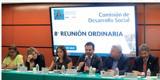
Octava Reunión Ordinaria, 27 de junio de 2019