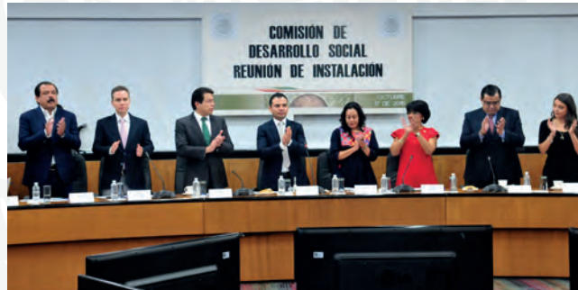
Instalación de la Comisión de Desarrollo Social. 17 de octubre de 2018

Dentro de la Comisión de Desarrollo Social integrada por 32 Diputadas y Diputados de las diferentes fracciones parlamentarias y bajo atribuciones constitucionales de esta, se dio cumplimiento al trabajo legislativo en materia de nuestra competencia. Se elaboraron diversos dictámenes, opiniones, informes, actas, resoluciones y reuniones. Durante este primer año legislativo y con fundamento en los artículos 157, 158, 167, 168, 169, del Reglamento de la Cámara de Diputados, se realizaron ocho Reuniones Ordinarias: