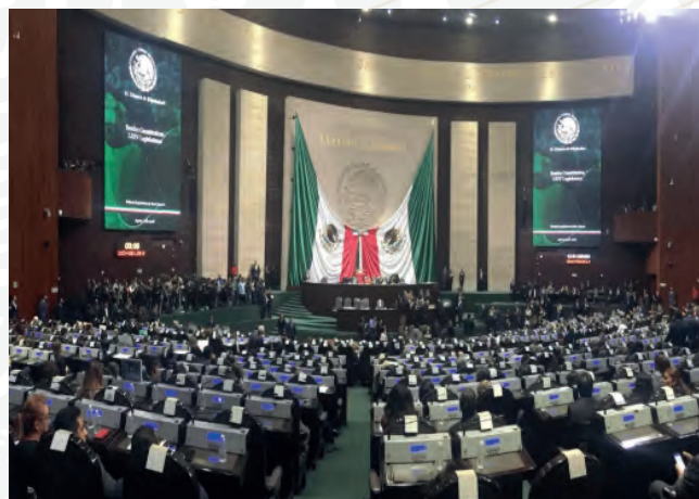
Inicio del Primer Período Ordinario de Sesiones del Primer año de Ejercicio de la LXIV Legislatura. 1/09/2018

El 1 de septiembre de 2018 iniciamos el Primer Período Ordinario de sesiones del Primer Año de Ejercicio de la LXIV Legislatura.