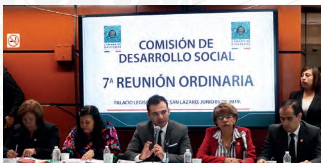
Séptima Reunión Ordinaria, 5 de junio de 2019