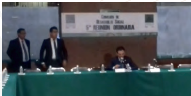
Quinta Reunión Ordinaria, 30 de abril de 2019