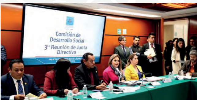
Tercera Reunión Ordinaria, 16 de enero de 2019