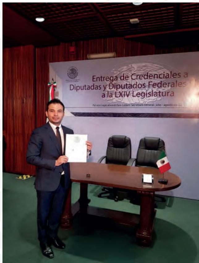
Toma de protesta en la H. Cámara de Diputados, como Diputado Federal. 1/09/2018

Como parte de los que integramos este Poder Legislativo, así como un impulsador del Proyecto de Nación hacia la construcción de un México próspero, incluyente, participativo y con una actuación global responsable, presento a usted el Primer Informe Anual sobre el desempeño de mis labores como Diputado Federal de esta LXIV Legislatura, el cual está fundamentado en el artículo 8, numeral 1, fracción XVI del Reglamento de la H. Cámara de Diputados.