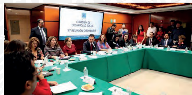
Cuarta Reunión Ordinaria, 28 de febrero de 2019