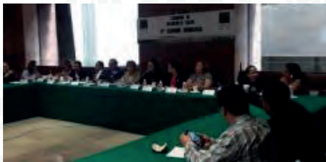
Sexta Reunión Ordinaria, 22 de mayo de 2019