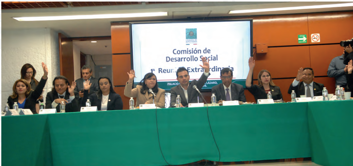
Primera Reunión Extraordinaria, 6 de diciembre de 2018

Con fundamento en el Artículo 168 numeral 1 y 170 numeral 1, del Reglamento de la Cámara de Diputados y con el fin de abordar los temas de urgencia resolución, esta Comisión efectuó tres Reuniones de índole Extraordinario: