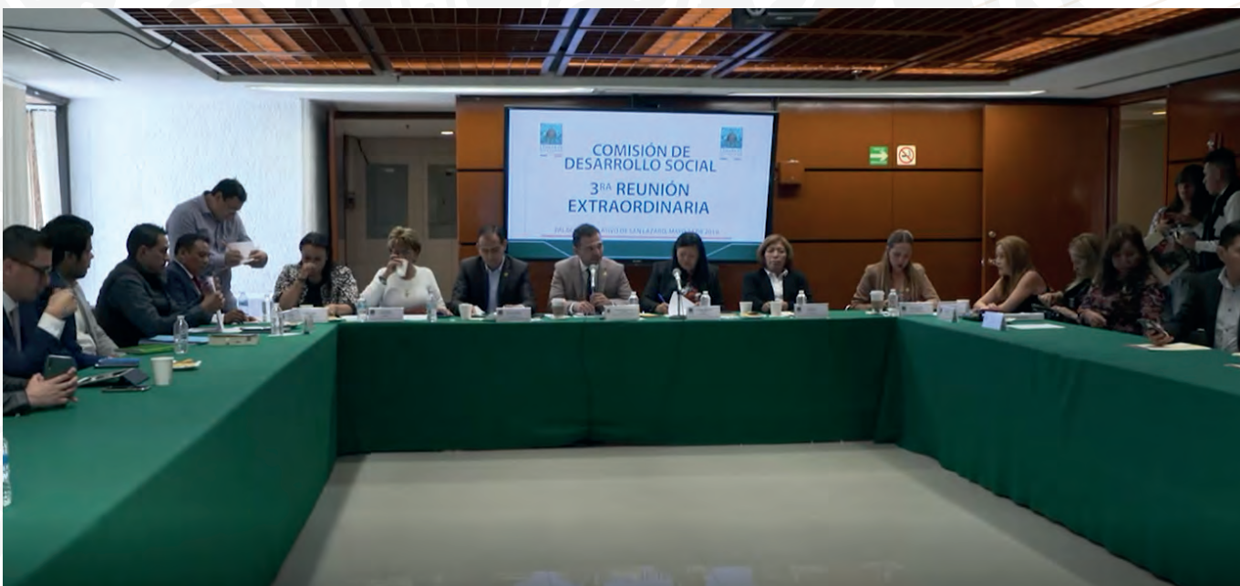
Tercera Reunión Extraordinaria, 24 de mayo de 2019