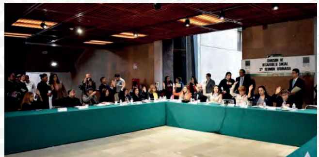
Segunda Reunión Ordinaria, 20 de diciembre de 2018