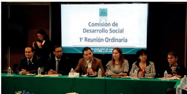
Primera Reunión Ordinaria, 31 de octubre de 2018