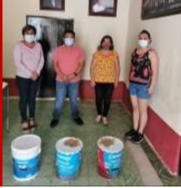
Botes de pintura e impermeabilizante Escuela primaria "20 de noviembre", Cuicatlán