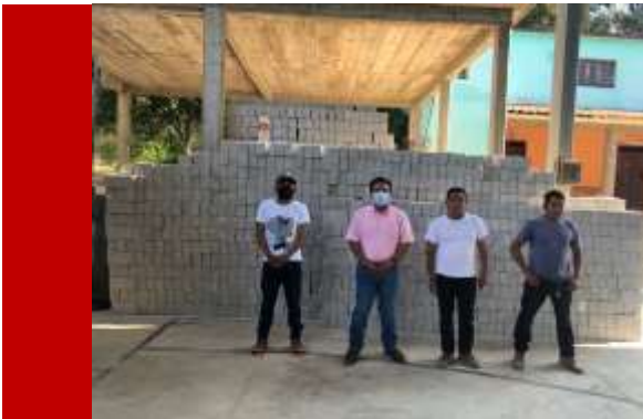
Material de Construcción Agencia de San Francisco Tutepetongo, Cuicatlán.