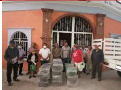
Sillas plegables Comisariado ejidal de San Pedro Chicozapotes