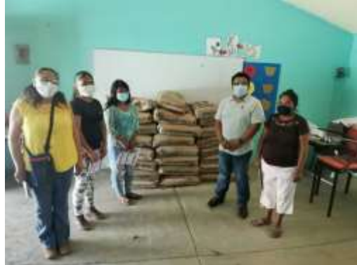
Material de Construcción Escuela Primaria "21 de Marzo de 1806", Quitepec