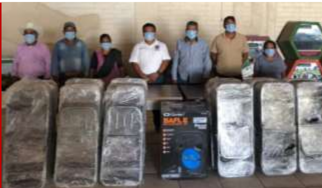
Sillas plegables y equipo de sonido Bienes Comunales de San Pedro Jocotipac