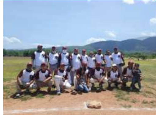
Uniforme de equipo de Béisbol, Deportivo Cuicatlán