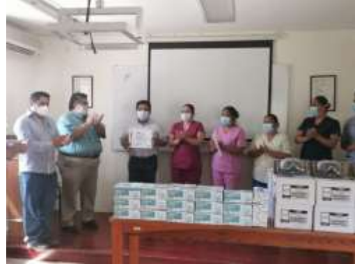
Cubre bocas tricapa termo sellado Hospital General "Dr. Alberto Vargas Merino ", Cuicatlán