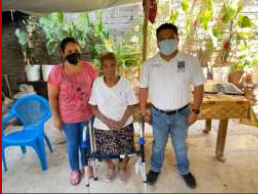
Andadera Casa de Salud, San Pedro Chicozapotes