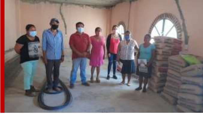
Material de construcción Telesecundaria de Santiago Quiotepec