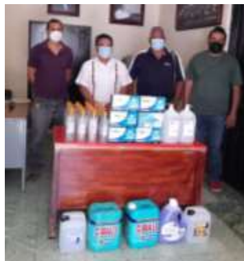
Material para contingencia (cubrebocas, gel antibacterial, cloro, jabon liquido, zanitizante) Sitio de Taxis, San Juan Cuicatlán