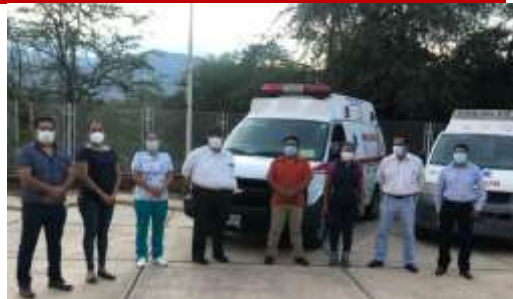
Apoyo económico para reparación de Ambulancia Hospital General "Dr. Alberto Vargas Merino", Cuicatlán