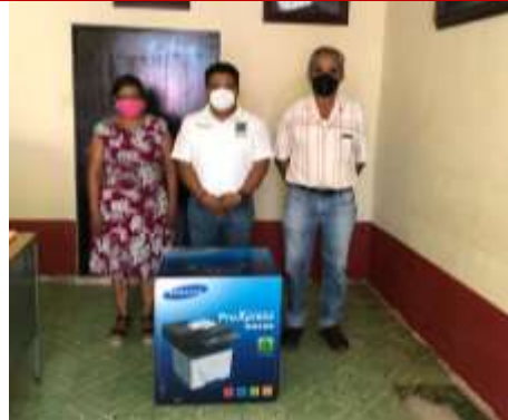
Fotocopiadora Secundaria Tecnica N°83 Santa María, Tecomavaca