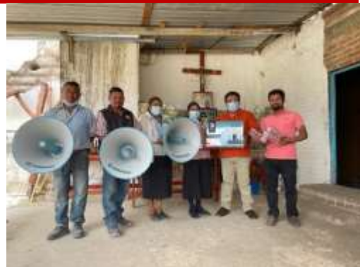
Equipo de Sonido Agencia de San Miguel Chicagua. Nochixtlan