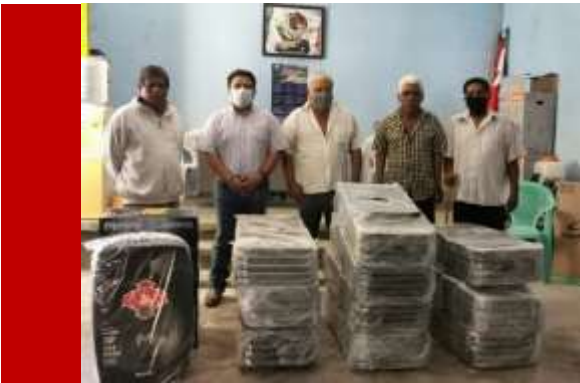
Sillas plegables y equipo de sonido Comisariado ejidal de Valerio Trujano