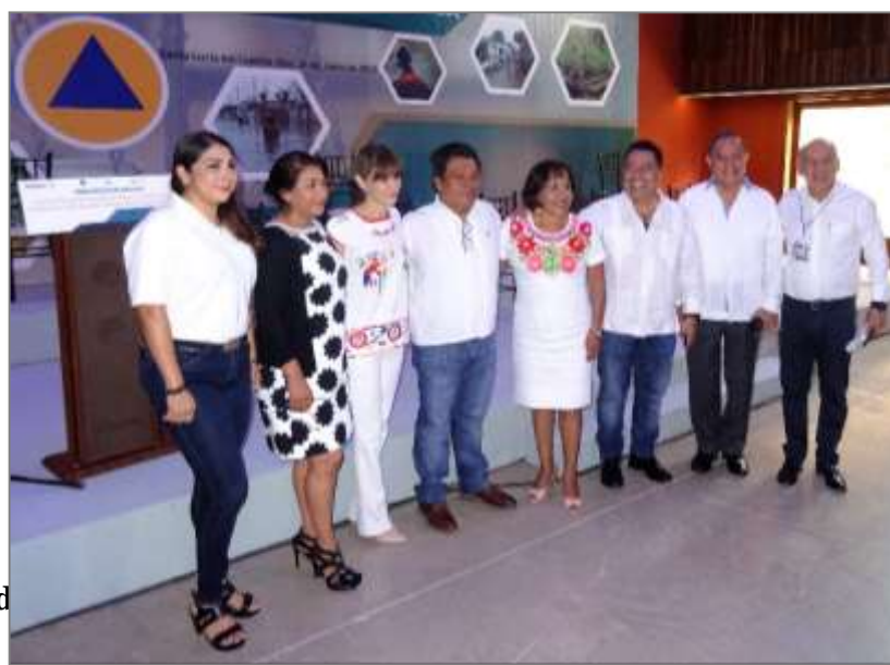
Foro Regional d