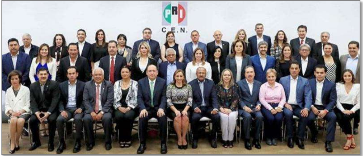
Comité Ejecutivo Nacional del PRI

compromiso con México, demostrando con orgullo, carácter y categoría, el desempeñarse como un Almirante Diputado, en esta LXIV Legislatura.