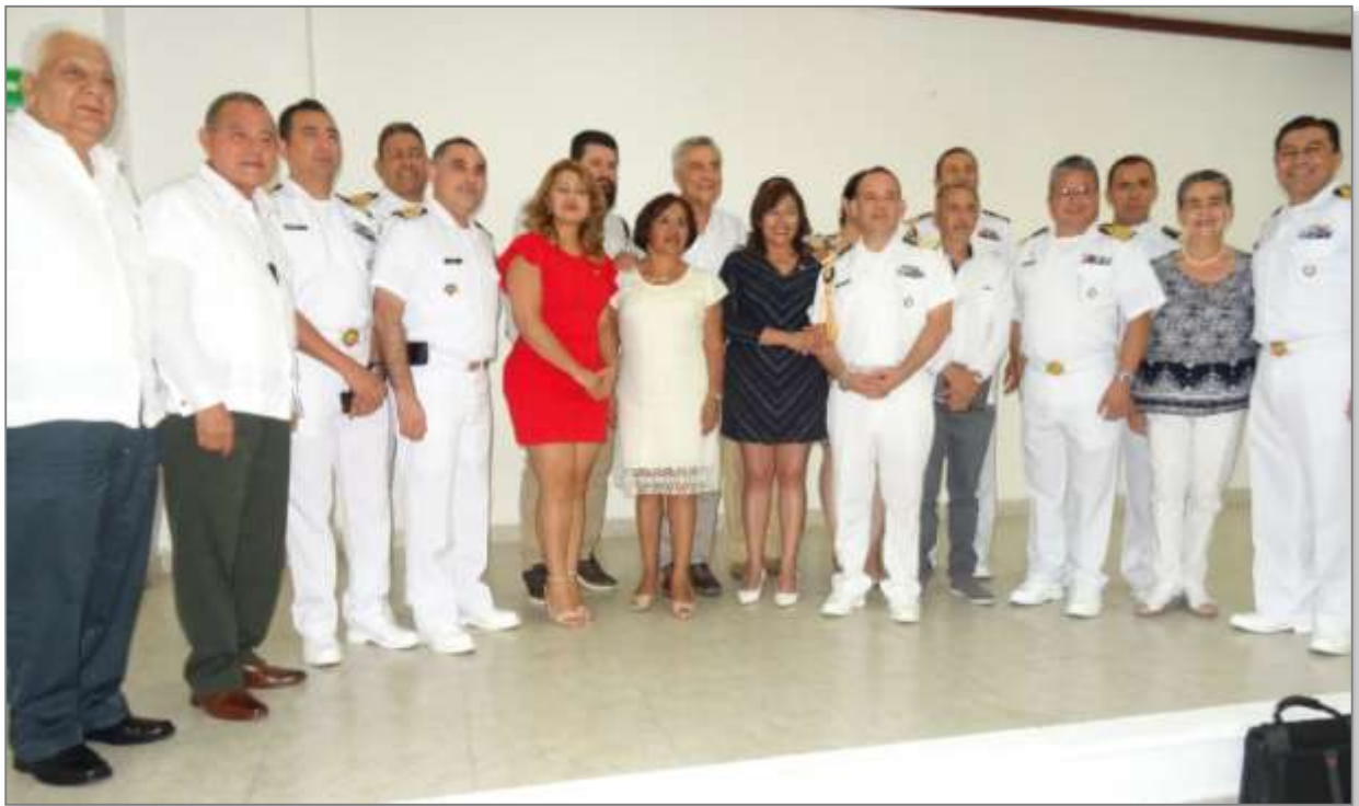
Foro Regional del Estado de Oaxaca