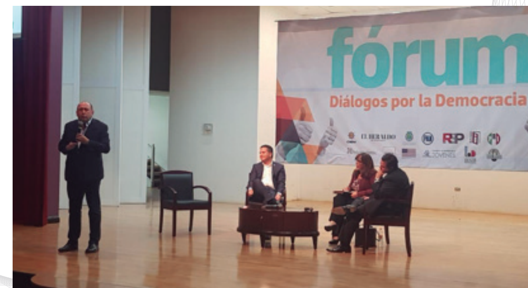
27 de septiembre de 2019. Diálogos por la Democracia. Chihuahua, Chih.

Como diputado federal he tenido la oportunidad de participar en foros académicos y de comunicación con diversos sectores sociales.