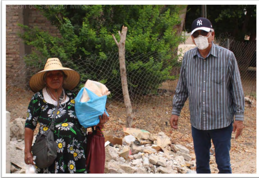
Entrega de apoyos alimenticios a personas en situación vulnerable de las localidades de CD. Morelos y Los Algodones. Se espera que estos apoyos se puedan seguir realizando durante la contingencia sanitaria. 11 julio 2020.