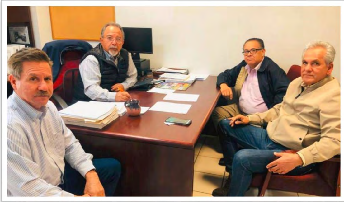
Reunión de trabajo con funcionarios de la Dirección de Recursos Hidráulicos de la Secretaría del Campo y Seguridad Alimentaria del Gobierno del Estado de Baja California, para tratar asuntos relacionados con pozos particulares y análisis de reglas de operación para el ejercicio fiscal 2020. 10 enero 2020.