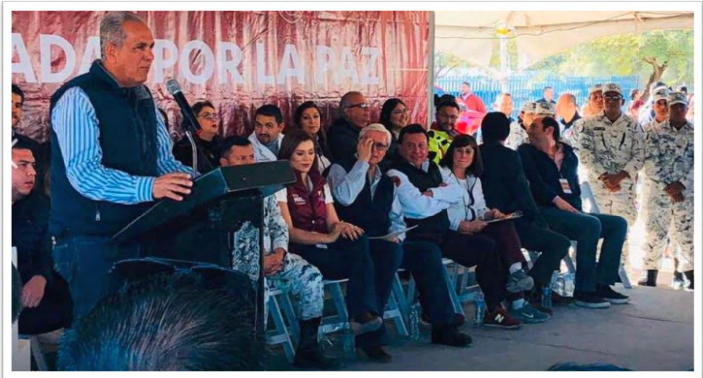
Presentes en el evento “Jornada por La Paz” en el Ejido Puebla, en compañía del gobernador de nuestro Estado, Jaime Bonilla Valdez, y la alcaldesa de Mexicali, Marina del Pilar Ávila Olmeda. 11 enero 2020.