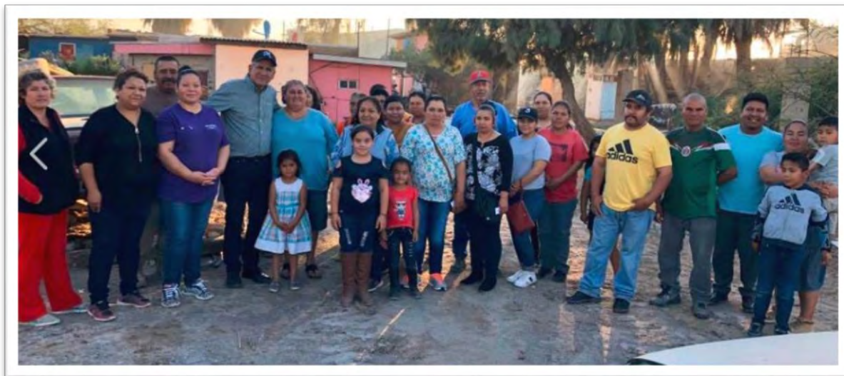
Reunión con residentes de la zona del ferrocarril, en Ciudad Guadalupe Victoria, para dar seguimiento a obras de revestimiento de su calle principal, y para dar atención a problemáticas de recolección de basura. 8 marzo 2020.