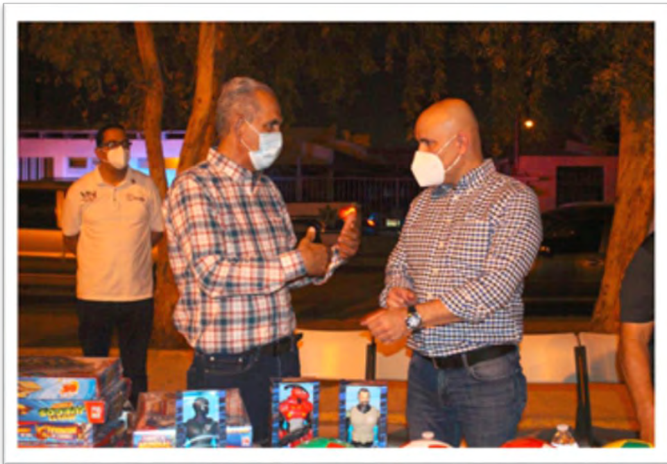
Participando y apoyando a residentes del Fraccionamiento Paseos del Sol, en evento de recaudación de fondos para mantenimiento y conservación de parque comunitario, en conjunto con Víctor Hugo Navarro Gutiérrez, diputado local del distrito II de Baja California. 15 septiembre 2020.