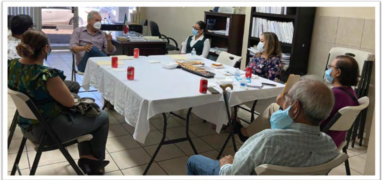
Reunión de trabajo con promotores de mejoras y pro-donativos de hospitales del Instituto de Seguridad y Servicios Sociales de los Trabajadores del Estado (ISSSTE), del Instituto Mexicano del Seguro Social (IMSS), y del Hospital General de Mexicali (HGM). 12 agosto 2020.