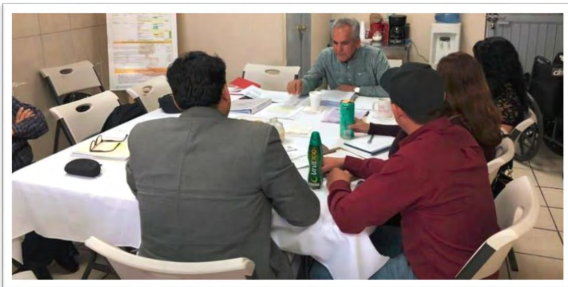
Reunión de trabajo con representantes de la comunidad de Zona Dorada, para tratar la problemática del Dren Mexicali. 21 febrero 2020