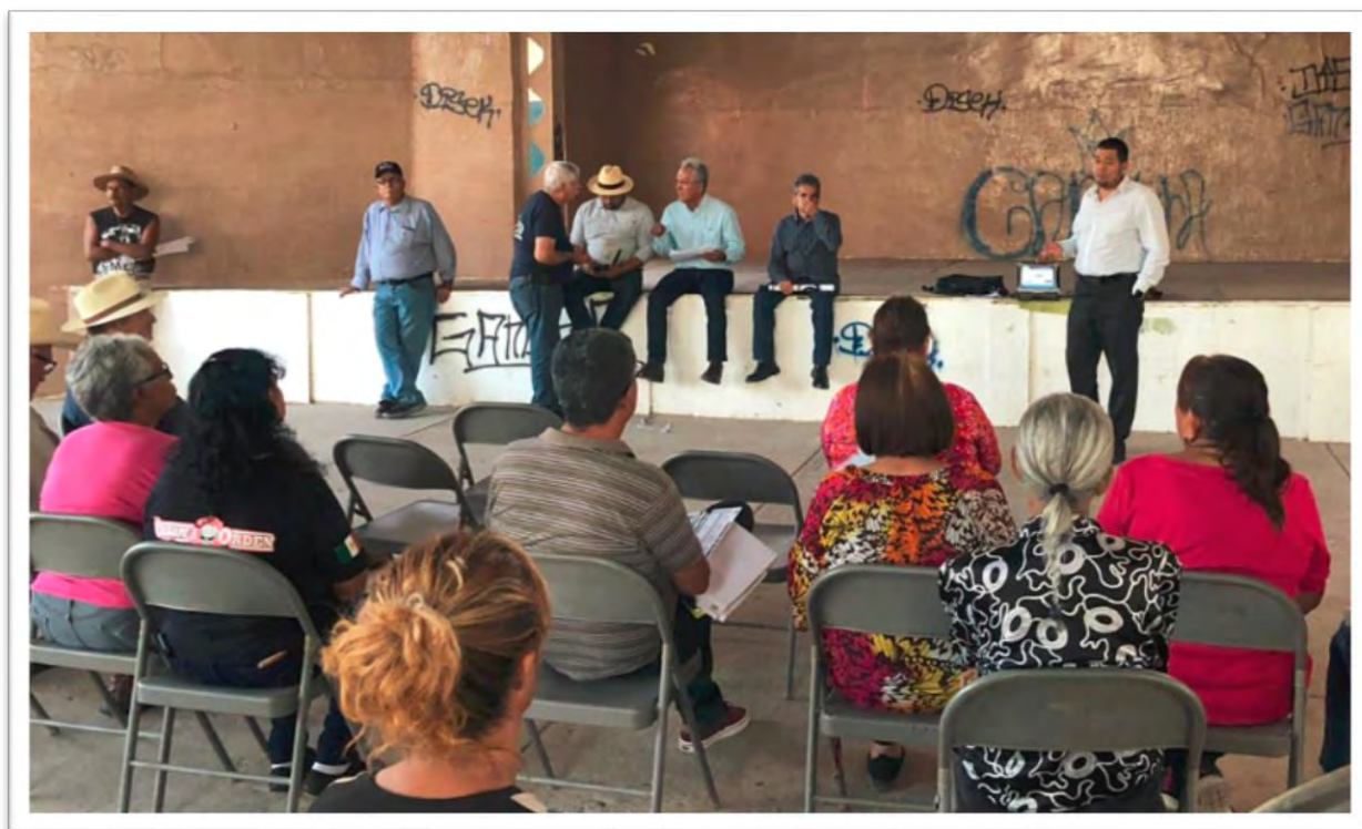
Reunión de trabajo donde se trataron asuntos de seguridad ciudadana con los vecinos del Ejido Sinaloa. 4 octubre 2019.