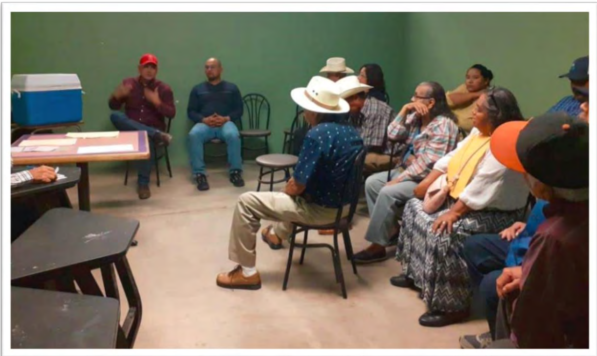
Reunión con nuestros amigos del ejido Sinaloa, escuchando peticiones y buscando soluciones a diferentes planteamientos de la población. 27 octubre 2019.