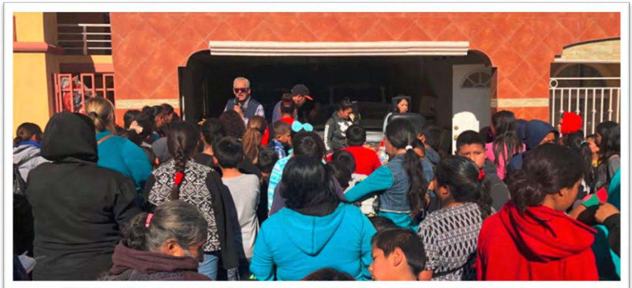
Gira de trabajo por el Valle de Mexicali. Visita a nuestros amigos de Los Algodones, del Ejido Lázaro Cárdenas, donde escuchamos problemas y necesidades de los pobladores para encontrar respuestas y soluciones favorables. 4 enero 2020.