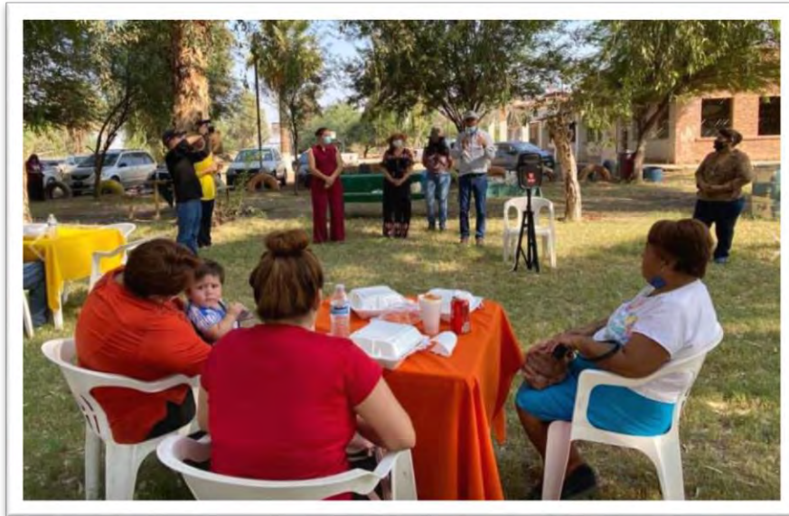
Reunión de trabajo y desayuno en la Colonia Chapultepec con representantes de distintas comunidades de los Ejidos Nuevo León, Veracruz Marítimo, Cd. Guadalupe Victoria, entre otras, donde se plantearon problemáticas de la zona, y estrategias solidarias de solución. 18 septiembre 2020.