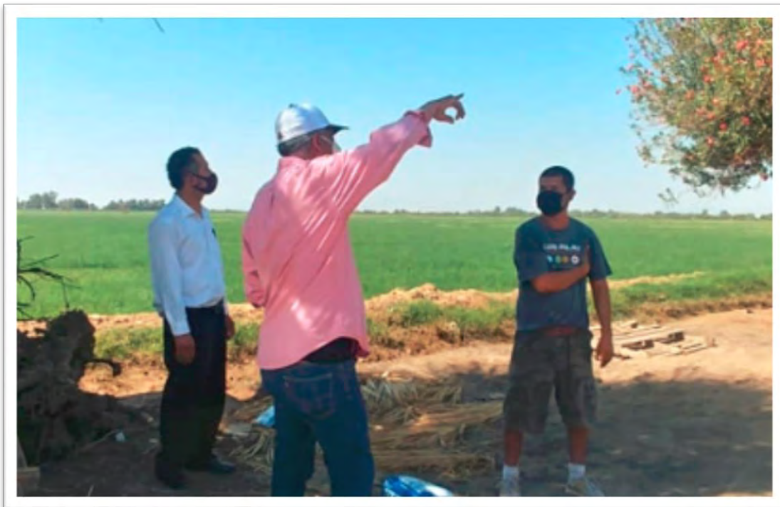
Atención de diversos asuntos y apoyo con alimentos a grupos vulnerables de colonias de CD. Guadalupe Victoria y Veracruz Marítimo 3. 14 agosto 2020.