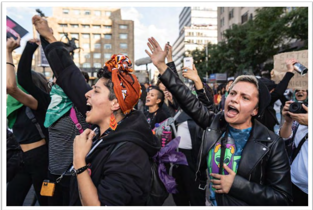
Mujeres durante una marcha feminista en enero de 2020 en la Ciudad de México

Además, se busca erradicar la violencia, al no permitir que se anule, limite u obstaculice la participación de las mujeres en la toma de decisiones, por lo que se incrementaron las sanciones por violencia política y electoral en contra de ellas, con años de prisión, hasta 300 días de trabajo comunitario y 200 días de multa a quienes nieguen o restrinjan a una mujer para postularse y competir por un cargo de elección popular, para ejercer sus derechos de militancia en los partidos políticos, y para participar en los procesos internos de su partido.