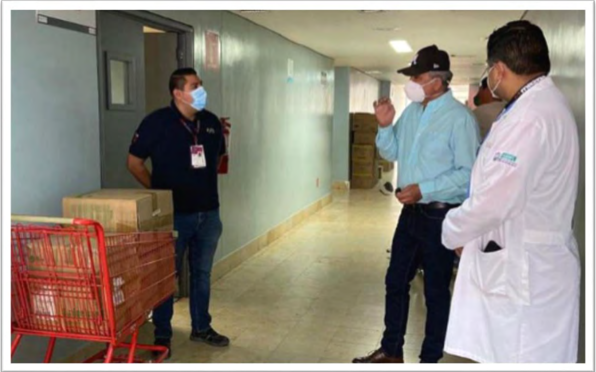
Donativo de Overoles para el personal médico del hospital ISSSTE en Mexicali. 4 junio 2020.