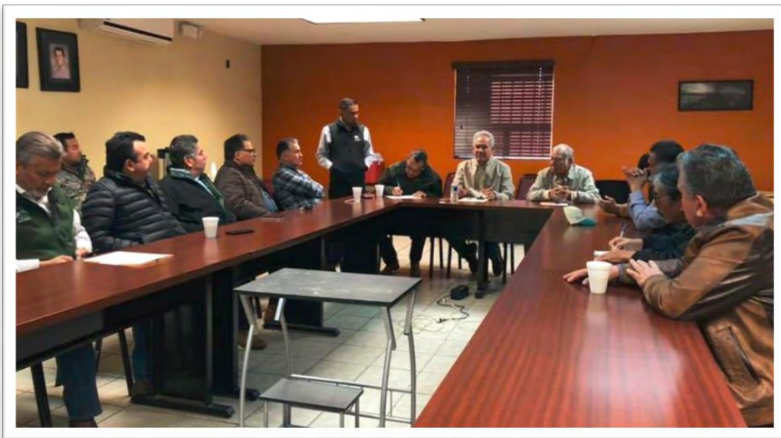
Reunión de trabajo con productores agrícolas del Valle de San Luis Río Colorado, Sonora, donde se informó de un proyecto alternativo de cultivos que oferta una empresa inversionista de Texas, Estados Unidos. 10 enero 2020.