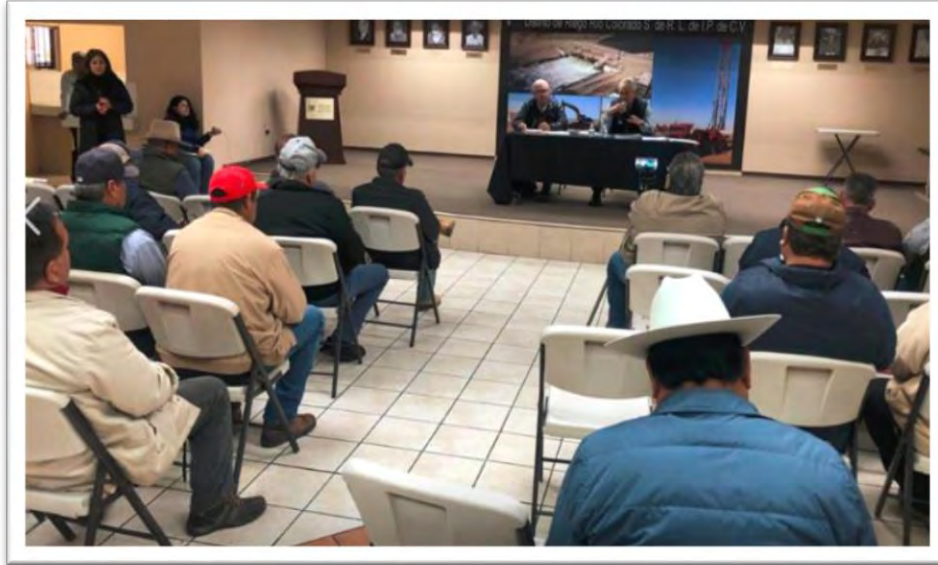
Reunión en el Distrito de Riego Río Colorado, con agricultores del Valle de Mexicali, para organizar y planear el proyecto de producción agrícola denominado “La Catrina”. 10 febrero 2020.