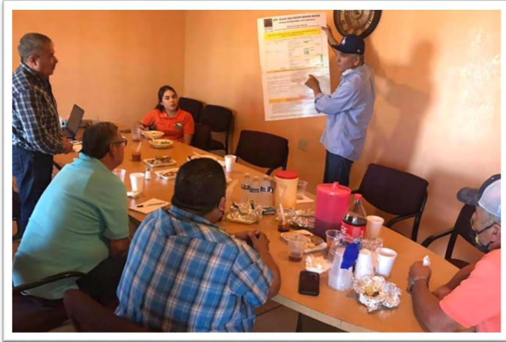
Reunión con directivos del Módulo de Riego 8, y con empresarios de Ciudad Guadalupe Victoria, para tratar diferentes problemáticas y buscar soluciones en los tres niveles de gobierno. Colonia Juárez, Valle de Mexicali. 30 agosto 2020