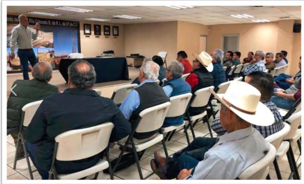
Reunión de trabajo en Distrito de Riego de Río Colorado, con usuarios de pozos particulares, para apoyar con gestiones y trámites en la Ciudad de México. 1 de marzo 2020.