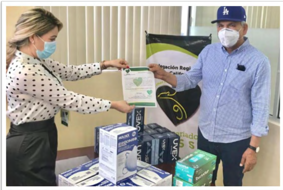
Entrega de donativos de aditamentos médicos a representantes de las clínicas 30 y 31 de la Ciudad de Mexicali, como apoyo durante el combate al Covid-19. 5 junio 2020.