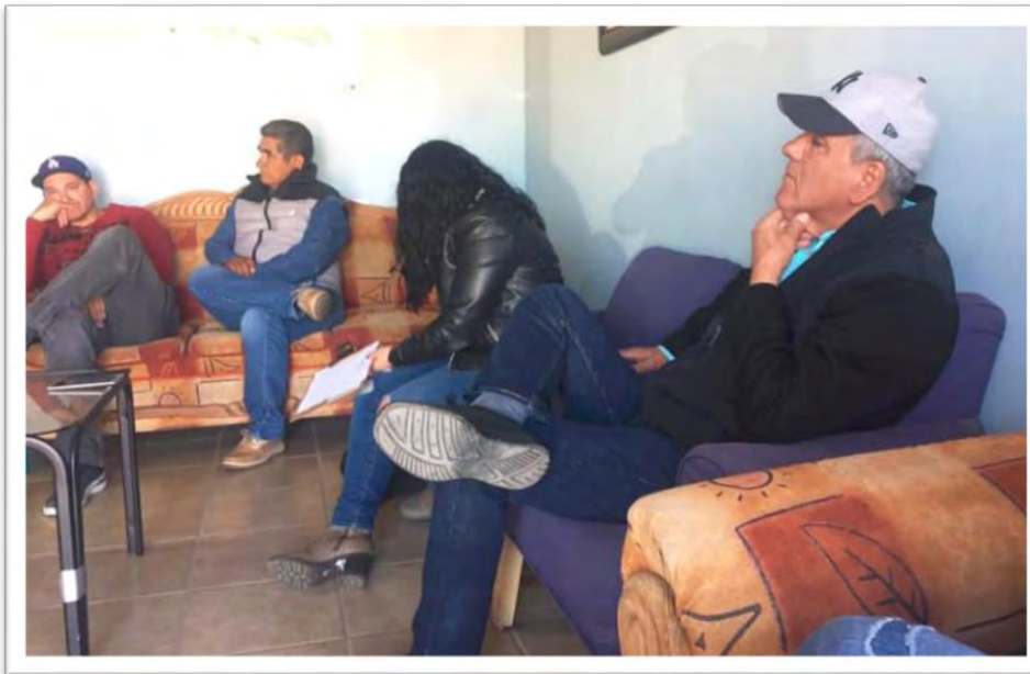
Reunión de trabajo con pescadores ribereños en el Puerto de San Felipe, Baja California, donde se trataron diversos asuntos y problemáticas que se tomaron en cuenta para la redacción y presentación de diversas proposiciones con punto de acuerdo ante la Cámara de Diputados para la defensa y el impulso de la actividad pesquera de la región, en favor de los pescadores rivereños de Mexicali, Sonora y Sinaloa. 8 febrero 2020.