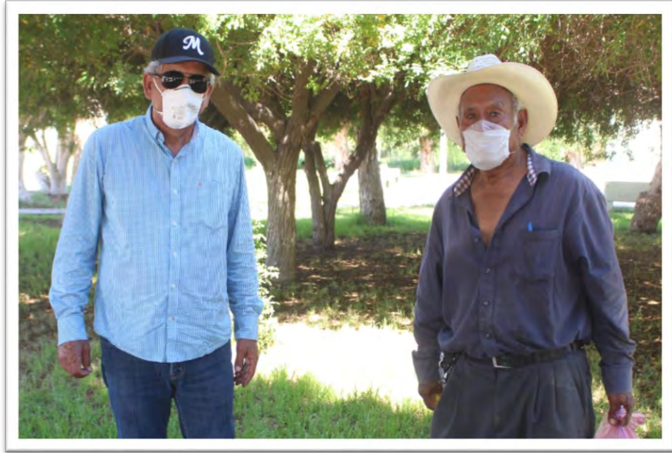
Como parte de mis compromisos entregué apoyos alimentarios a pobladores de las comunidades del Ejido Tlaxcala, Ejido Guerrero y Ejido Veracruz 2. Además de 100 apoyos adicionales en Cd. Guadalupe Victoria y alrededores. 4 julio 2020.