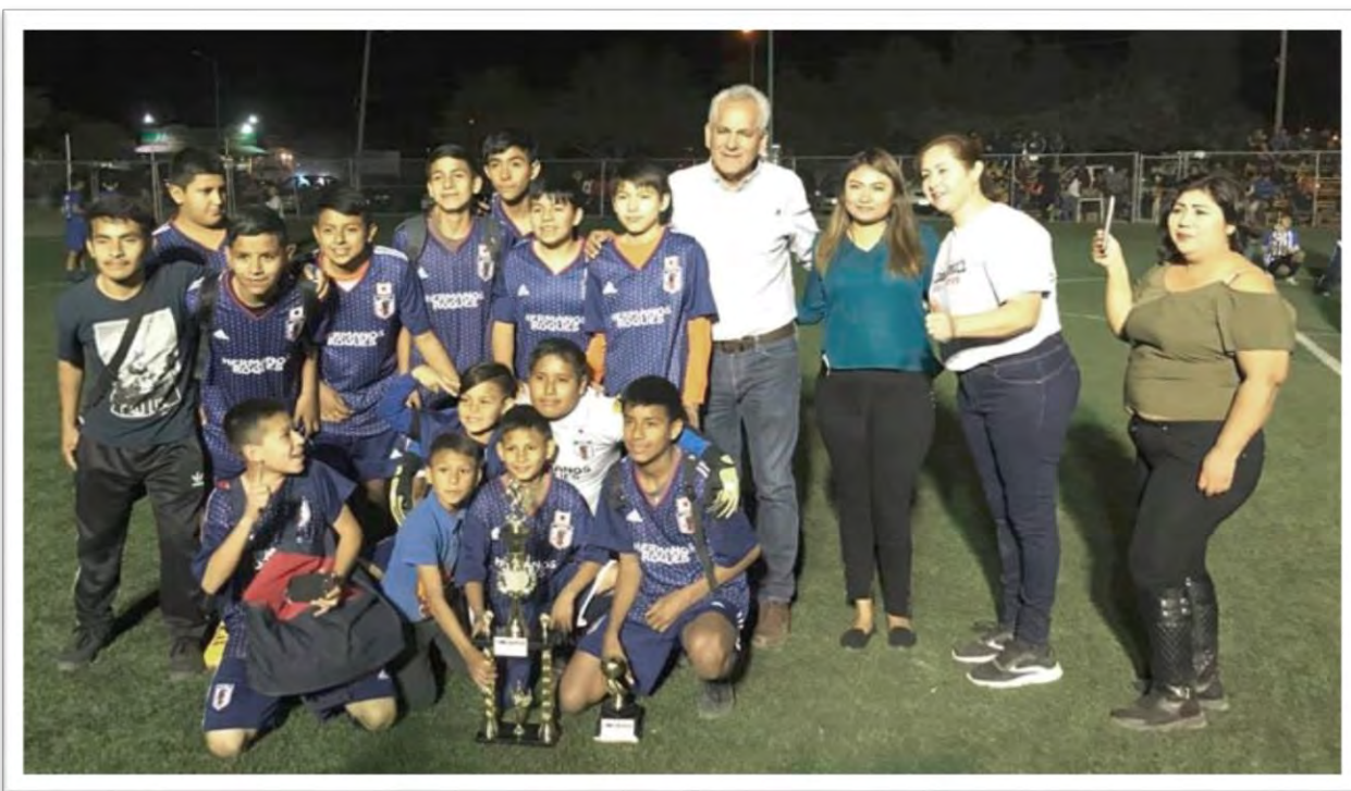
Donación de material deportivo, apoyando el deporte, evento en Ciudad Guadalupe Victoria. Una de las tantas medidas que debemos tomar como sociedad y gobierno para evitar que los niños y jóvenes se vayan por una ruta equivocada. 2 marzo 2020.