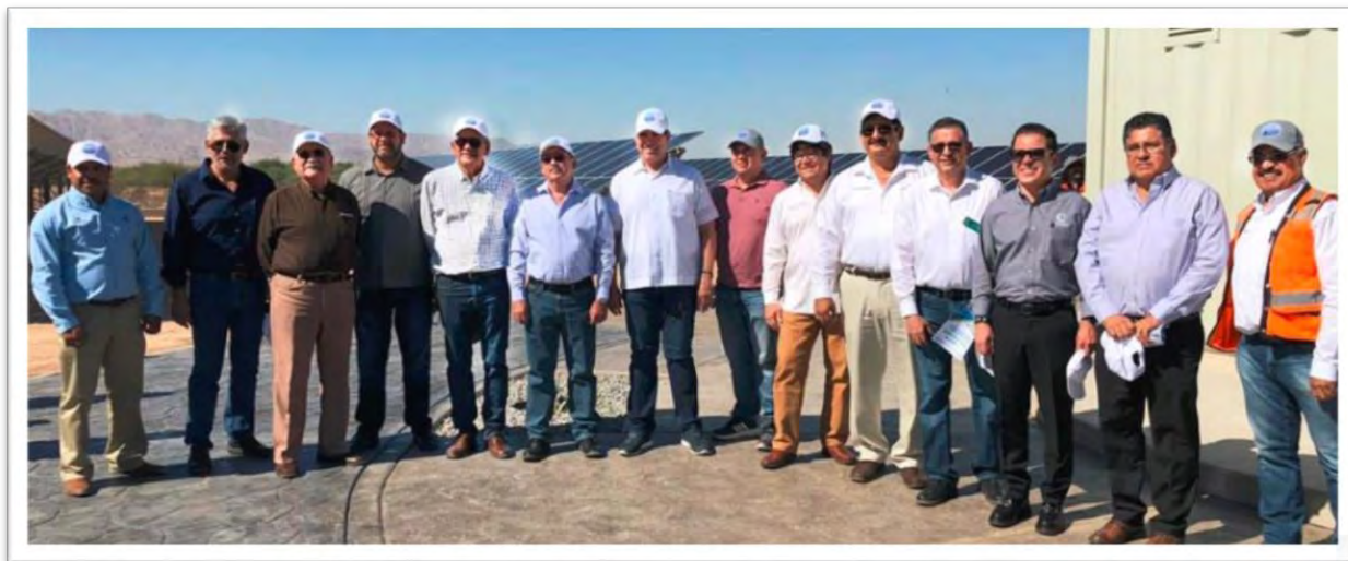
Visita a planta fotovoltaica generadora de energía eléctrica que se construye en el Municipio de Mexicali, y que beneficiará a la región del Valle de Mexicali y su entorno. 26 octubre 2019.