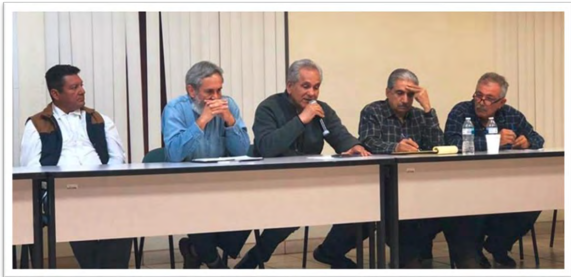
Reunión de trabajo con productores del Valle de Mexicali, el representante de la Comercializadora La Catrina, y con autoridades Estatales y Federales, donde se presentó propuesta para la activación de la economía en el Valle de Mexicali. 16 diciembre 2019.