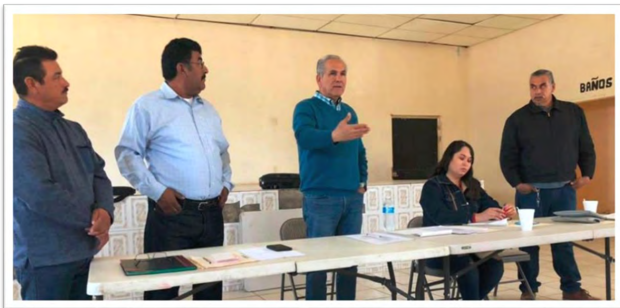
Reunión del Comisariado Ejidal en el Ejido Guerrero, donde se presentó un proyecto de reactivación para el campo y los cultivos. 26 enero 2020.