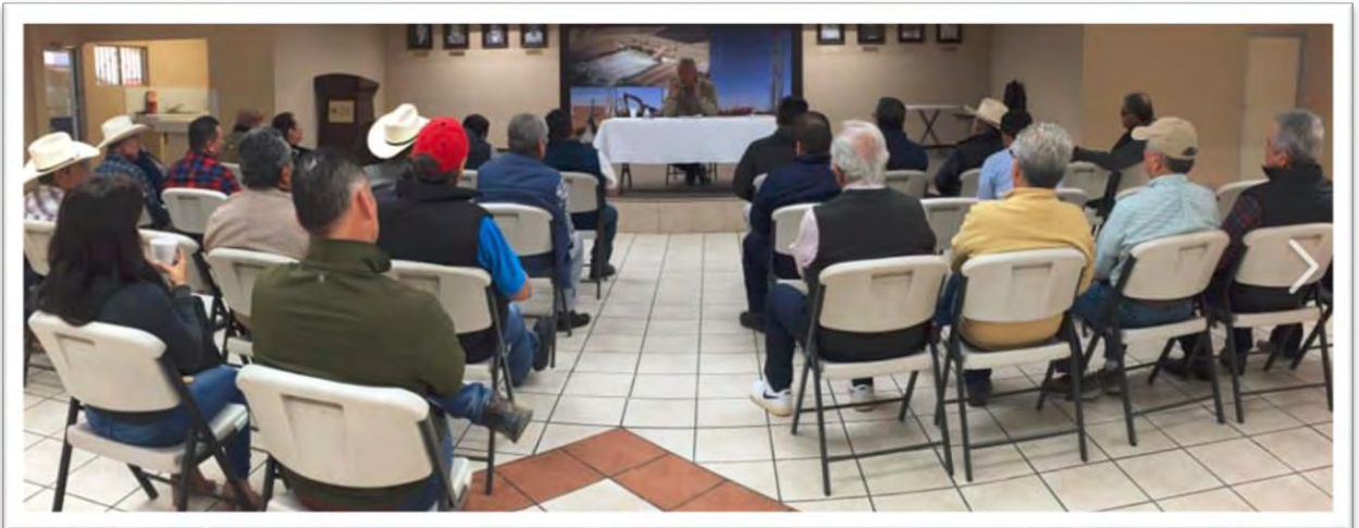
Reunión de trabajo en el Distrito de Riego Río Colorado, con usuarios de pozos particulares del Valle de Mexicali y del Valle de San Luis Río Colorado, Sonora, para tratar temas pendientes de gestión y tramitología del sector hídrico, y reglas de operación 2020. 14 marzo 2020.