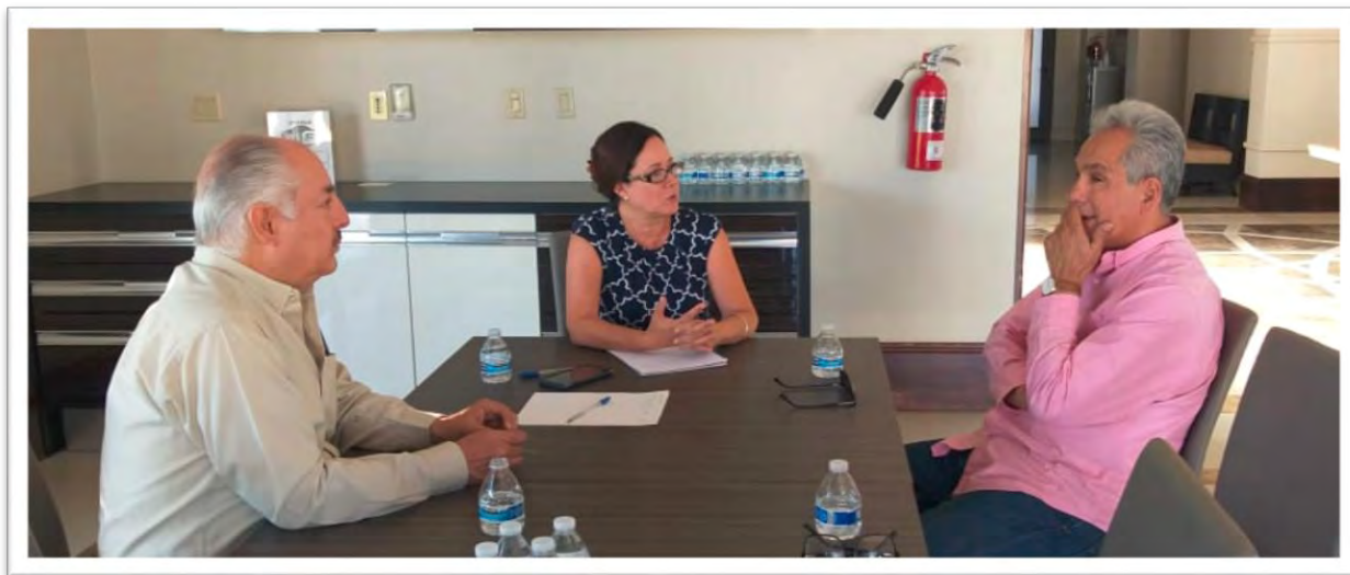
Reunión de trabajo con representantes de fraccionamientos del noreste de la Ciudad de Mexicali, donde se abordaron asuntos de infraestructura hidráulica pluvial de la zona. 2 octubre 2019.