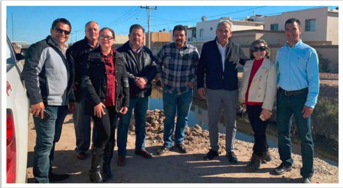
Recorrido del Dren Mexicali en la Zona Dorada, del norte de la Ciudad de Mexicali, en compañía de funcionarios de la Comisión Nacional del Agua, de la Comisión Estatal de Servicio Público de Mexicali, y de representantes de 23 fraccionamientos de la región. 20 diciembre 2019.