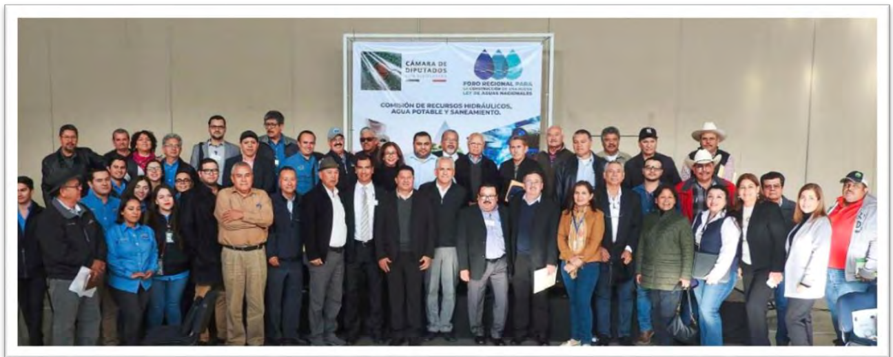
Foro Regional para la Construcción de una nueva Ley de Aguas Nacionales, realizado en Mexicali, Baja California, donde se tomó en cuenta la opinión de los ciudadanos. 29 noviembre 2019.