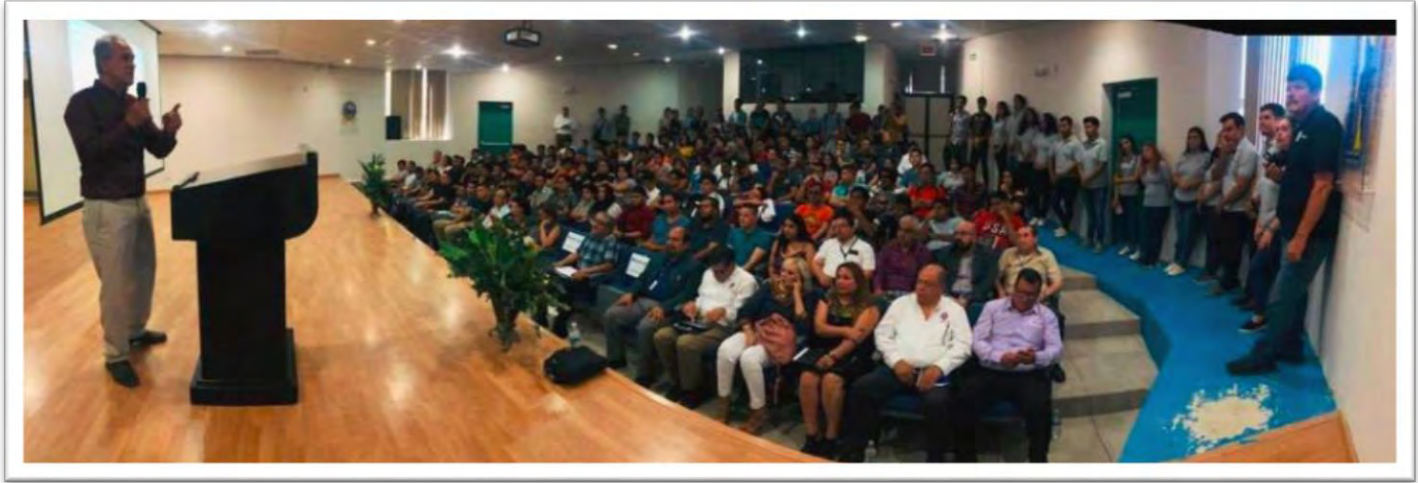
Conferencia sobre el cuidado del agua, impartida a estudiantes en el TEC de Mexicali. 13 septiembre 2019.