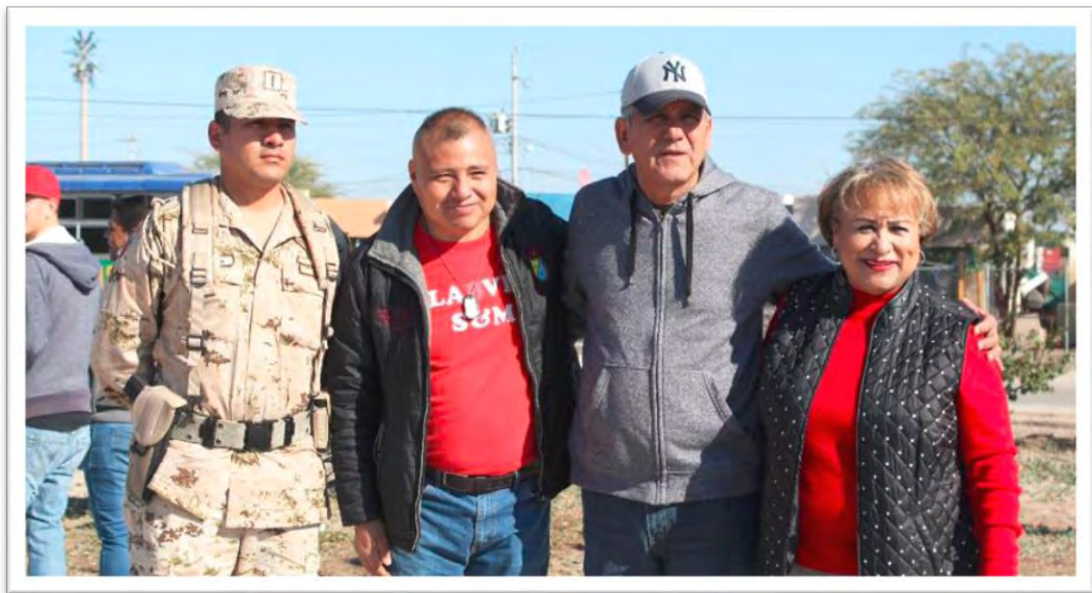
Realizando actividades de apoyo en labores de limpieza comunitaria en conjunto con los pobladores de la Colonia Ángeles de Puebla. 15 febrero 2020