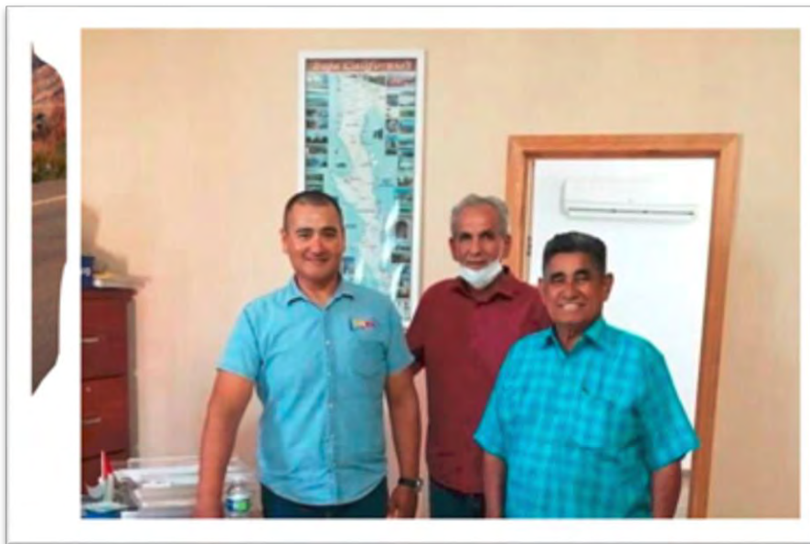
Reunión de trabajo con directivos de organizaciones de pescadores ribereños del Puerto de San Felipe, para tratar temas y problemas de la actividad pesquera que viven productores ribereños del Golfo de California. Después de esta reunión se realizó conferencia de prensa local, para plantear estrategias de solución una vez levantada la veda de pesca de camarón. 17 septiembre 2020.