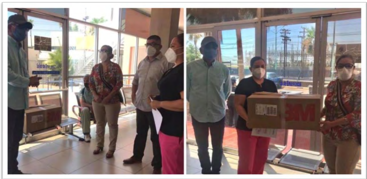
Donación de 400 mascarillas especiales para personal médico y enfermeras del Hospital General de Mexicali. 6 julio 2020.