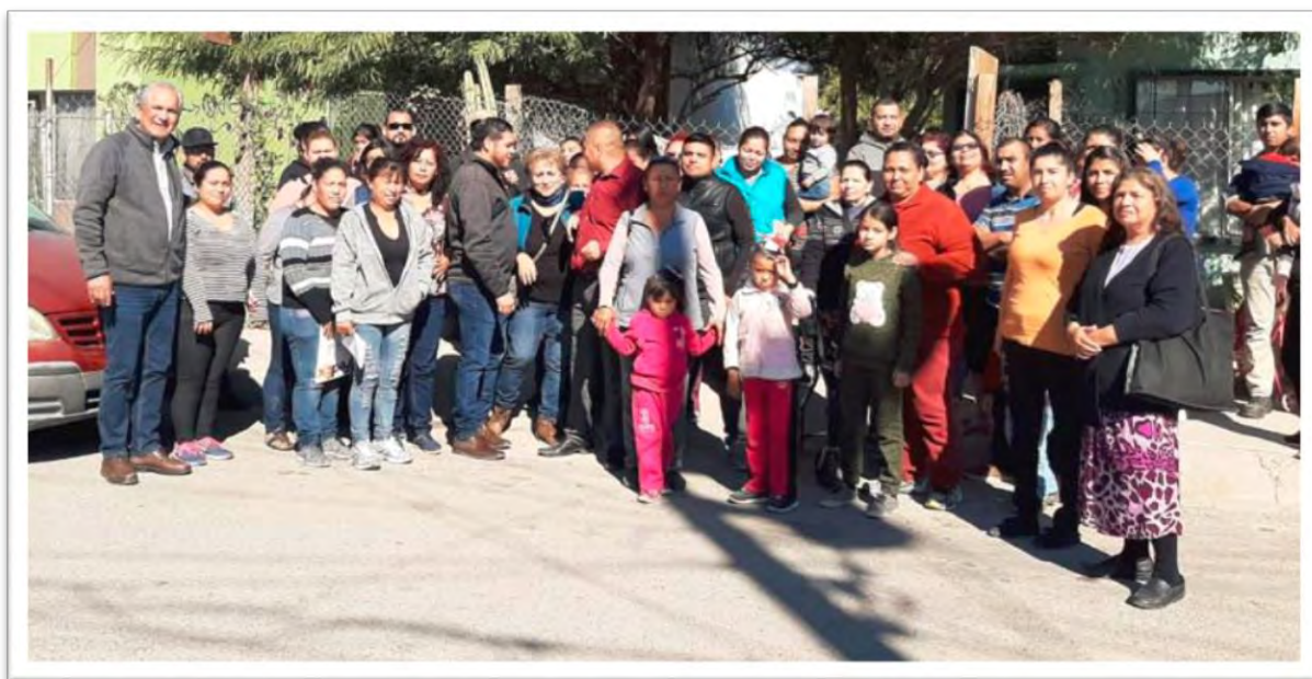
Reunión con residentes del Fraccionamiento Ángeles de Puebla, donde se acordó gestionar la construcción de una escuela secundaria en beneficio de jóvenes estudiantes de la zona. 25 enero 2020.