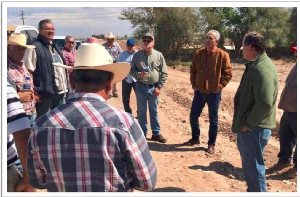
Recorrido por el Canal de Riego Agrícola 27 de enero, para supervisión técnica de compuertas, en compañía de productores de la región, donde se trataron asuntos pendientes, y se acordó buscar atención directa de la Comisión Nacional del Agua. 28 febrero 2020.