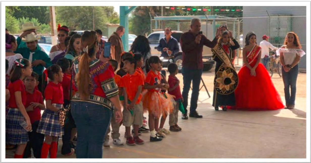
Acudimos muy honrados por invitación de los pobladores a la conmemoración del 81 aniversario del Ejido Mérida. 28 septiembre 2019