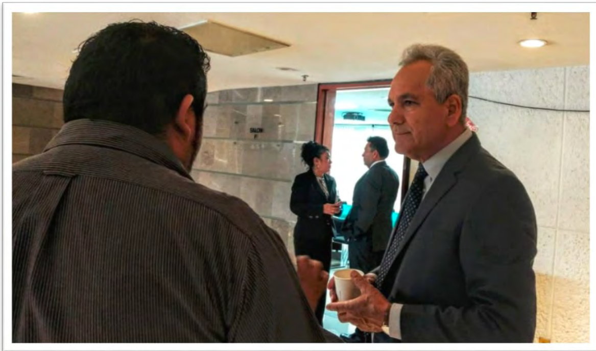
En reunión de trabajo de la Comisión de Recursos Hidráulicos, Agua Potable y Saneamiento en la Cámara de Diputados. 3 septiembre 2019.