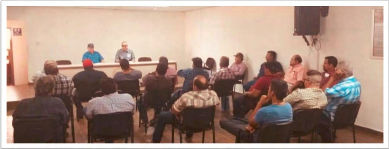
Reunión de trabajo con agricultores en el Ejido Oaxaca, donde se trató el tema de carteras vencidas. 29 septiembre 2019.