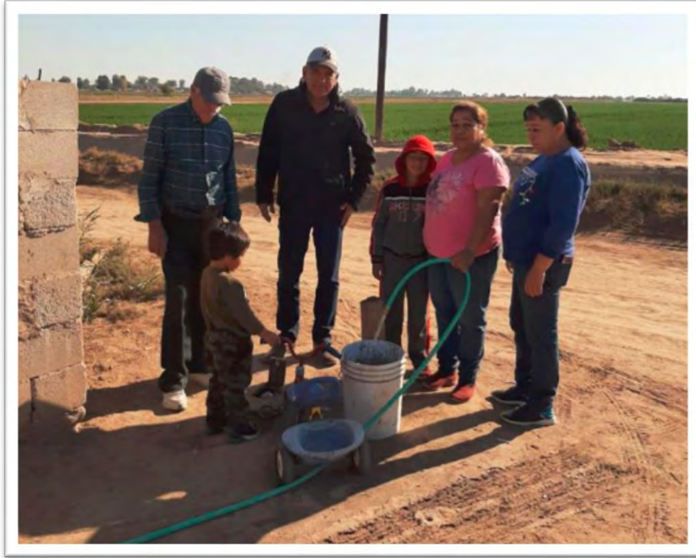
Se muestran resultados favorables de gestión en materia hídrica para obtener agua potable en la compuerta núm. 29 del Ejido Veracruz. 5 enero 2020.