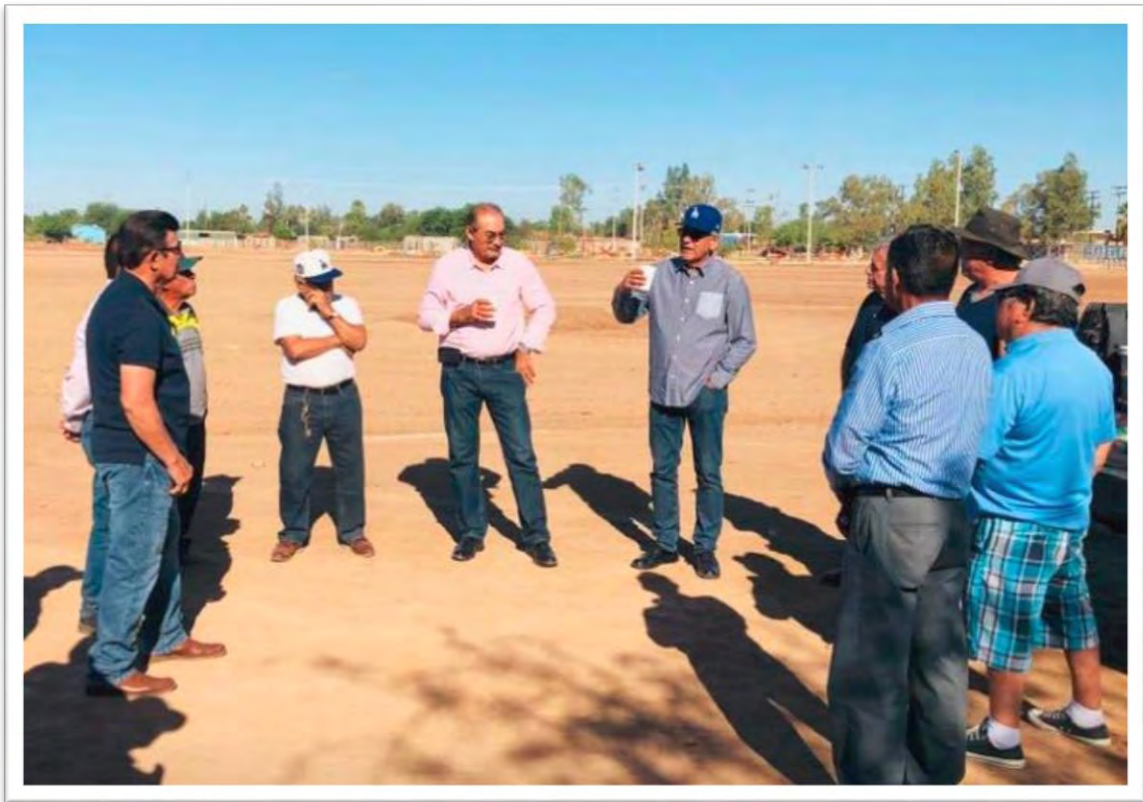
De visita en Islas Agrarias, en compañía de la liga de béisbol de veteranos, a quienes apoyamos. 21 septiembre 2019.