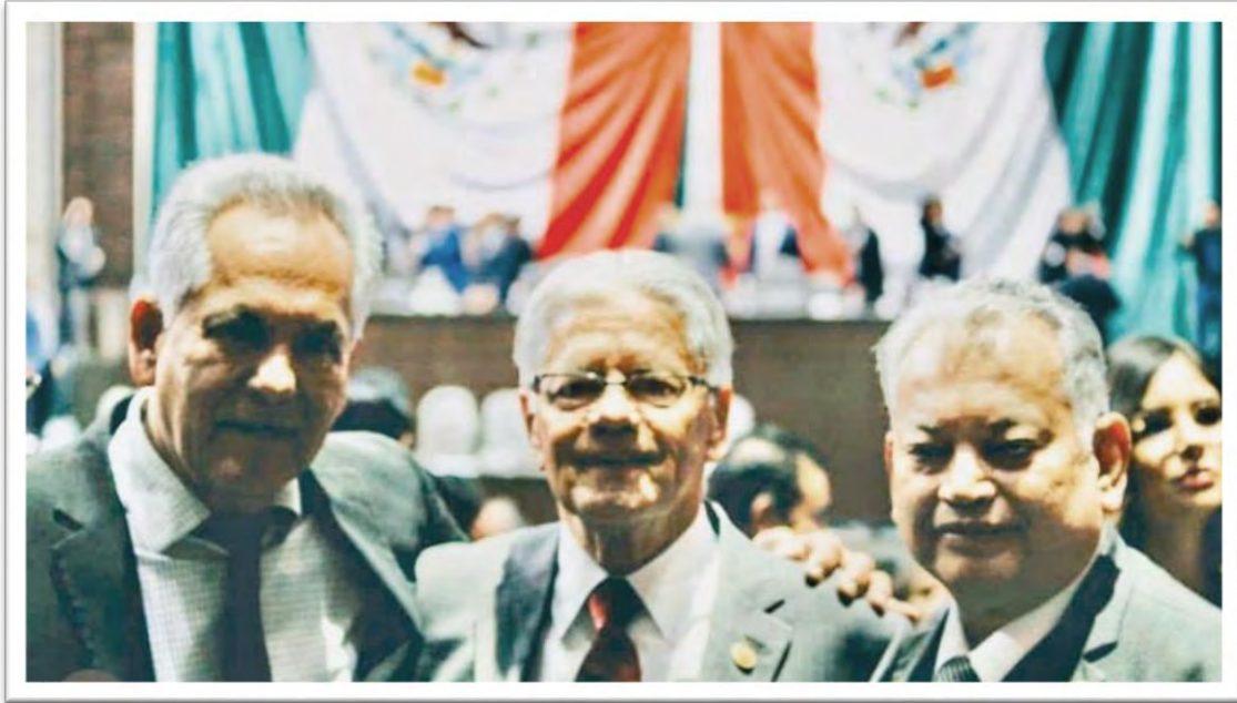
Inicio de los trabajos legislativos correspondientes al Segundo Período de Sesiones del Segundo Año de Ejercicio de la LXIV Legislatura de la Cámara de Diputados. 2 febrero 2020