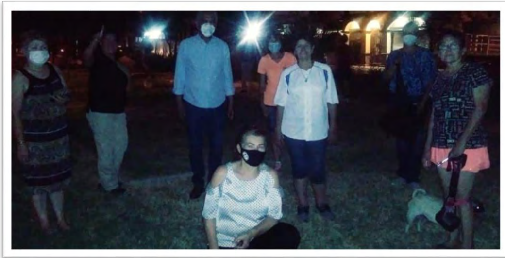
Reunión con mesa directiva del Fraccionamiento Paseos del Sol, donde se solicitó apoyo para el mejoramiento de su parque comunitario. 13 agosto 2020.