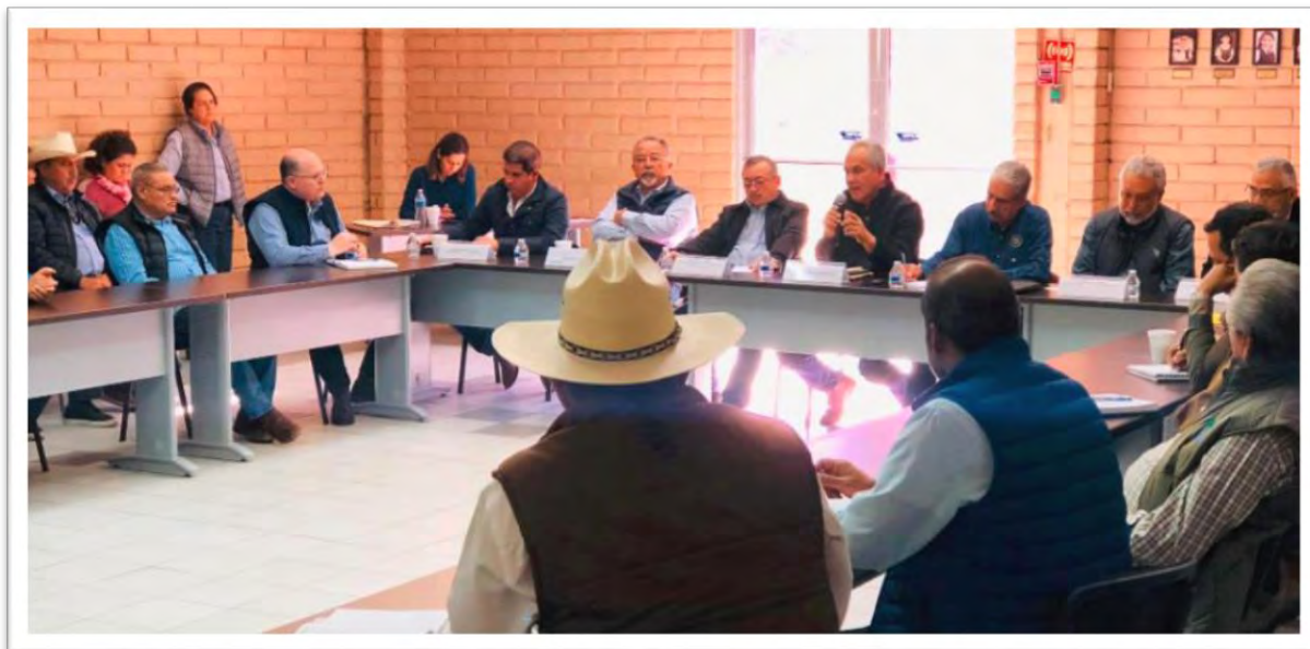
Reunión de trabajo con usuarios de los acuíferos 210 del Valle de Mexicali, y 2601 de San Luis Río Colorado, Sonora, con la asistencia de funcionarios de la Comisión Nacional del Agua CONAGUA, Comisión Estatal de Servicios Públicos de Mexicali CESP, Secretaría del Campo y Seguridad Alimentaria SCSA, y del Distrito de Riego. 13 diciembre 2019