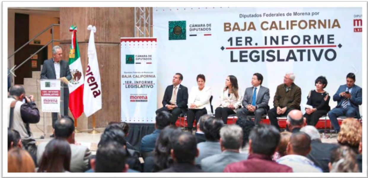
Presentación del Primer Informe Legislativo de Actividades, con diputados federales de Baja California de Morena de la LXIV Legislatura. 6 diciembre 2019.