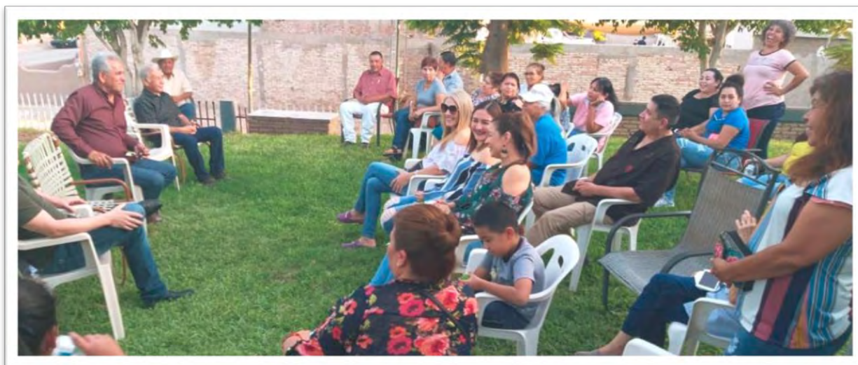
Reunión con vecinos del poblado Los Algodones, donde se acordó realizar gestiones para resolver diversos problemas de la localidad. 29 septiembre 2019.