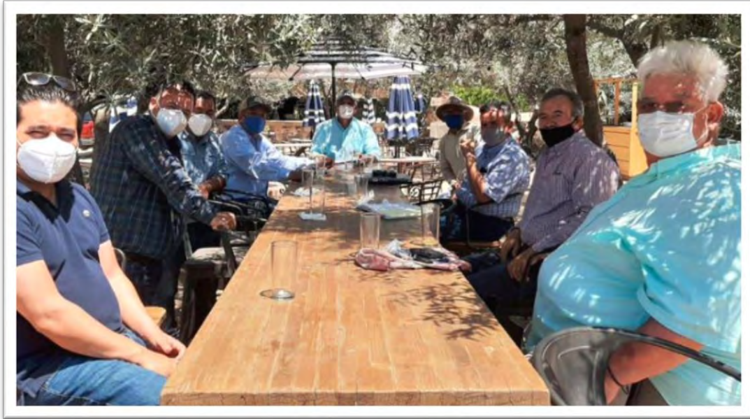
Reunión con vinicultores del Valle de Guadalupe, y con usuarios de agua potable de la Ciudad de Ensenada, Baja California. 17 agosto 2020