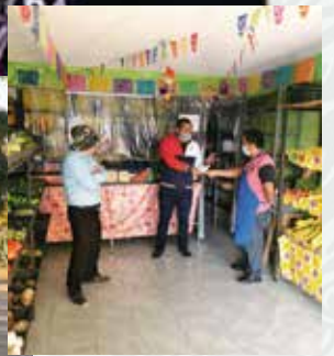
Apoyo a personas de escasos recursos Tecamachalco, Pue.