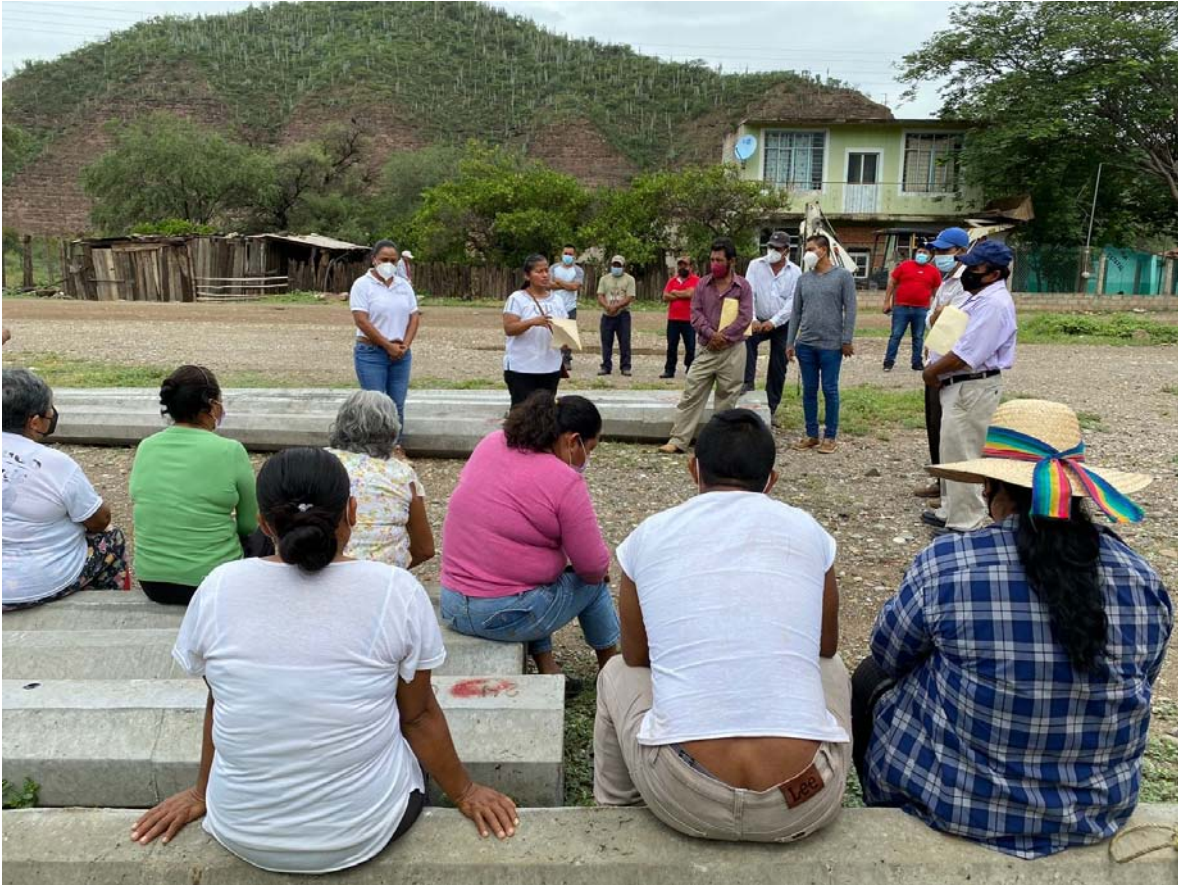
Foto: Colonia Benito Juárez o la Estación, Santiago Quiotepec, San Juan Bautista Cuicatlán, Oaxaca.