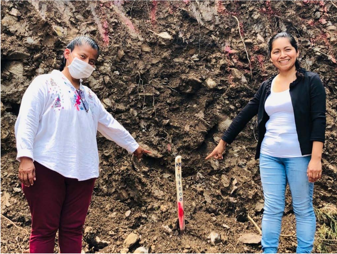
Foto: Camino a Santiago Quetzalapa, San Pedro Sochiapam, Oaxaca.

Para el año 2021, se logró la gestión ante la Secretaría de Comunicaciones y Transportes del inicio de la elaboración de los estudios y proyectos ejecutivos de ingeniería de los caminos de "San José Vista Hermosa - Tierra Colorada - San Pedro del Río, tramo del km. 0+000 al km. 4+500, con una meta de 4.5 km.", "Santa María Yahuive - Arroyo Venado, tramo del km. 0+000 al km. 15+000, con una meta de 15.0 km." y "la Segunda Esperanza - Paraíso, tramo del km. 0+000 al km. 6+200, con una meta de 6.2 km.". ubicado en el Estado de Oaxaca.