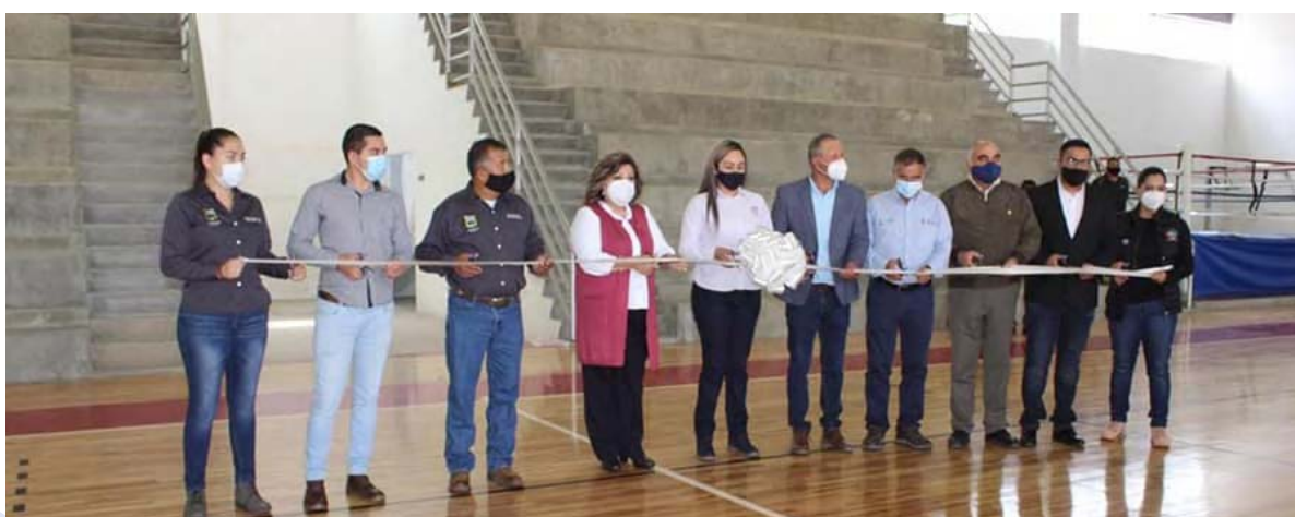
Inauguración Gimnasio Santa Bárbara