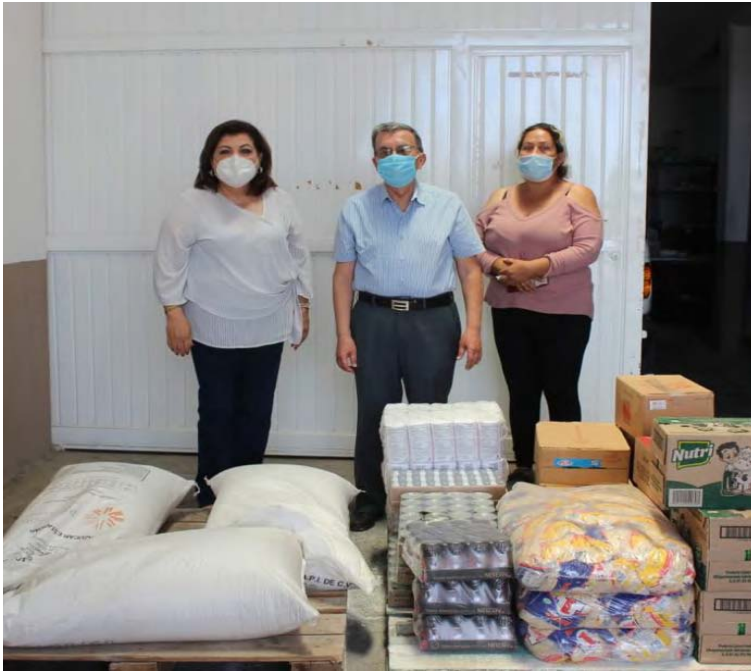
Cáritas de Parral Banco de Alimentos