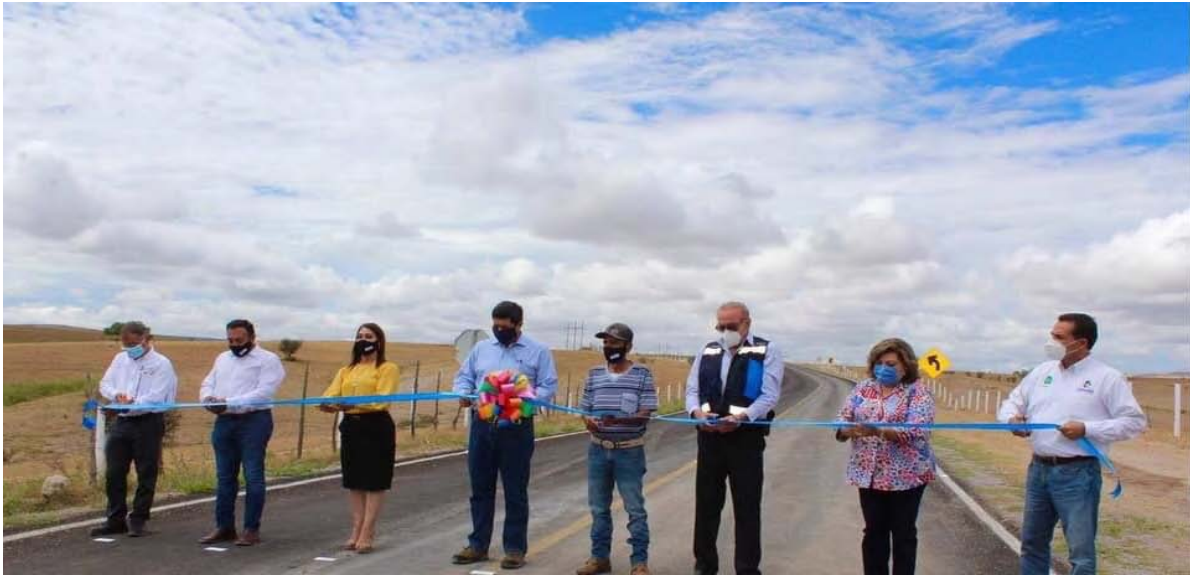
Rehabilitación carretera San Francisco de Borja