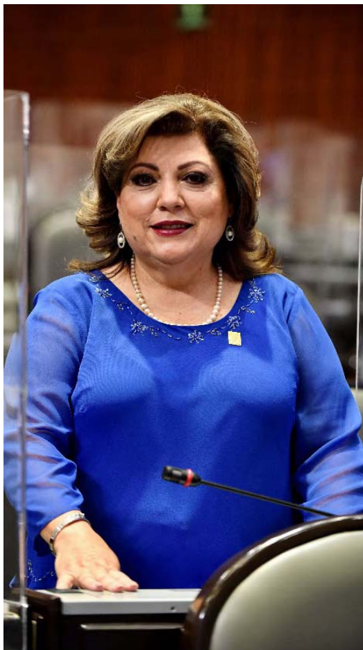
María de los Angeles Gutiérrez Valdez Diputada Federal Distrito 09 del Estado de Chihuahua

A través de este Tercer Informe de Actividades Legislativas, quiero hacer de su conocimiento de las acciones realizadas durante estos tres años de trabajo, con diversas propuestas a favor de cada ciudadano, de mi distrito, de mi estado Chihuahua y México.