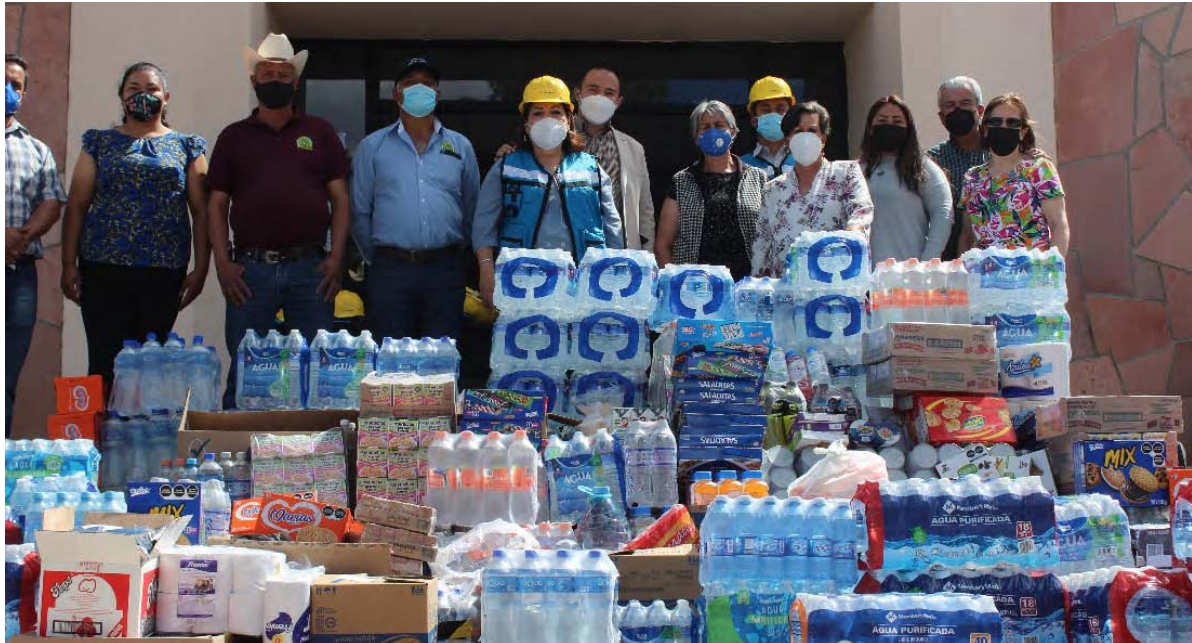
Entrega a UMAFOR, Guachochi