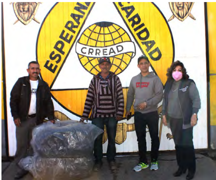
Apoyo con cobijas a Centro de Rehabilitación PARRAL