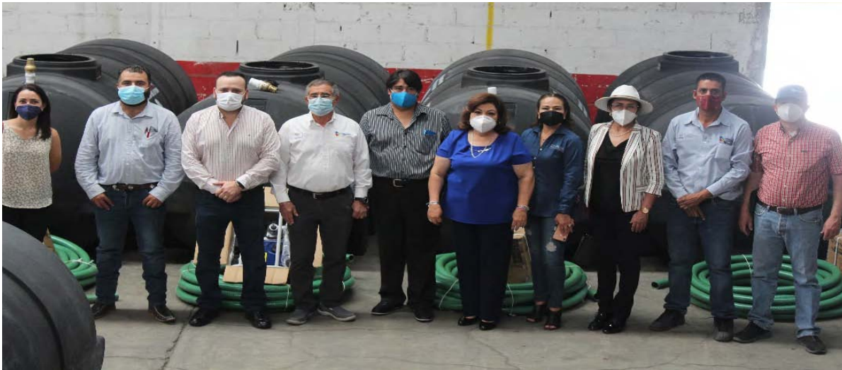
Entrega de tanques para agua con bomba