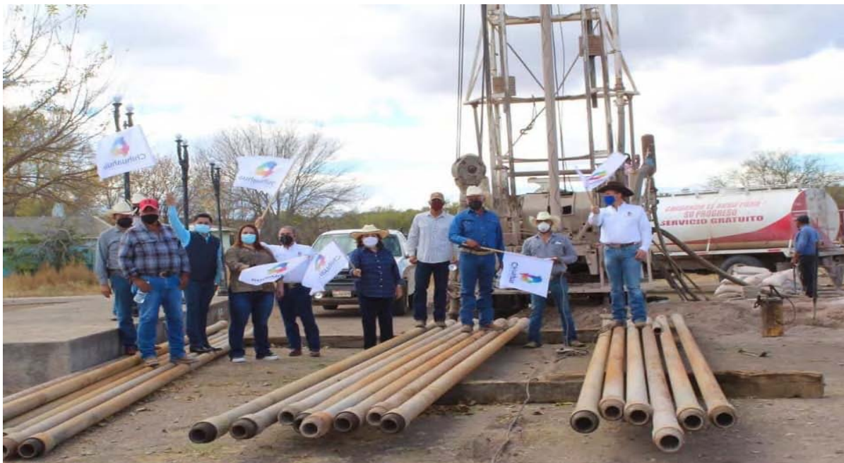
Perforación Pozo de agua Coronado