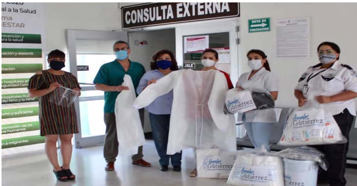
Entrega de equipo e insumos a médicos y personal de salud