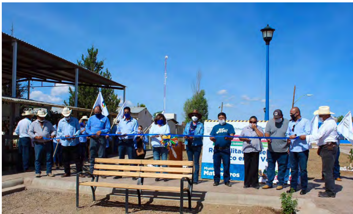
Parque El Verano Matamoros