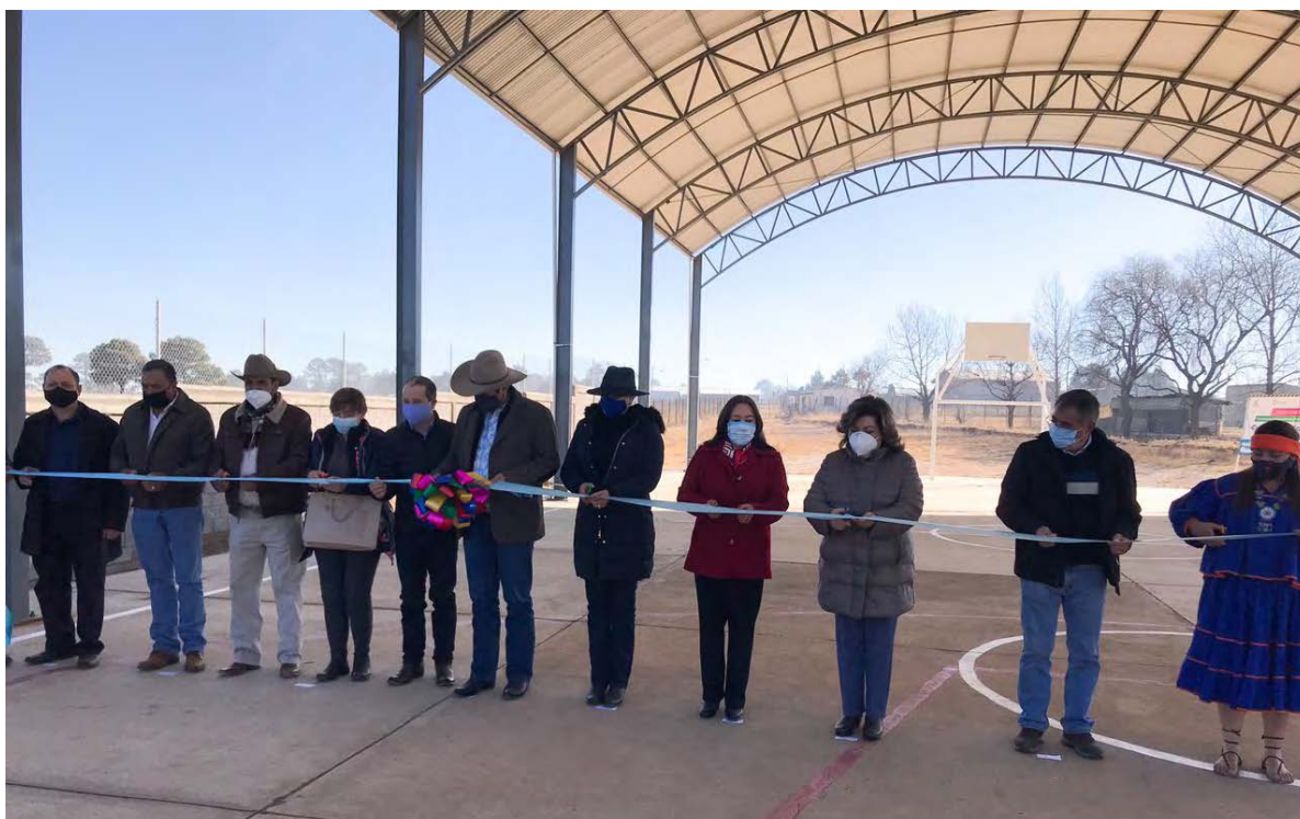
Inauguración cancha y domo Cuitláhuac Guachochi