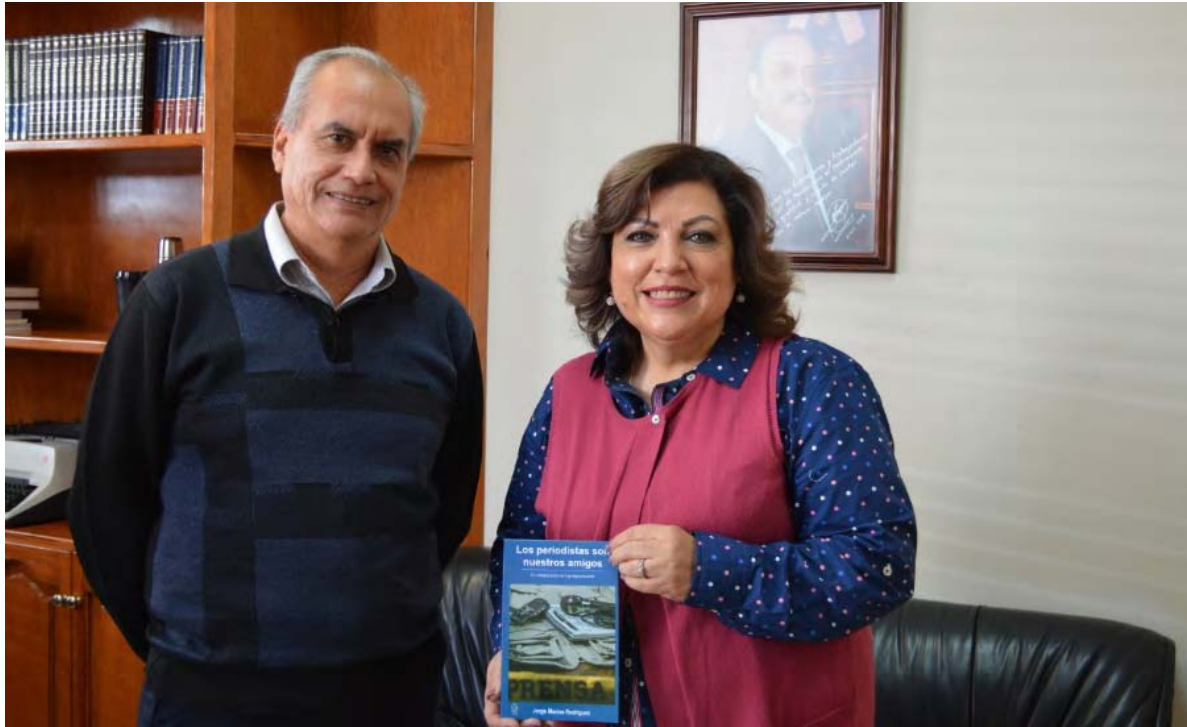
El Sol de Parral