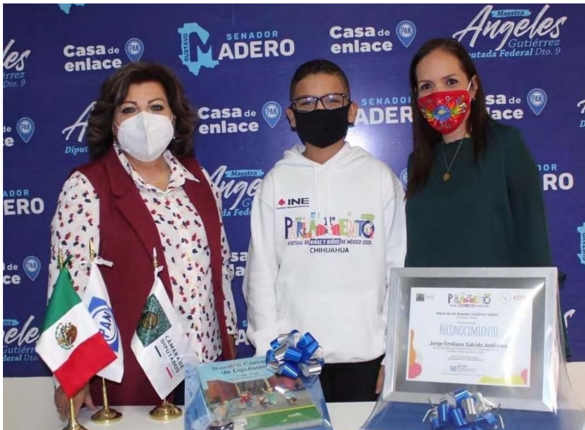
Reconocimiento al mérito Diputado Infantil 2020