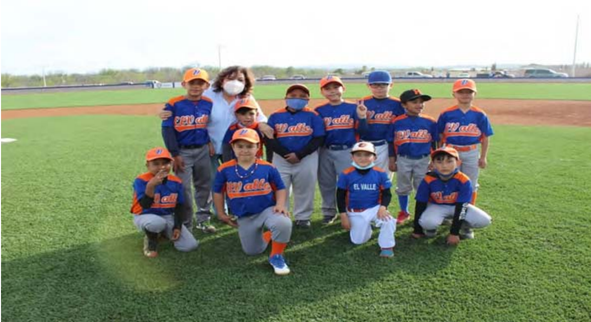
Inauguración Estadio de Beisbol infantil