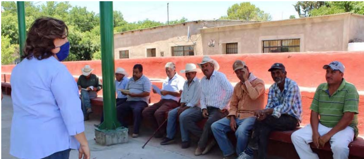
Productores del Campo López