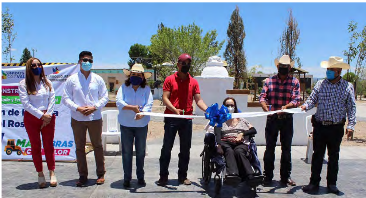
Remodelación de la plaza Rosario