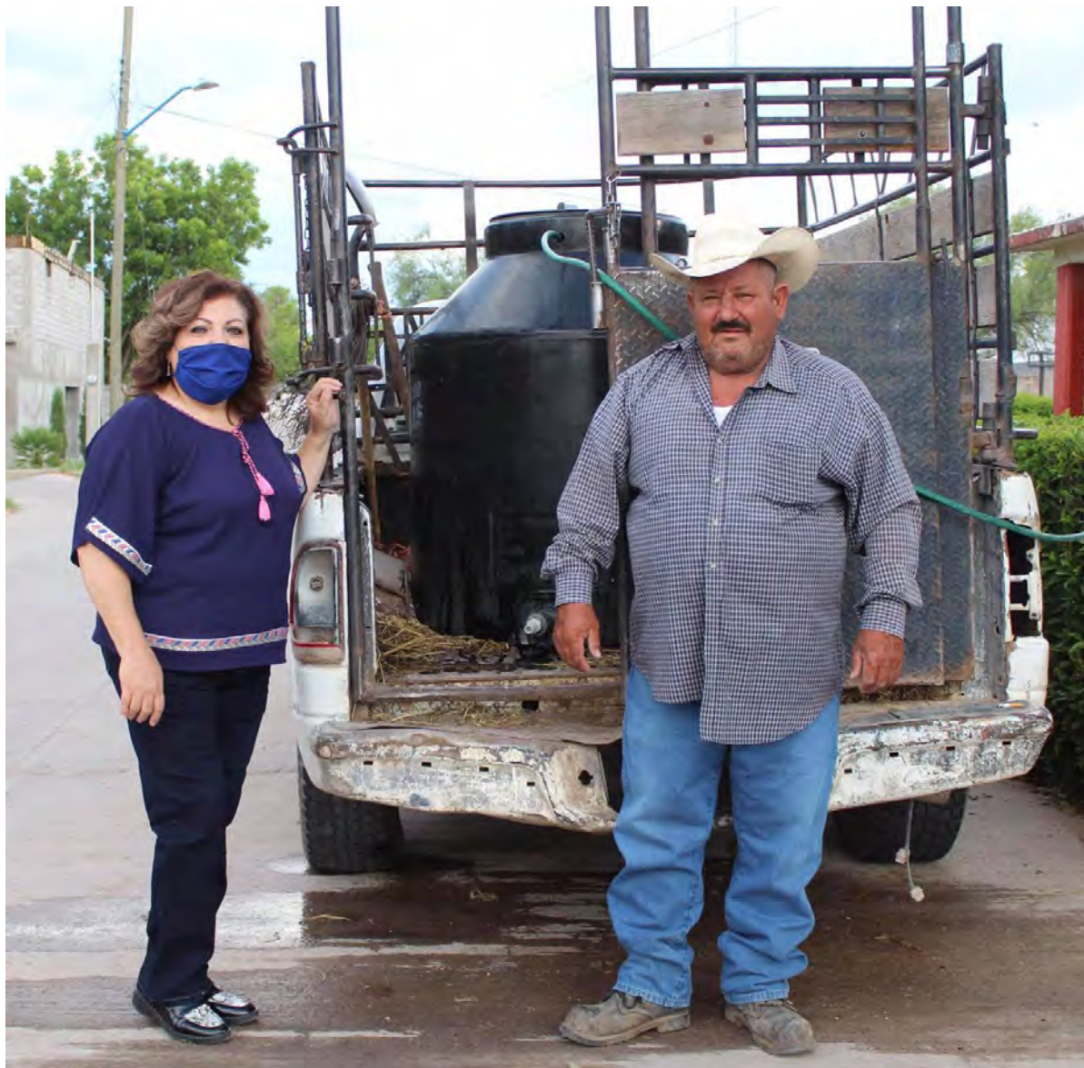
Apoyo con tanque de almacenamiento