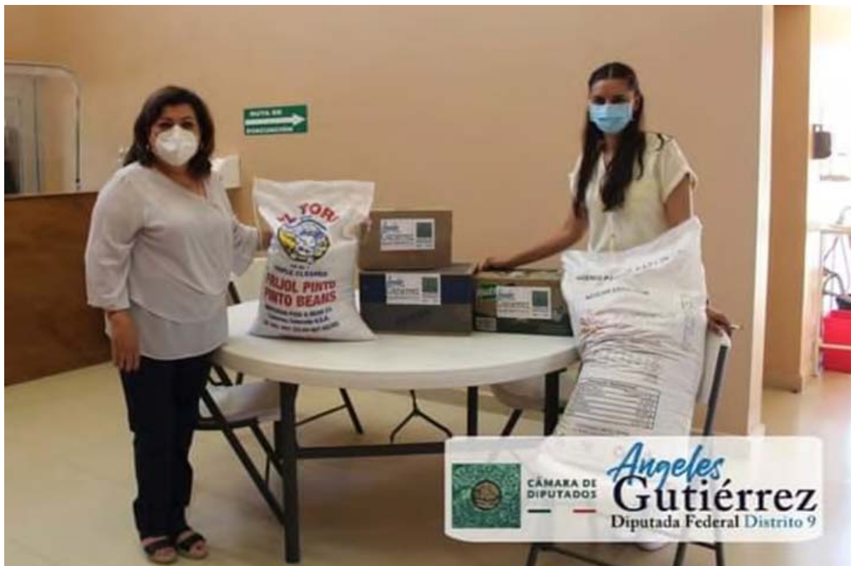
Albergue del Hospital General de Parral