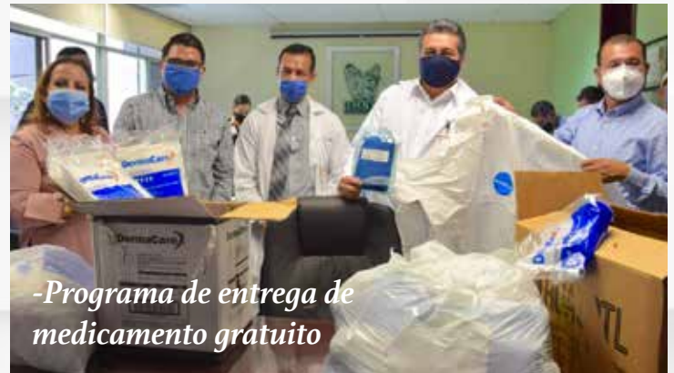
-Programa de entrega de medicamento gratuito