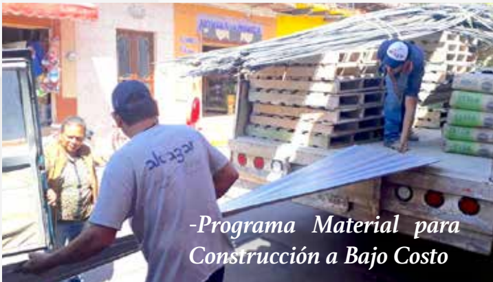
-Programa Material para Construcción a Bajo Costo