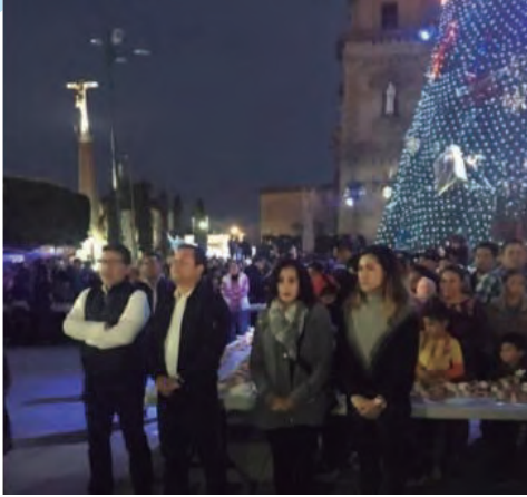
Rosca de Reyes Ocotlán, Jalisco.