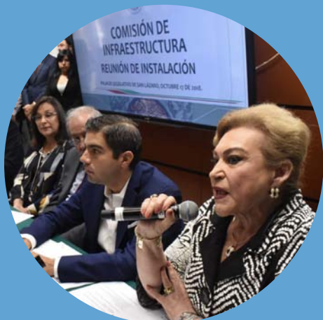
Secretaria Comisión de Infraestructura