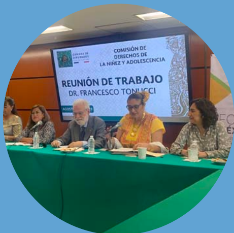
Integrante Comisión de los Derechos de la Niñez y Adolescencia