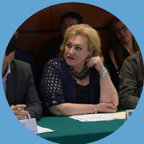
Integrante Comisión de Deporte