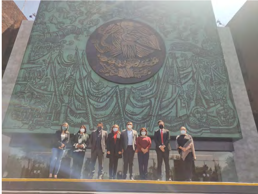
VISITA CON ARTESANAS