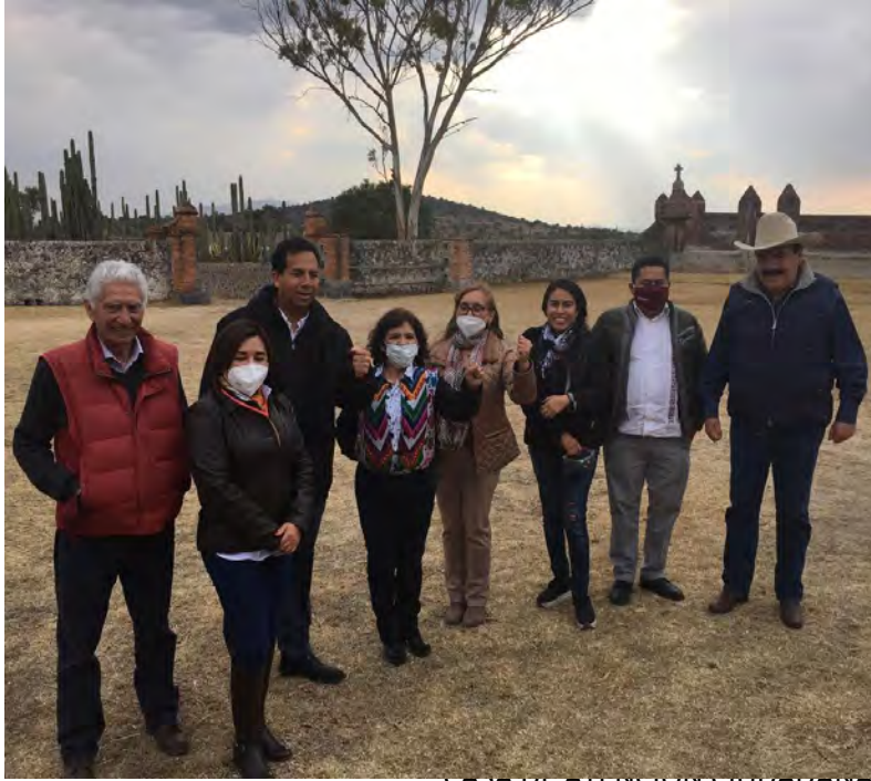
CASA DE ATENCIÓN CIUDADANA

VISITA DEL COORDINADOR DEL GRUPO PARLAMENTARIO DE MORENA AL ESTADO DE HIDALGO