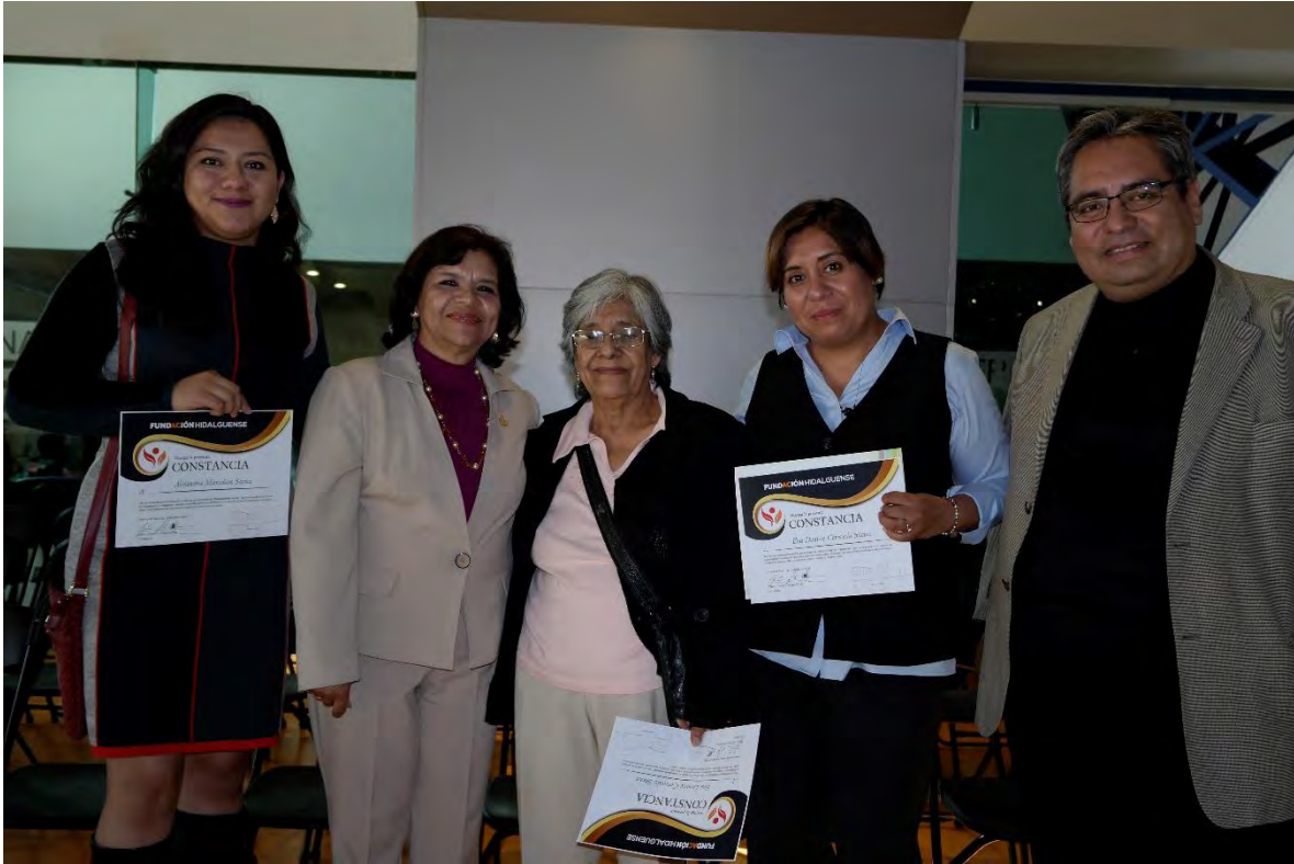
CONTACTO CON LOS JÓVENES