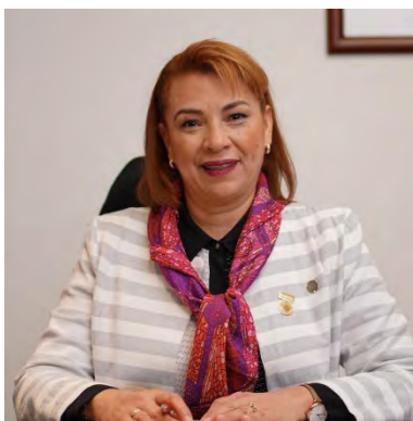
Dip. Fed. Lucía Flores Olivo Cuarta Circunscripción Venustiano Carranza, CDMX

Ten la certeza que continuaré siendo un puente entre la ciudadanía y el Congreso, trabajando por legislaciones favorables para la gente y defendiendo el proyecto de Nación del Presidente López Obrador. Estoy segura que ¡Con esperanza podemos seguir transformando este gran país!