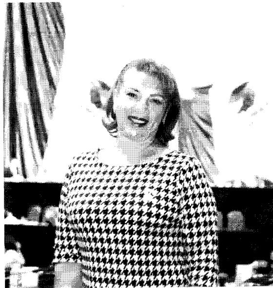
Dip. Fed. Lucia Flores Olivo Cuarta Circunscripción Venustiano Carranza, CDMX

Ante ello, conforme a lo dispuesto en el artículo 8, numeral 1, fracción XVI, del Reglamento de la Cámara de Diputados del H. Congreso de la Unión, presento este informe detallando los trabajos realizados para construir esperanza.