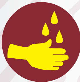
Lavar manos y utilizar gel antibacterial