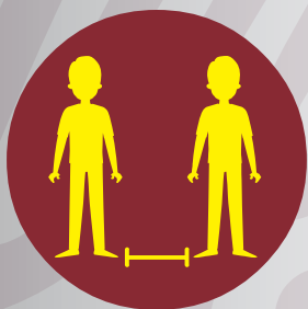
Evitar aglomeraciones y mantener sana distancia