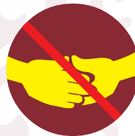
Evitar el contacto físico (saludar de mano)