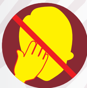
NO tocar ojos, nariz o boca