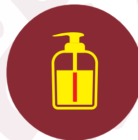
Desinfectar lugares y superficies