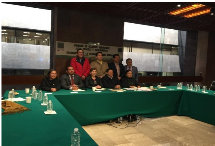
Término de la Sesión Ordinaria en la que se aprobó el PEF 2019 24 de diciembre 2018