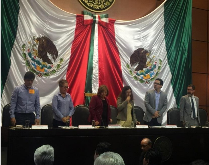
Mesa de trabajo "Adaptación basada en Ecosistemas" en el marco de la Semana temática "México ante el cambio climático" 24 de junio de 2019