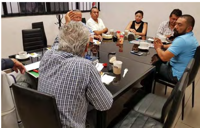
Reunión con Colegio de Arquitectos de Morelos A.C, con la idea de trabajar conjuntamente en proyectos de alto impacto.