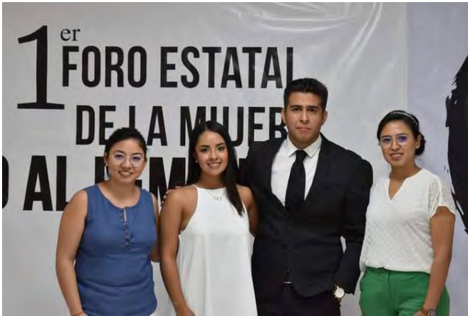
Foro Estatal de la Mujer, No al Femicidio en Cuernavaca, Morelos.