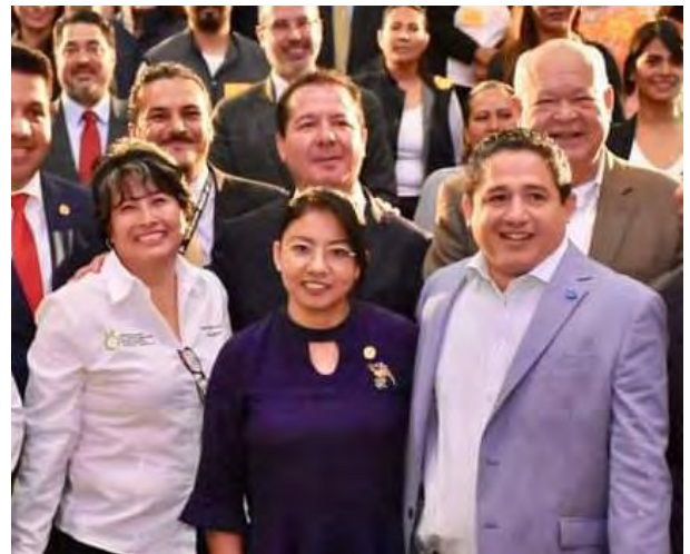
Foro Nacional de Regulación de la Herbolaria y Medicinas Complementarias.