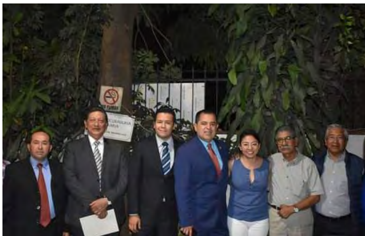
Foro procesal en materia agraria en la Procuraduría Agraria.