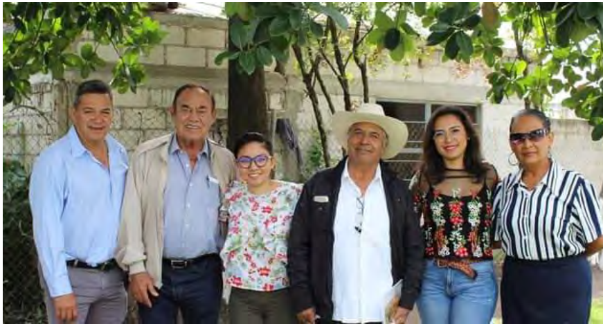
Reunión con compañeros y amigos del municipio de Ayala.