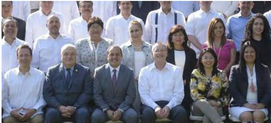
Foro Binacional de Transparencia México – E.U.A.

Inauguración del Coater Jumbo México, de la empresa Saint-Gobain, en el parque industrial en el municipio de Ayala.