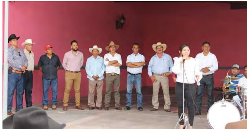
Reunión Asociación de Cañeros Flor de Caña A.C.