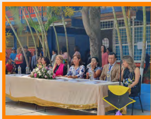
Invitación a la graduación de estudiantes de primaria en el municipio de San Pedro Tlaquepaque.