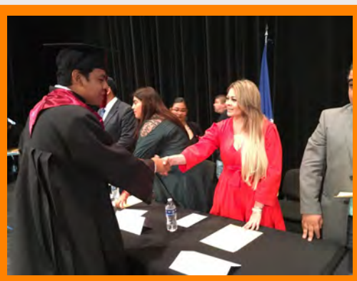
Invitación a la graduación del Colegio de Bachilleres del estado de Jalisco

Por invitación de los ciudadanos y funcionarios públicos, he asistido a reuniones de colonos, graduaciones de escuelas primarias y secundarias, inauguración de espacios u obras públicas. Estos espacios se convierten en oportunidades para entablar dialogo con ciudadanos, para escuchar problemáticas y brindar soluciones.