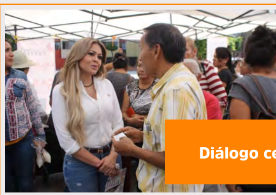
Diálogo cercano y sincero