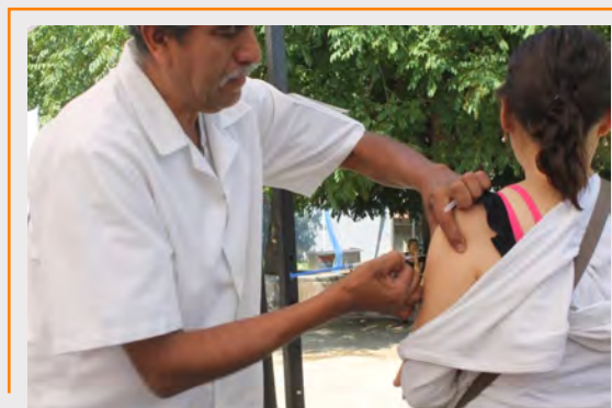
Servicios gratuitos a los ciudadanos