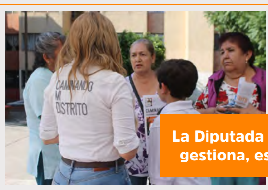
La Diputada con un equipo que gestiona, escucha y resuelve.

Esta exitosa estrategia ha sido adecuada, porque el ciudadano entabla un dialogo en un lugar abierto e idóneo, no en una oficina fría y enajenada del espacio donde las necesidades son otras, ahora se conversa desde donde se debe realizar el acompañamiento y la intervención.