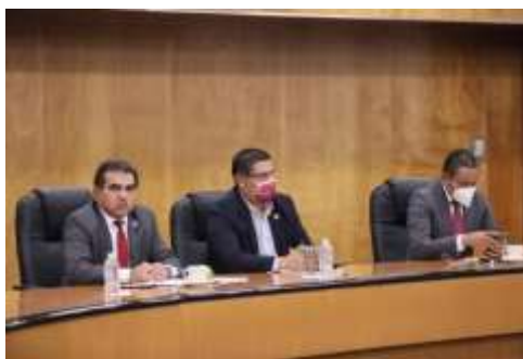
Defensa del PEF en Comisión de Presupuesto

Reunión con Gobernadores rumbo la aprobación del PEF 2021 y la Junta de Coordinación Política de la H. Cámara de Diputados.