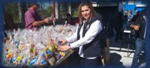
Posada del Comité Municipal del Partido Acción Nacional