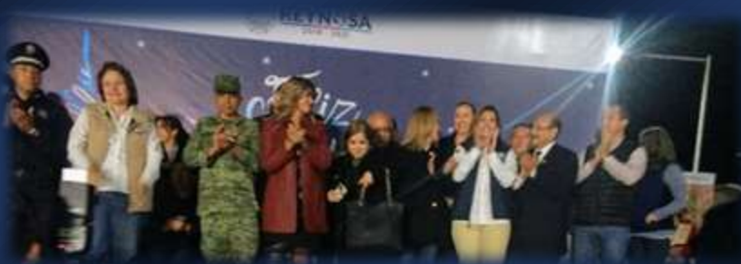
Encendido de pino en la plaza principal de Reynosa, Tamaulipas.