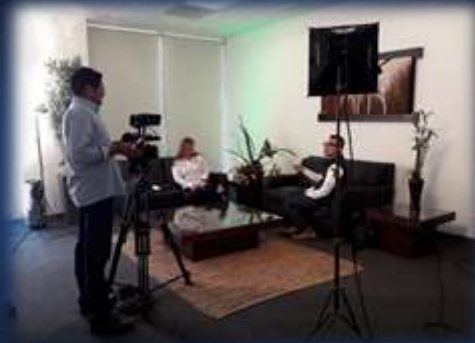
Entrevista en el programa “Hoy Tamaulipas”, en Ciudad Victoria, Tamaulipas.