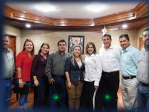
Visita a colonos del fraccionamiento Bugambilias en Reynosa, Tamaulipas.