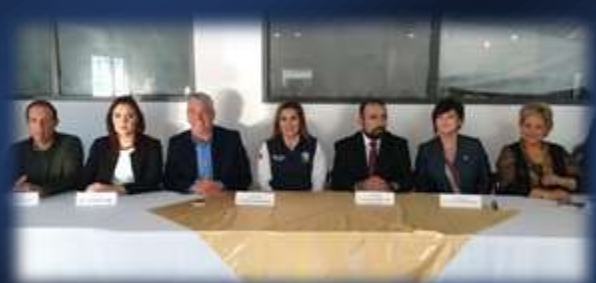
Entrega de dulces a diferentes escuelas primarias de la ciudad.