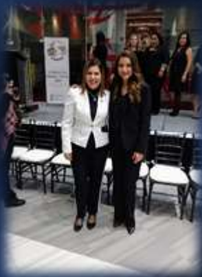
Toma de protesta del Nuevo consejo Directivo 2019 de la Asociación Amigas con Corazón, A.C.