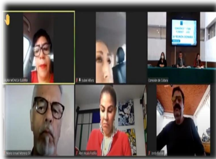
FOTO: Reunión semipresencial de la Comisión de Cultura y Cinematografía

Los temas sobresalientes fueron el Programa S268 de apoyos a la cultura, festivales (PROFEST), Apoyo a la Infraestructura Cultural de los Estados (PAICE), Apoyo a Instituciones Estatales de Cultura (AIEC), Programa de Apoyo a las Culturas Municipales y Comunitarias (PACMyC), Fondo de Apoyo a Comunidades para Restauración de Monumentos y Bienes Artísticos de Propiedad Federal (FOREMOBA), el Programa de Ciudades Patrimonio, el rediseño del FONCA y el seguimiento al Proyecto Cultural Chapultepec.