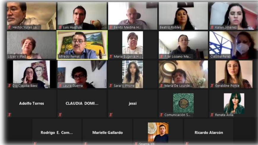
FOTO: Reunión virtual de trabajo de la Comisión de Relaciones Exteriores

El trabajo legislativo se realizó durante los meses de noviembre y diciembre de 2020, y entre marzo y abril de 2021, con votaciones verificadas en cuatro reuniones ordinarias.