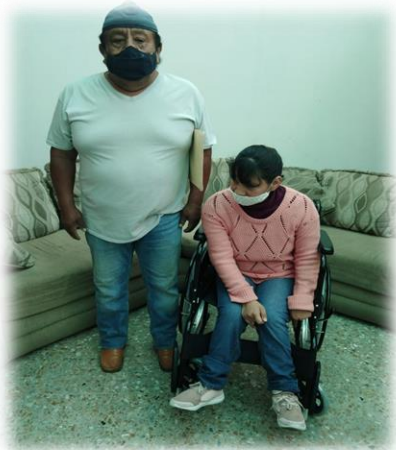
FOTO: Silla de ruedas entregada a vecinos del pueblo de San Martín Tepetlixpan

La ciudadanía se acerca para solicitar información diversa, puede ser de programas sociales, hacer trámites en línea, asuntos en específico que requieren ser vistos en otras instancias, hay inquietudes y necesidades distintas que son atendidas y según su origen son canalizadas al área correspondiente.