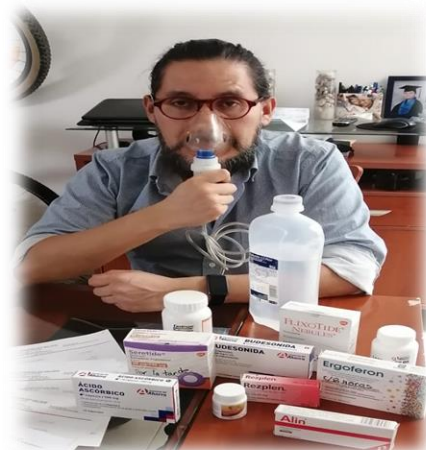
FOTO: Medicamentos entregados a vecino de la colonia Cumbria, Cuautitlán Izcalli