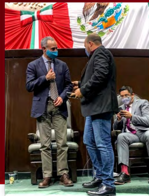
COMPARECENCIA DEL SECRETARIO DE SALUD