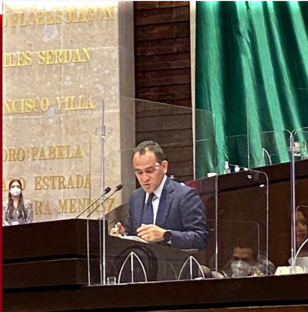
COMPARECENCIA DEL TITULAR DE LA SECRETARÍA DE HACIENDA