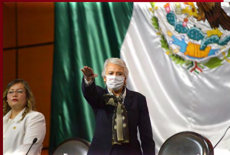
COMPARECENCIA DE LA SECRETARIA DE GOBERNACIÓN