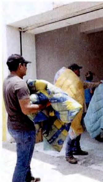
Apoyo de distintos víveres a damnificados por fuertes lluvias en los Municipio de González y Miquihuana