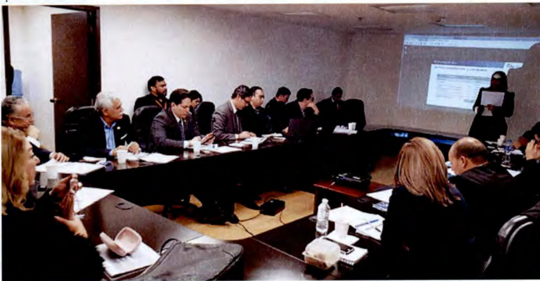
Reunión con Diputados Federales de Tamaulipas para integrar las propuestas de proyectos del Estado de Tamaulipas.