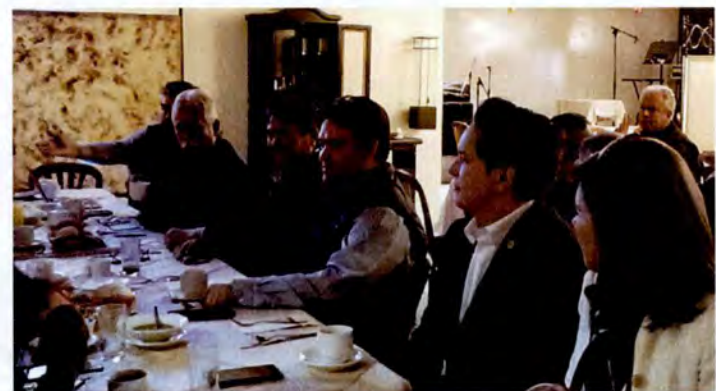
Reunión con Consejo Agropecuario de Tamaulipas Diputados de Tamaulipas.