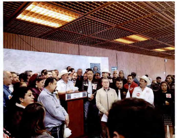
Conferencia de prensa para seguir luchando por el aumento al presupuesto dirigido al campo

Los diputados federales del Partido Acción Nacional consideramos que la propuesta de Paquete Económico 2019 de Andrés Manuel López Obrador no cumple con las expectativas de cambio ni la mejora que prometió; levantamos la voz por la educación, la salud, el campo y las mujeres. ¡Exigimos un presupuesto digno y justo que atienda las necesidades de los mexicanos!