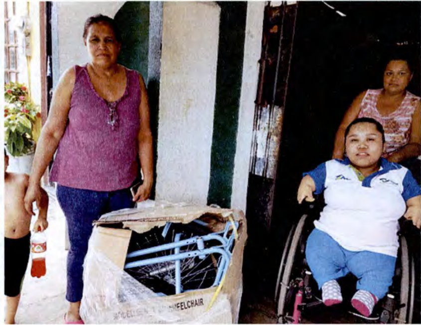
Apoyos de Sillas de Rueda a personas de escasos recursos que por su condición física de salud y económica lo requerían, en los municipios de González, El Mante y Xicoténcatl