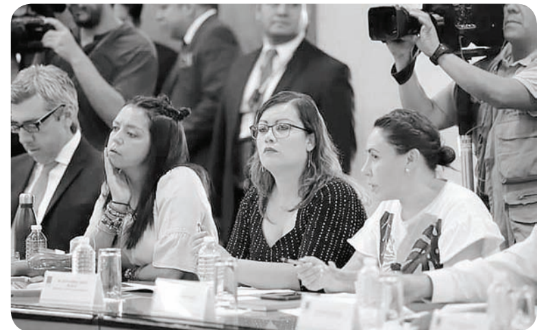
Se dota de plena transparencia el ejercicio del gasto público.

Se da respuesta a una reiterada y sentida demanda ciudadana.