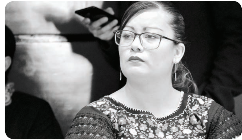
Desaparecer esa brecha existente entre inmunidad e impunidad.

Acabar con la corrupción es un compromiso con México, queremos que la Cuarta Transformación sea histórica, que haya señales inequívocas de un cambio político en beneficio de la población.