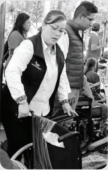
Entregamos sillas de ruedas.