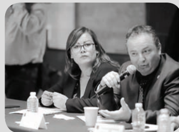
Se exhortó a los 32 gobiernos estatales para incrementar medidas para atender la violencia contra las mujeres.