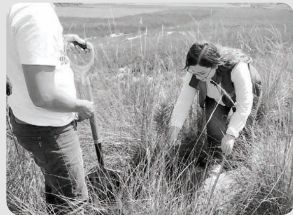
Jornada de reforestación.

* Realizamos diversas capacitaciones para el Empoderamiento de la Mujer Poblana.