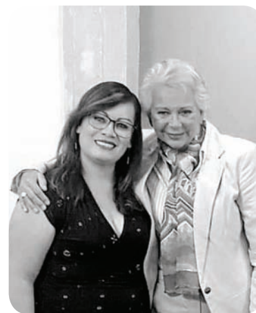
Olga Sánchez Cordero.