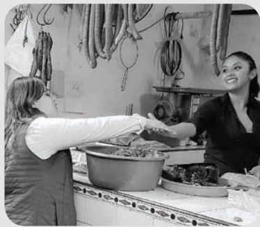
Siempre escuchamos a todos los sectores de Puebla.