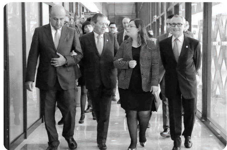
Escuchando los consejos de Porfirio Muñoz Ledo.