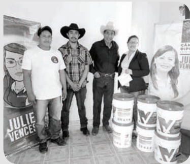
Atentos a las necesidades de la población.

* Aperturamos dos Casas de Enlace para atender las necesidades de nuestra gente. Una en Ciudad Serdán y otra en Felipe Ángeles.