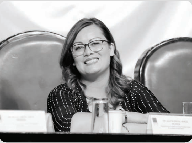
La reforma educativa elimina el carácter punitivo de las evaluaciones a los docentes.