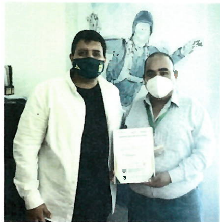
Zapotlán de Juárez